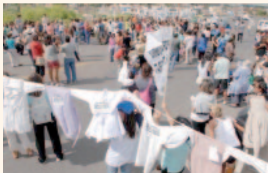
Docentes rionegrinos ganan las rutas

La muerte del Secretario Gremial de UnTER y el brutal ataque acuchillando a un docente demandaban la firme exigencia de paro a CTERA. Eso no ocurrió y el ataque se planteó más como hecho poli-