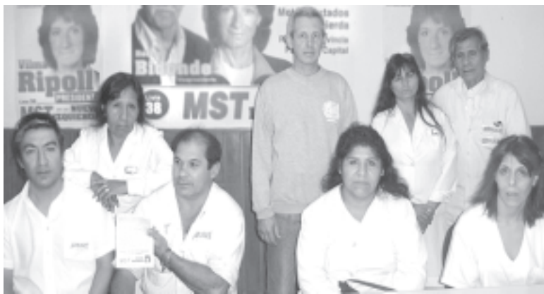
Trabajadores de Arrufat en el local del MST, luego de la marcha del 17/3