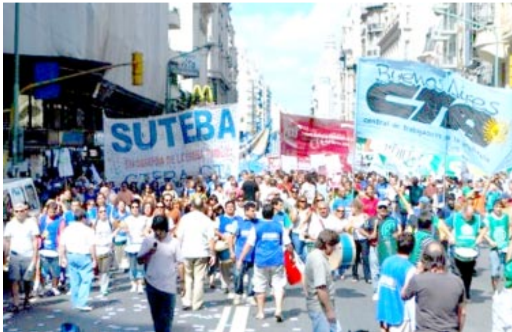
Marcha SUTEBA y CTA del 25/3

Es hora de cambiar a esta dirigencia aliada al gobierno K. Las asambleas de SUTEBA el miércoles 1 de abril son una oportunidad para dar el primer paso en la pelea por las elecciones convocadas para el 10 de junio. Ganar la Junta Electoral en las seccionales es el primer desafío, mientras