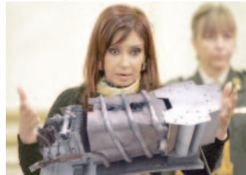
Frente a la crisis...canje de Kalefones

Al mismo tiempo, hay que abrir todos los canales posibles de participación, decisión y control democrático por parte de los trabajadores y el pueblo.