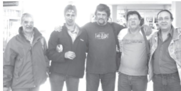
Parte de nuestra delegación integrada por dirigentes, delegados y activistas de la línea 60, Astilleros, CICOP, Telefónicos, ATE, AGMER y SUTEBA.

por eso tenemos que organizarnos, avanzar por la unidad y defender los intereses de la gran mayoría del pueblo".