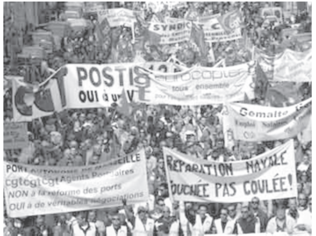
El 19 de marzo, tres millones de manifestantes en las calles de toda Francia.

de fuerza. Sarkozy no dijo ni una palabra. Es Fillon el encargado del mensaje de cierre frente al movimiento social.