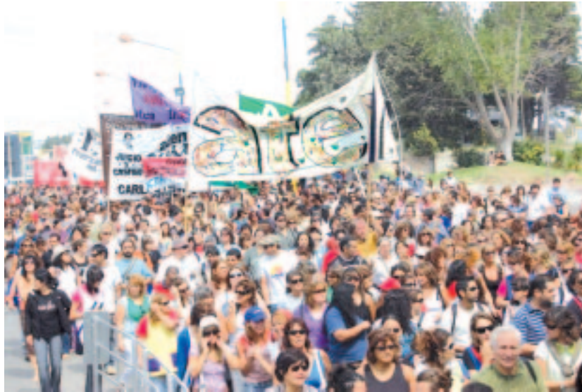
ATEN y UNTER marchan al Puente Carretero el 2/3

en todas las escuelas, continuemos la lucha y vayamos por lo que es nuestro.