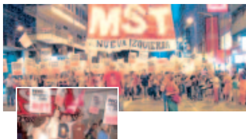
El MST movilizó importantes columnas en la Capital, Río Cuarto y Villa María.