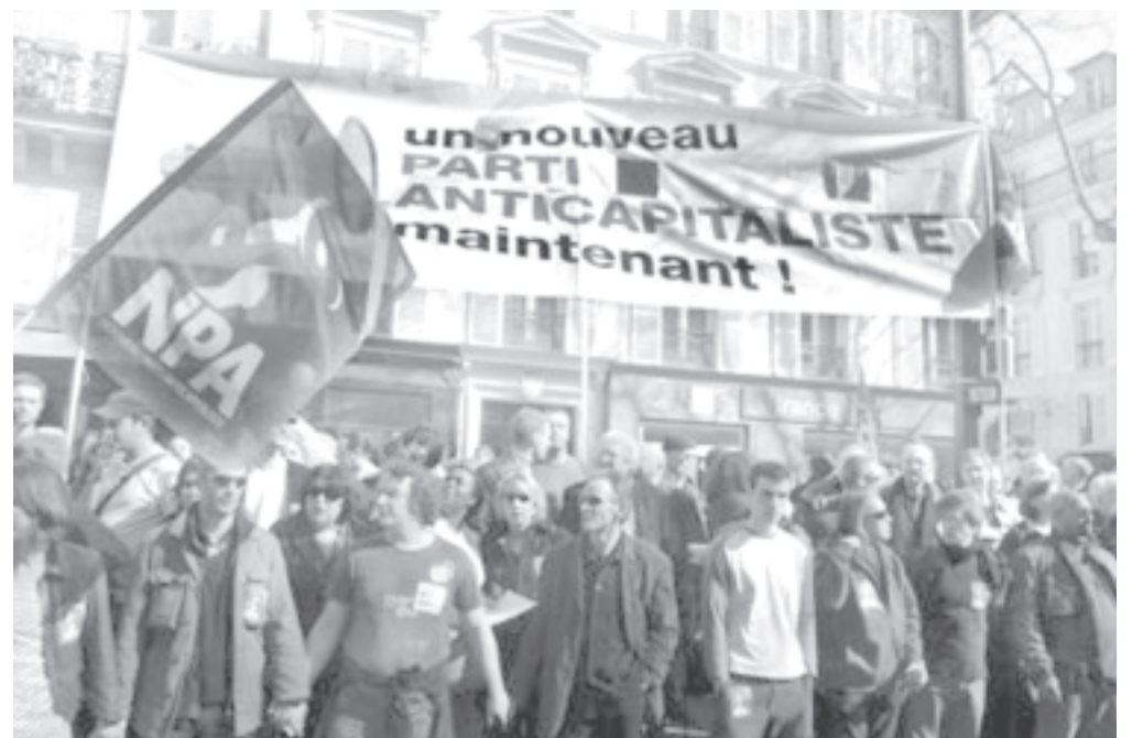
En un clima de ascenso social, crece la simpatía popular hacia el NPA y Olivier Besancenot