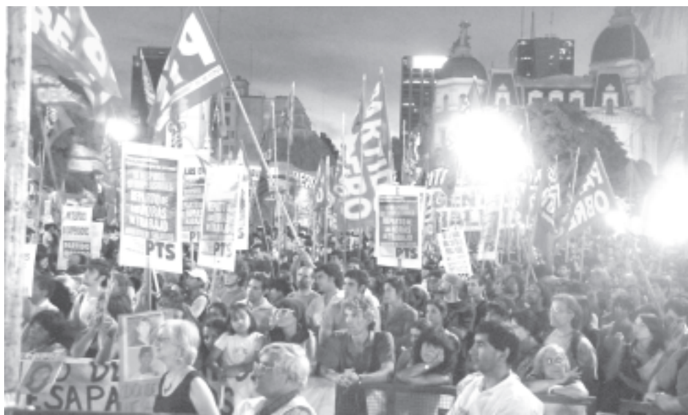
Partidos de izquierda en el acto del 24 en Plaza de Mayo

En el caso de la izquierda sectaria, es fácil ver que todo su planteo conduce a intentar demostrar quién es más revolucionario o quién tiene la “pura verdad”. Como siempre sucede en la historia, detrás de esa pretensión se esconden las capitulaciones. Así fue que, en la lucha agraria ante la 125, el PO y otros grupos fueron funcionales al gobierno, sin disputar por los pequeños chacareros, dejándoselos en bandeja al gobierno y a la derecha. El mismo oportunismo, hoy lo demuestra el PO en su última prensa, donde explica su oposición al planteo de Asamblea Constituyente, porque según ellos: “la iniciativa opositora la tienen los sojeros y la derecha continental anti-chavista. Una línea de sustitución del gobierno con la justificación de la Constituyente llevaría agua