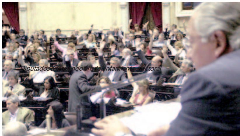
Diputados aprobando el adelantamiento electoral.

trabajadores. Pero es un hecho que por el rol nefasto de la CGT, que frena los reclamos, y la falta de un llamado a unificar los conflictos, no hay una situación de movilización ge-