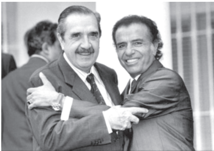
El abrazo del Pacto de Olivos

Alfonsín fue el dirigente patronal encargado de enfrentar esa enorme movilización popular desatada en el país a partir de la traición de Malvinas. Pese a los millones de votos obtenidos por la UCR y el RJ, salvo un primer periodo de confusión y expectativas, no pudo parar una pelea que exigía un modelo sustancialmente distinto al