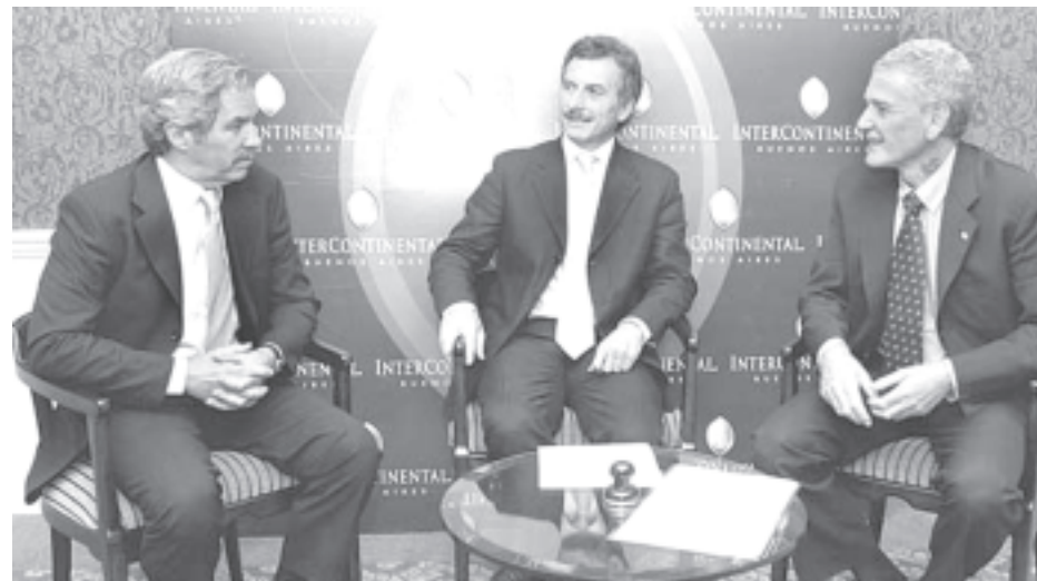
Solá, Macri y De Narváez, en la foto falta su padrino Duhalde

El Frente Justicialista para la Victoria es aliado de Rico, en Catamarca se unió a Saadi y Barrionuevo, claras expresiones de derecha. Es cierto que Macri fue menemista, que Solá fue funcionario del menemismo y que De Narváez hizo campaña por el riojano en Provincia de Buenos Aires, por eso el PRO y el PJ disidente pueden ser considerados de derecha. Pero igual de cierto es que los Kirchner fueron cómplices e impulsores de todas las medidas neoliberales de Carlos Saúl y de Duhalde como integrantes del PJ en el gobierno.