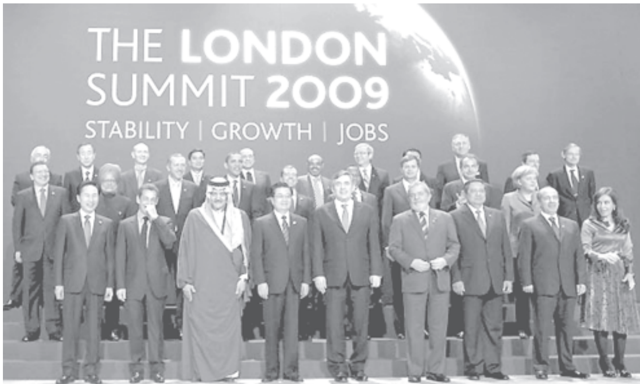
Reunión del G-20 en Londres

Por más que hablen de acuerdos y se saquen fotos sonriendo, la realidad es que la crisis se sigue profundizando. El mismo día de la cumbre se dio a conocer que en marzo en el mismo EE.UU. se perdieron 650.000 puestos de trabajo y que el desempleo ya llegó al 8,5% de la población registrada lo que constituye el nivel más alto desde 1983. En Europa ya hablan de millones de nuevos desempleados y el gigante chino, al que todos apostaban como locomotora que reemplazaría al imperio yanqui, aguarda para este 2009 la pérdida de 30.000 millones de puestos de trabajo. Lo mismo está sucediendo en nuestro país, donde por más declaraciones