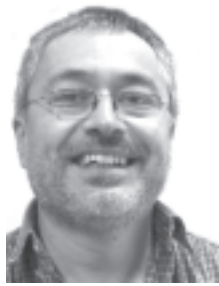
Escribe: Rubén Tzanoff

Hay que romper el círculo vicioso de votar por el supuesto “mal menor”.