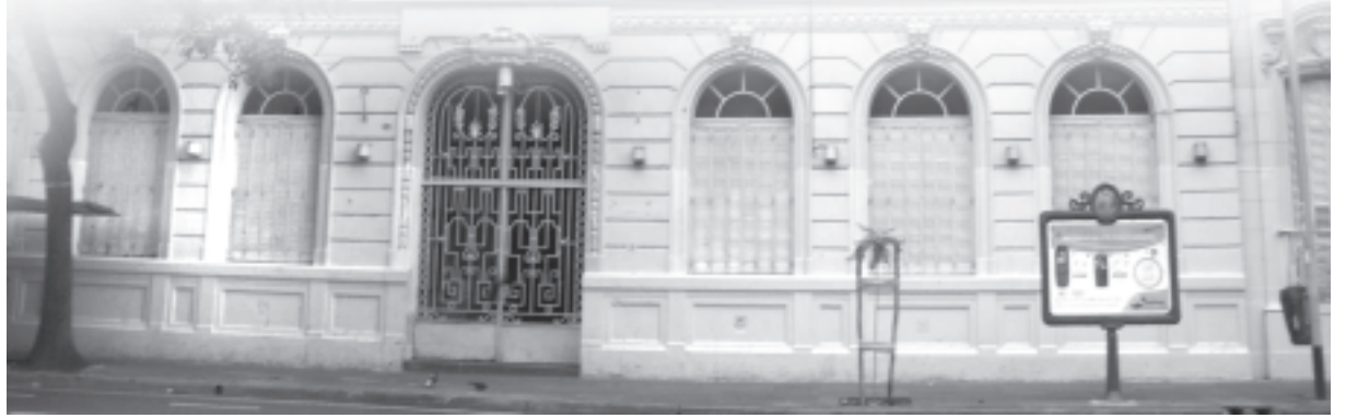
Un congreso a puertas cerradas

Las condiciones en las cuales las distintas fuerzas llegaron al Congreso brindaban una oportunidad única. Existía la posibilidad concreta de derrotar el intento de la Franja Morada y al mismo tiempo iniciar un nuevo rumbo en la FUBA, que parta de un balance crítico y autocrítico de su estado actual, y que reconozca la necesidad de lograr un cambio hacia una FUBA de izquierda pero amplia, democrática y participativa, sin hegemonismos, donde puedan participar todas las corrientes de izquierda e independientes que partan de la defensa de la educación pública y gratuita frente a la política del gobierno K y el rectorado. En definitiva, existía la posibilidad de fortalecer a la Federación de cara a las grandes peleas