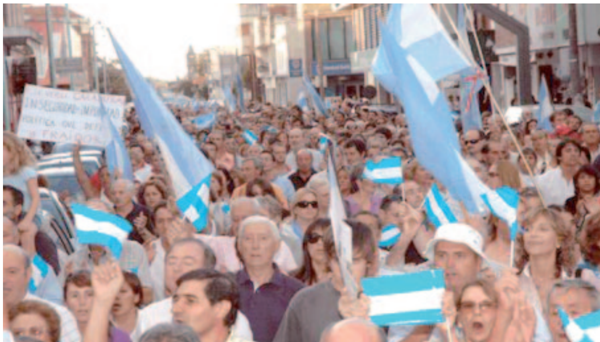
Marcha en Olavarría

hipocrecía pretender que con más tecnología, sistemas GPS, patrulleros, helicópteros y computadoras se