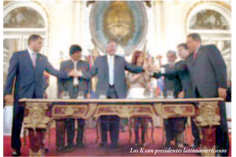
Los K con presidentes latinoamericanos

El Banco está planteado como un organismo de préstamo al que recurrirían los Estados para financiar obras de desarrollo estratégico o infraestructura. Bien, pero esto es una abstracción: la realidad es que las obras, como siempre, las construirán las empresas amigas del gobierno, cobrando sobreprecio, como siempre, y encima este crédito barato que obtendrán ni siquiera lo devolverán, como ya pasó en la década del '70 con la creación de la fraudulenta deuda externa y para colmo esta vez ni siquiera hará falta un Cavallo para "estatizar la deuda privada"... ya que los propios Estados serán los garantes del crédito. Es decir, la deuda está