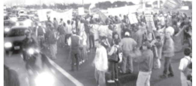
Corte de la Panamericana

Lo principal ahora es engrosar la comisión interna, que tiene únicamente dos delegados. Queremos pedir eso porque sa-