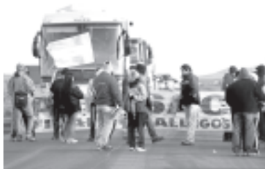
ADOSAC volanteando en la ruta 3