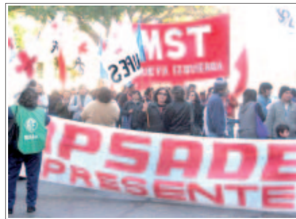
Movilización de la salud en Salta