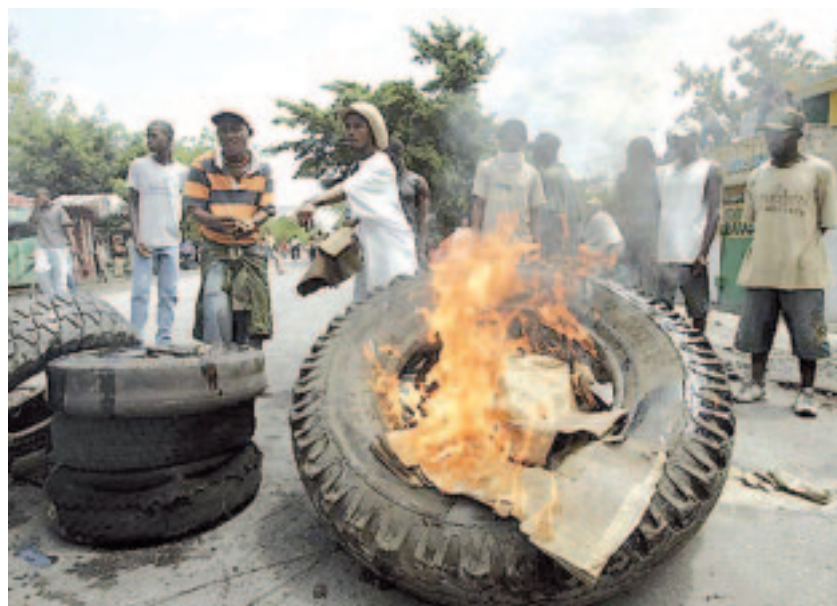
Rebelión por hambruna en Haití