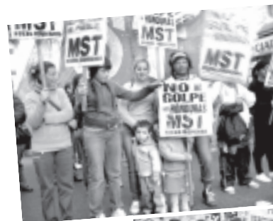
Marcha unitaria frente a la representación diplomática de Honduras en Argentina

Mucho se ha comentado del rol de Obama, cuando repudió el golpe y declaró que Zelaya debía re-