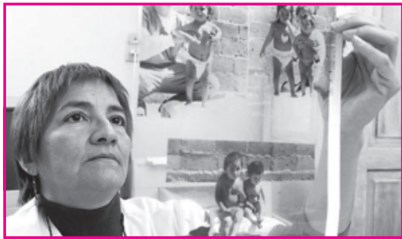
Una médica muestra la diferencia de altura entre gemelas, una desnutrida y la otra no.

Lamentablemente uno de los niños, falleció horas después del traslado, mostrando que los trabajadores tenían razón y que a pesar de los aprietes al personal y el ocultamiento de la verdad, la pelea por una salud pública, gratuita y de calidad va a continuar con más fuerza aún.