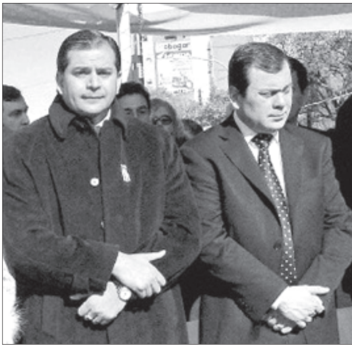
Julio Alegre y su amigo el gobernador Zamora

En Santiago del Estero se avizora un futuro negro para el Frente Cívico, la Concertación Plural