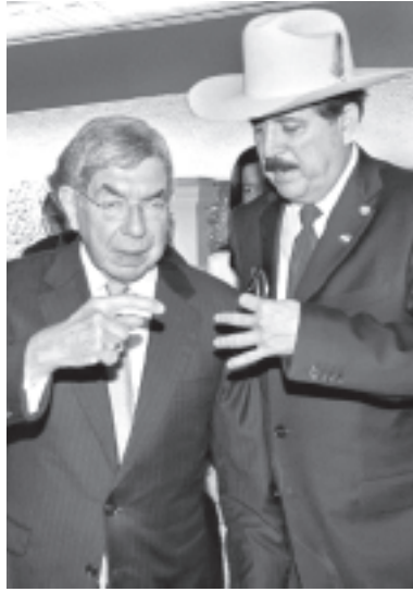
El presidente Zelaya y el golpista Micheletti junto al mediador elegido por EE.UU. Oscar Arias