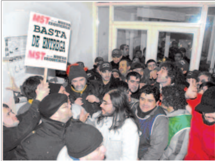
La movilización impide la sesión del endeudamiento.

La incertidumbre laboral en la zona norte petrolera es notoria y el rol de la burocracia sindical es directamente nefasto y criminal. Apuesta a una negociación con las operadoras que reclaman nuevas áreas de explotación a cambio de no despedir trabajadores. En este contexto, el gobernador Peralta convocó a una sesión extraordinaria de la legislatura para aprobar un endeudamiento de 2.000 millones