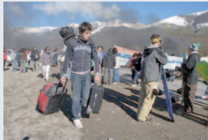
Piquete en el Cerro Catedral.

Por el lado obrero, uno de los grandes batallones que entró a la lucha salarial son los metalúrgicos con un fuerte paro nacional con movilizaciones el 27/7, luego de 15 años sin paro general. Y anuncian otro para el 30/7. Fue histórico también el parazo del 7/7 de los petroquímicos de Bahía Blanca con más de 1.000 obreros garantizando los piquetes en el Polo Petroquímico. Tam-