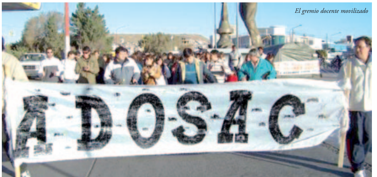
El gremio docente movilizado