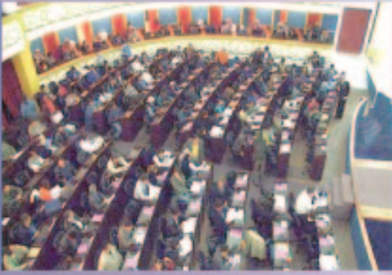
¿A dónde va el país? Por una Asamblea Constituyente (págs 4 y 5)