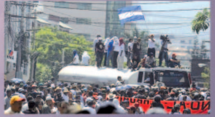
Honduras: ¡Abajo el golpe! (págs 12 y 13)

MST- Nueva Izquierda 29 de julio de 2009 / N° 503/ $2.-