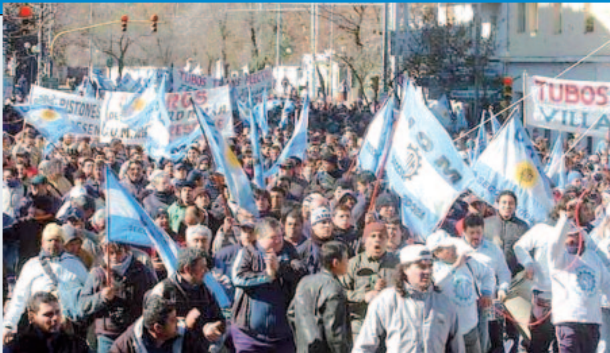
Mobilización de metalúrgicos.