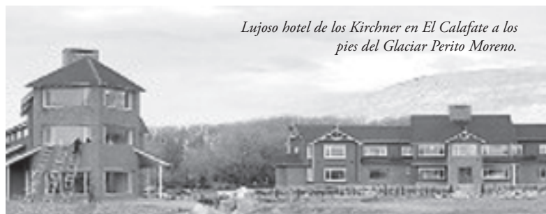
Lujoso hotel de los Kirchner en El Calafate a los pies del Glaciar Perito Moreno.