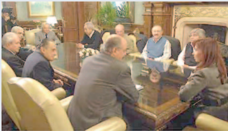
Consejo del salario.

Por salario hay conflicto en el Subte, de los petroleros o los portuarios de Bactssa. Mientras el 8/7 hubo un paro nacional del Sindicato Argentino de Televisión por el 25% con una movilización de más de 4.000 trabajadores. Por despidos hay conflictos en la impresora FP, la química Sealed Air de Quilmes, en Fargo, Edesur o el Correo. Mientras pelean por la fuente de trabajo en CIVE