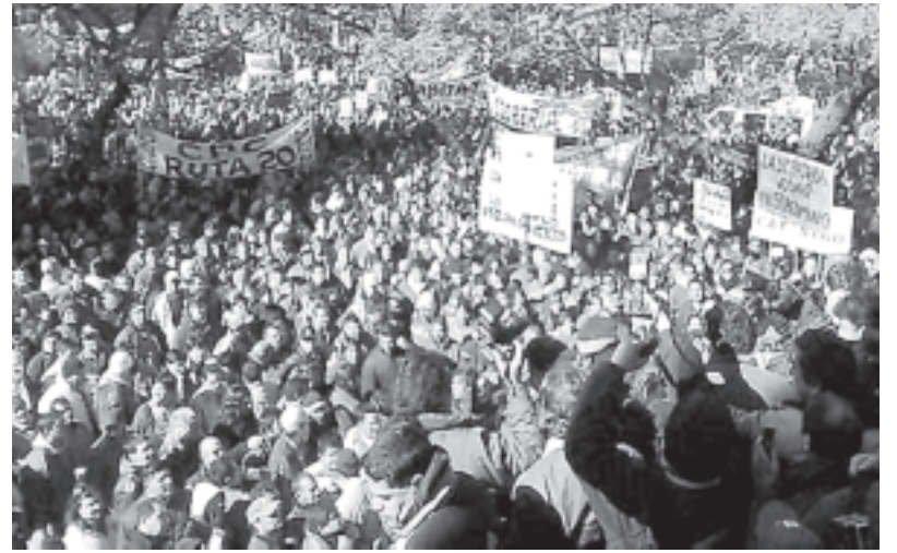
Movilización de municipales

El Frente Cívico de Juez, que ganó por poco, no para de tener dolores de cabeza. Tras el conflicto con los municipales, un nombramiento a dedo por parte de su líder terminó por partir nuevamente el bloque de concejales. Giacomino ya se fue con los K, ahora es el vice,