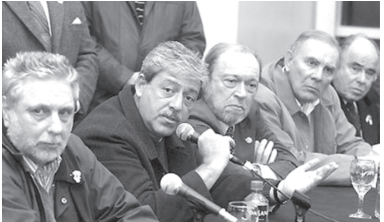
Dirigentes de la Mesa de Enlace

Consecuentes con su política, las entidades integraron dirigentes a las listas de partidos patronales como la UCR, el Acuerdo Cívico y Social y el PRO, que han vivido entregando al país y favoreciendo la explotación de los grandes capi-