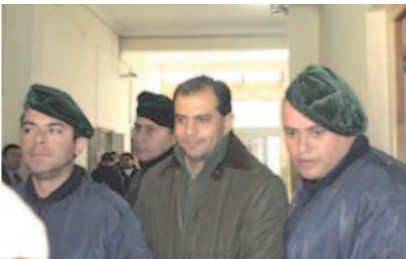
Alegre a la cárcel

No reconozcamos al nuevo intendente ni a estos concejales sospechados de complicidad con Alegre y su banda. ¡Que se vayan todos! Exijamos que se convoque a una Asamblea Constituyente, para que todo el pueblo de Santiago discuta y decida democráticamente, como cambiar este modelo político que está asociado al robo, la corrupción y la estafa.