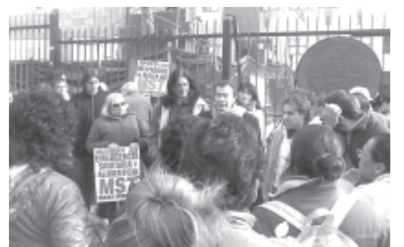
Quilmes, 28/7: acto ante el municipio por la gripe A, la emergencia sanitaria, entrega de alimentos y desinfección de escuelas. Entre otros, participaron Suteba, CTA, Fetera, MST y CCC.

pelea contra los grandes laboratorios privados y sus patentes, es el único camino para que el remedio deje de ser una mercancía y pase a ser un bien social y accesible para todos. No impulsar a fondo la fabricación estatal es ser funcional a quienes hacen de la salud un negocio."