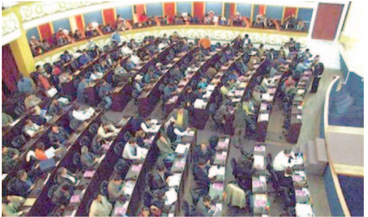
Una sesión de la Asamblea Constituyente en Bolivia

En cuanto al modelo político, hace rato que hay rechazo popular a las Fuerzas Armadas y de Seguridad, y descreimiento hacia el viejo bipartidismo PJ-UCR. Pero además de los viejos partidos, el estallido de diciembre de 2001 cuestionó las instituciones del régimen "democrático" actual: la presidencia, el Congreso y la Justicia. Desde entonces, todos hablan de reforma política. A su vez, en la Argentina también fracasó el modelo de economía capitalista, basado en