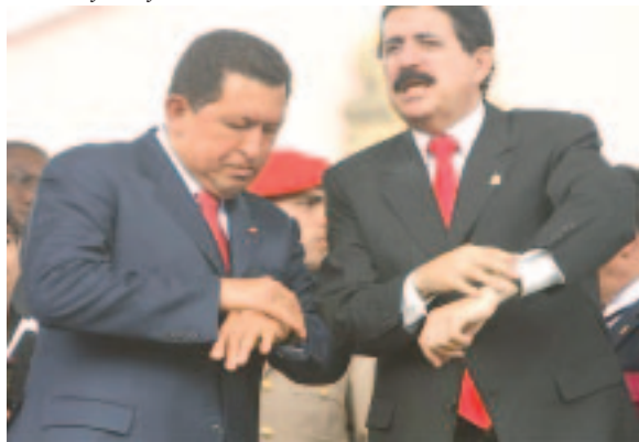
Chávez y Zelaya.

Señaló además, «que los recientes hechos también demuestra otra vez la necesidad de tomar medidas contra los medios de comunicaciones y sectores opositores que aplauden lo ocurrido en Honduras, tratando de usar su poder mediático para buscar las posibilidades de repetir los hechos aquí”.