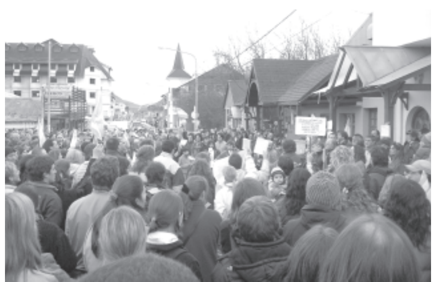
Movilización en Tierra del Fuego

Mirá, la situación es dura. Imaginate lo que significa acampar con temperaturas bajo cero en la Patagonia. Pero, no damos un paso atrás. Hay un operativo de prensa destinado a desprestigiar nuestro reclamo, pero acá hay sangre joven y decidida a ir hasta el final.