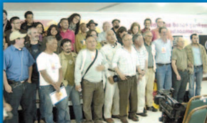
Brasil: Exitoso Seminario Internacional Págs. 12 y 13