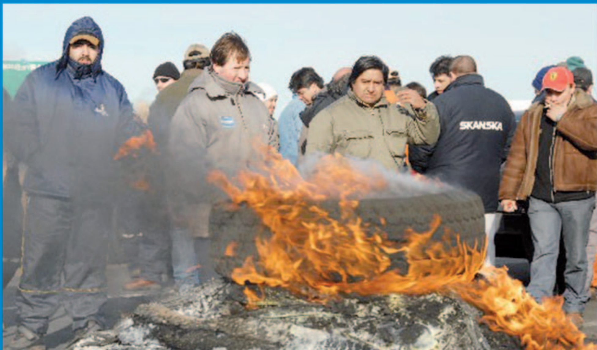
Corte de ruta petroleros de Santa Cruz