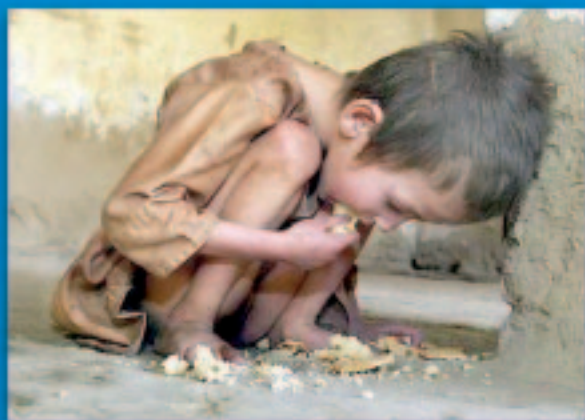
¿Cristina contra la pobreza? : Otro verso K Págs. 4 y 5