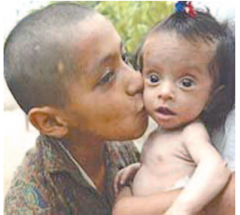
Chicos desnutridos en el Chaco

En segundo lugar, lo gastó en subsidios a las ramas que no da-