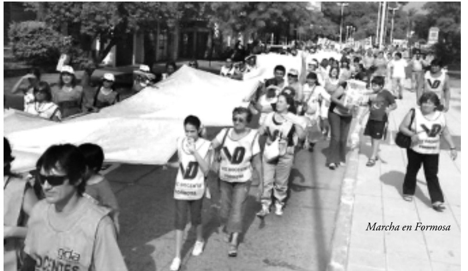
Marcha en Formosa

El alineamiento Celeste con el gobierno del PJ y la experiencia con los demás gobiernos del sistema va llevando a que la izquierda y los sectores más democráticos y combativos ganen terreno