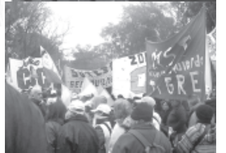
21/8 acto en la puerta de Terrabusi

Esta vez pasaron 6 días y el Sindicato de la Alimentación no llamó al paro general. No puede volver a pasar. Hay que exigirle al STIA que ante cualquier nuevo ataque a los trabajadores, se llame a un paro de todas las fábricas del sector. Tampoco se puede confiar en el Ministerio de Trabajo, que esta vez dictó la conciliación,