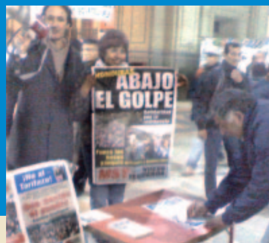
Campaña del MST en Constitución

Con huelgas, marchas, cortes de ruta y toda clase de acciones contra Micheletti y las autoridades de facto, el pueblo hondureño sigue enfrentando heroicamente el golpe de Estado. Ni la represión ni las violaciones a los derechos humanos lograron derrotar a los trabajadores y el pueblo.