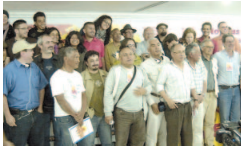
Representantes de las distintas delegaciones internacionales en el Seminario.

cionarios de Venezuela, Bolivia y Ecuador tienen en esta etapa. Por un lado porque son procesos vivos y dinámicos que siguen en curso y, a la vez, porque hay una evidente política imperialista y de las grandes burguesías por derrotarlos. El evento, permitió debatir algunas de las distintas experiencias que se viven en esos países, sus puntos de avances que es necesario profundizar y también sus contradicciones internas, a las cuales los socialistas tenemos que darle respuestas.