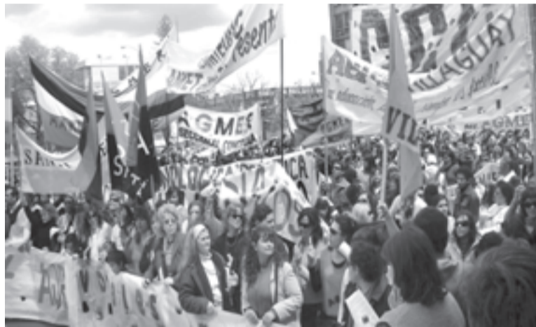
30/9: Masiva marcha de AGMER y la Intersindical entrerriana

Hasta un gremio moyanista como Udocba llama a otro paro el 16. Ante la parálisis cómplice del FGD, el paro anterior fue tomado en muchas escuelas para canalizar la necesidad de luchar. Este nuevo paro no busca un verdadero plan de lucha, ya que dividen fuerzas con ATE y CICOP. Será otro paro "dominguero" y, como en el anterior, no llaman al resto de los sindicatos a coordinar para derrotar al gobierno.