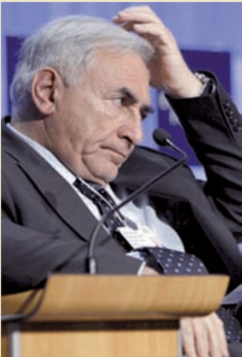
Dominique Strauss Khan, director del FMI

No hay medias tintas. Para acabar con este círculo vicioso hay que romper definitivamente con todos ellos, no sólo no pagarles un peso más de la deuda inventada, sino salirnos como miembros, de manera que nunca más estemos sometidos a sus designios. Esto es lo que no hacen los Kirchner por más dobles discursos que inventen, pueden aparecer como enfrentados durante un tiempo, pero siguen pagando y cuando las cosas se complican vuelven a caer en sus redes de usura y saqueo.