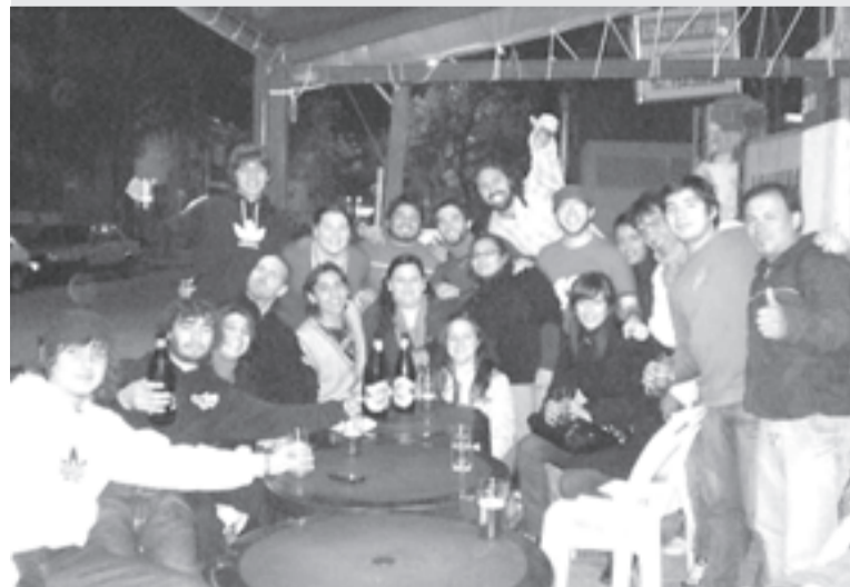
Festejo de Estudiantes x el Cambio, luego de haber ganado las elecciones en el Instituto Almirante Brown de Santa Fe.