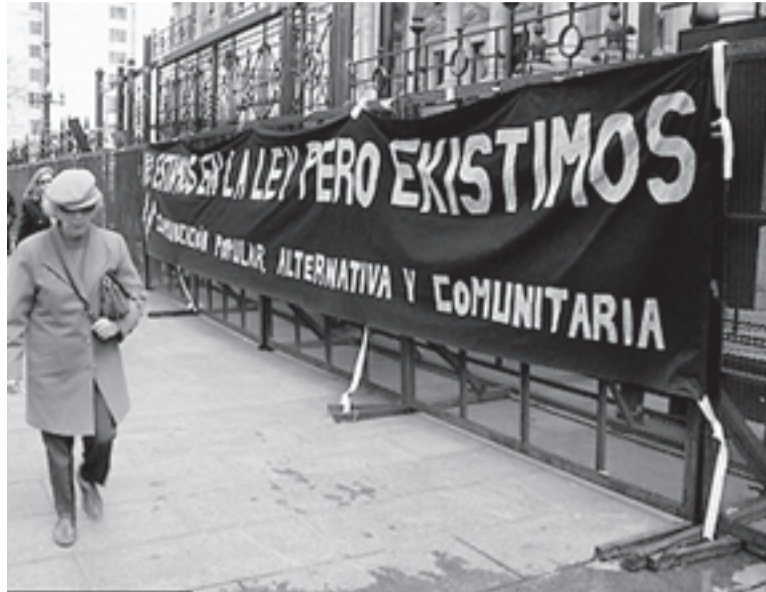
Protesta de la Red Nacional de Medios Alternativos.

En el Consejo Federal de Comunicación Audiovisual, sobre un total de 38 miembros, los gremios del sector tendrán sólo 3. Es una proporción totalmente minoritaria, decorativa, en un