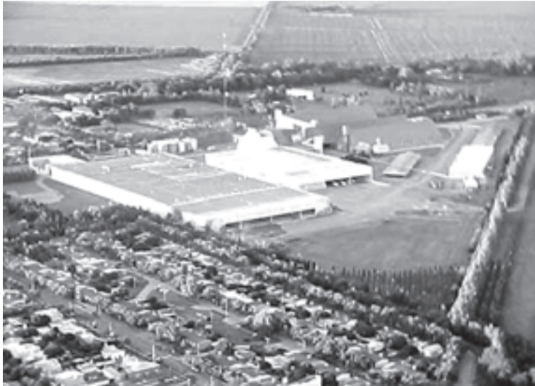
Aceitera General Deheza

Además, el gobierno nacional le está financiando al NCA dos importantes obras ferroviarias en