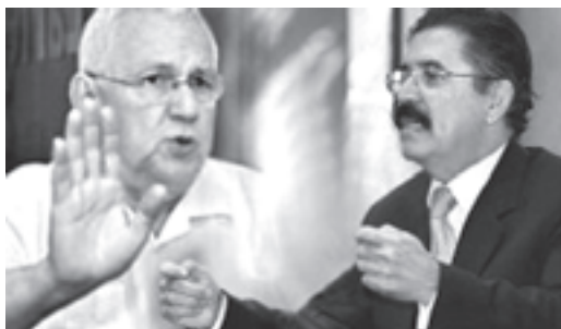
Zelaya está abandonando a la Resistencia. Hay que seguir sin él.

Finalmente, termina firmando un principio de acuerdo entre las partes, para que sea el Congreso el que decida la restitución de Zelaya en el gobierno, hasta el final de su mandato, el 10 de enero de 2010.