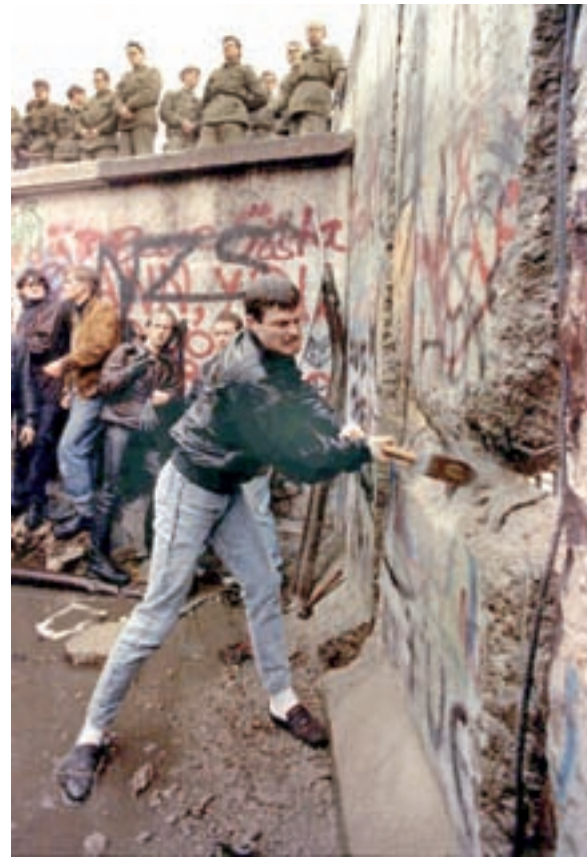
Mazazos al Muro.

Sin embargo, ver lo positivo no implica dejar de ver las contradicciones. El enorme triunfo de aplastar a los regímenes dictatoriales con máscara socialista no derivó en el fortalecimiento de nuevas direcciones revolucionarias reconocidas a nivel mundial.