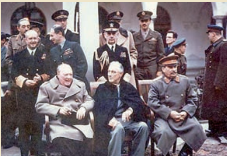
Churchill, Roosevelt y Stalin en Yalta.

Por falta de una dirección revolucionaria, el fenómeno se dio con una enorme contradicción: la RDA fue fagocitada por la RFA capitalista. Lo cual marca a fuego la necesidad de construir partidos revolucionarios a nivel mundial para que la movilización de las masas no sea canalizada hacia una salida capitalista.