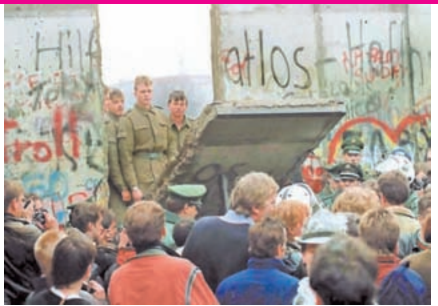
Caen los primeros bloques.

China y los nuevos emergentes regionales no alcanzan para una recuperación sostenida. Los llamados BRIC (Brasil, Rusia, India, China) han ganado cierto peso, pero no pueden ser el motor de una recuperación por sus propias limitaciones y por los efectos que la crisis mundial causa en sus economías. China está atada por razones comerciales y financieras a