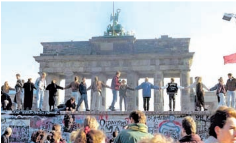
Festejos en la Puerta de Brandeburgo.

A 20 años de la caída del Muro de Berlín, ahora vuelven a soplar vientos de cambio. Los ladrillos que se caen son los del Muro del capitalismo.