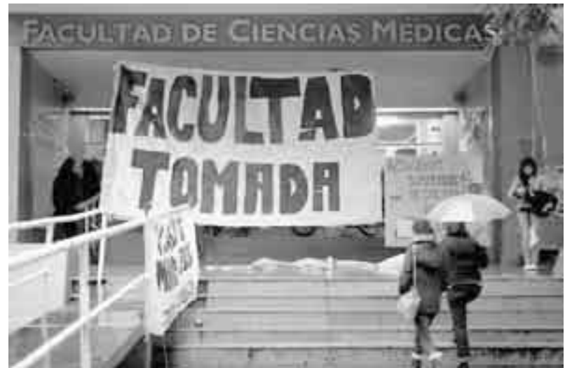
La facultad estuvo inactiva durante más de dos semanas