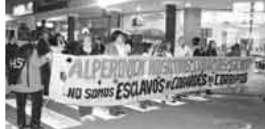
La salud dijo basta

El 11 de junio, se realizó la asamblea de constitución del nuevo Sindicato de Trabajadores Autoconvocados de la Salud, SITAS, que nuclea a trabajadores