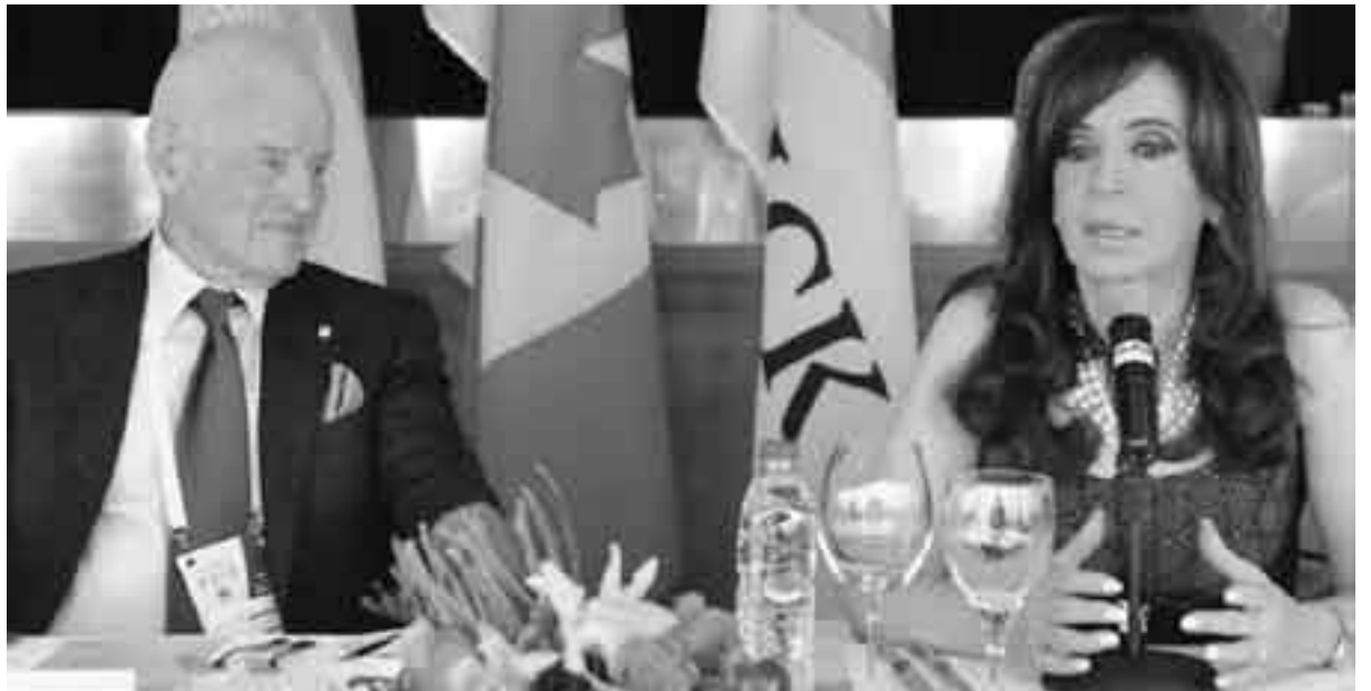
El magnate Peter Munk y Cristina Kirchner, en el Westin Harbour Castle Hotel, de Toronto. Atrás, en pie de igualdad, las banderas de Argentina, Canadá y la Barrick...

Ahora, en Diputados se aprobó por unanimidad una ley de regulación petrolera en Malvinas. Pero más