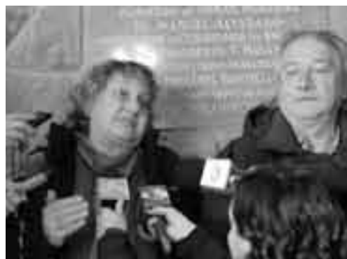
Conferencia de prensa en Bariloche