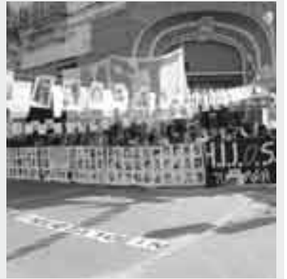
Movilización ante los juicios en Tucumán