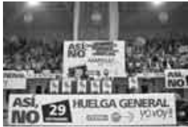
29-J. Huelga general en el País Vasco

Posteriormente la empresa se sentó a negociar y, cuando escribimos estas líneas, están proponiendo un recorte salarial del 1,5%, mientras que los trabajadores se están reuniendo para decidir si continúan las movilizaciones. Es una protesta muy importante, tanto por su repercusión social como por lo que puede significar para otras empresas y sectores y para la huelga general del 29-S.