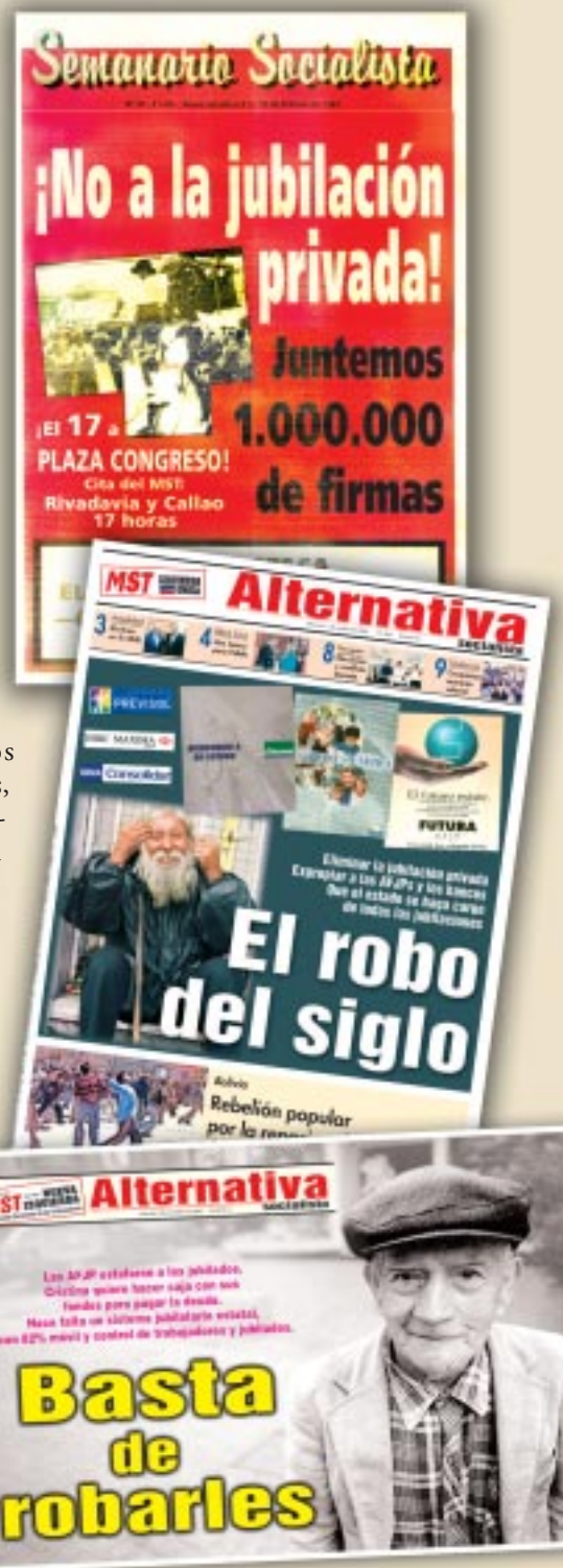
Facsímiles de las tapas de Semana Socialista N° 37 y Alternativa Socialista N° 360 y N° 487.

Con Vilma Ripoll, nuestro diputado Marcelo Parrilli y todo el MST, hoy seguimos estando orgullosamente junto a los reclamos por los derechos de los jubilados y pensionados, repartiendo miles de volantes y poniendo nuestro partido al servicio de su lucha, que es la lucha de todos los trabajadores de nuestro país.