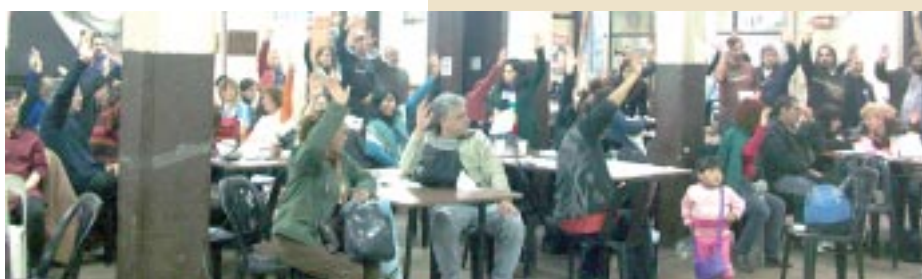
Resolviendo entre todos.