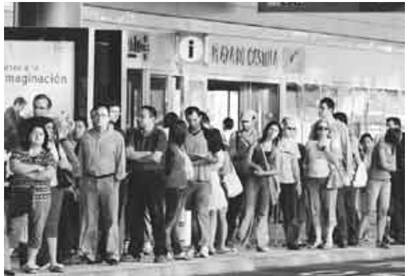
Huelga de subte en España

La preparación de la huelga general está tensando todas las fuerzas, pero muestra también las dificultades para convertir ese esfuerzo en una alternativa política. Las fuerzas situadas a la izquierda del PSOE son débiles y están divididas. Las actuales movilizaciones, además de echar atrás las medidas antipopulares, deberían servir para la confluencia y el reforzamiento de las fuerzas políticas que ponen por delante que la crisis la deben pagar los capitalistas y no la clase trabajadora.