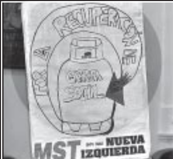
El MST reclama por la garrafa social. Foto de una pancarta colocada en una sesión del Consejo Deliberante.