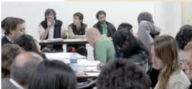
Mesa del Encuentro.