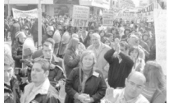
Autoconvocados de Tucumán.

Y como si esto fuera poco, el Ministro de Salud de la Nación, el Dr. Manzur, (vicegobernador de Tucumán en uso de licencia), en su declaración de bienes, tiene un