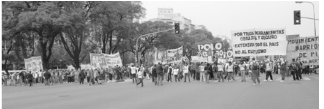
La movilización unitaria en la Avenida 9 de Julio.

Fue un gran triunfo de la movilización y de la unidad alcanzada entre los movimientos que integramos el espacio más importante de las organizaciones no oficialistas con un gran poder