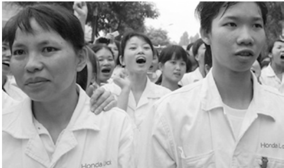
Trabajadoras de Honda en plena movilización.

China está lejos de convertirse en primera potencia mundial superando a los EE.UU. y de ser el salvador de la profunda crisis sistémica del capitalismo. Es más, la continuidad de la crisis económica mundial no hace más que agudizar las contradicciones