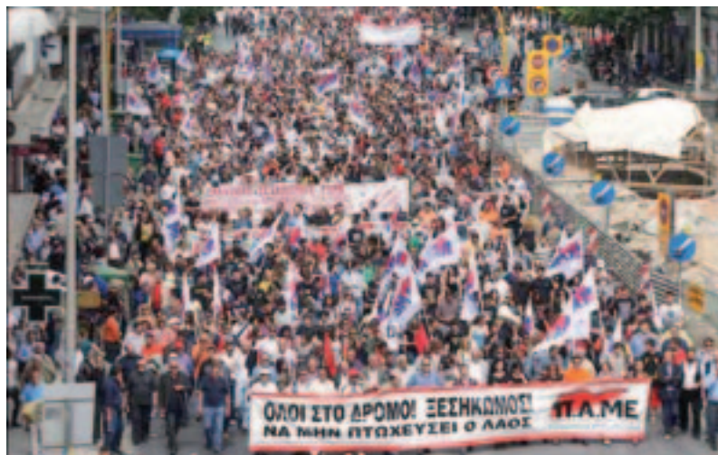
Ante la crisis capitalista se movilizan los trabajadores griegos y europeos.

Se es revolucionario si uno pelea por el poder al servicio de cambiar la sociedad, de liberar a la sociedad del capitalismo, de la opresión y no en beneficio de la propia ubicación personal. Esto también significa con absoluta vigencia, ser trotskista hoy.