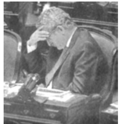
El Frente Para la Victoria está preocupado...

Los fondos tienen que recaudarse y administrarse en organis-