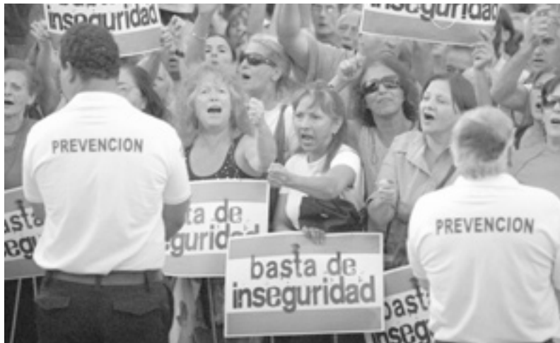
Marcha por seguridad.

Mientras desde el gobierno no se cambie de raíz esta matriz de desigualdad y exclusión social, con medidas de emergencia y de fondo, la base estructural que origina la inseguridad seguirá intacta. Por eso todas las políticas de "mano dura", "tolerancia cero", aumento de las penas o baja de la edad de imputabilidad, como las leyes Blumberg, han fracasado.