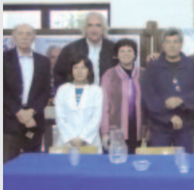
Campaña de la Lista 1 y 6 en Tucumán. En conjunto a Autoconvocados de la Salud.