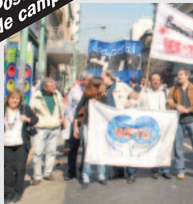
Acto de la CTA Capital en apoyo a los trabajadores.