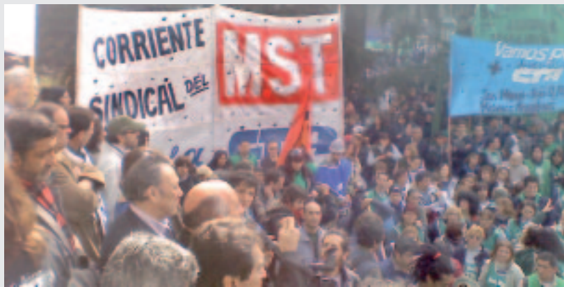
El MST participó en las movilizaciones de Capital y La Plata en la jornada de la CTA del 26/8.