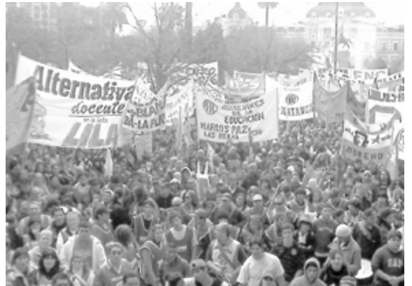
Alternativa Docente y la Lila durante la jornada del 26/8 en La Plata.

La Lila logra una muy importante votación y se ratifica como la única opción nacional, a pesar del fraude. Debiendo enfrentar aparatos