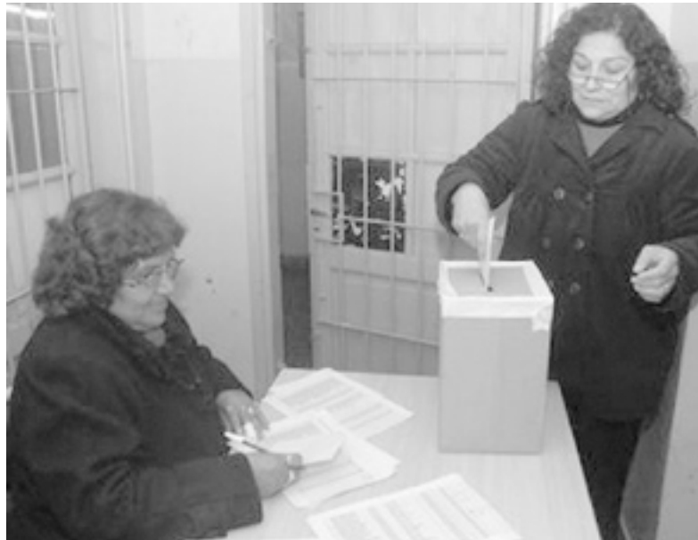
Baja participación. En ATECA Capital, de 390 docentes sólo votaron 20.

permiten mostrar que la Celeste fraguó su resultado, agregándose 25.000 votos más. El mayor fraude lo arman en SUTEBA cuando la Junta se negó a que hubiera escrutinio provincial. Cargando en soledad, sin la oposición, los datos que quisieron. También se suspendió el escrutinio en CTERA, limitándose a entregar planillas con datos cargados por ellos.