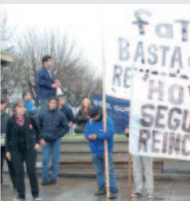
Los candidatos de la Lista 1 apoyando la lucha.