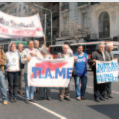
trabajadores y el pueblo de Grecia.

oyano, el aparato clientelar de los Kirchner, sus intendentes y gobernadores Lista 1. Una amplia y nueva articulación entre la Agrupación Germán de los gremios de la CTA. Si gana la lista 1 estaremos más fuertes para por una nueva dirección y un nuevo modelo de central independiente, haciendo el compromiso de poner esos cargos al servicio de la lucha.