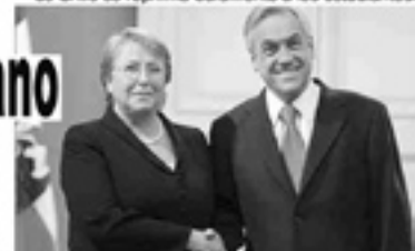
El día anterior Bachelet visitó a Piñera en el momento en que en las calles y al interior de la U de Chile se reprimía duramente a los estudiantes.

La entereza de los mineros que han resistido bajo tierra en total incertidumbre al principio y en agónica espera hoy, la de sus familiares que montaron campamento para presionar a las autoridades en su búsqueda, más la disposición de los pirquineros de arriesgar su vida, si era necesario, en la búsqueda de sus compañeros, son ejemplos que demuestran que cuando los trabajadores lo siguen lo consiguen.