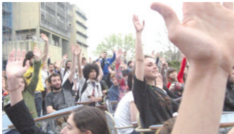
Con asambleas y movilizaciones, Periodismo se plantó contra la burocracia K

Ante la proximidad de las elecciones, y como herramienta que