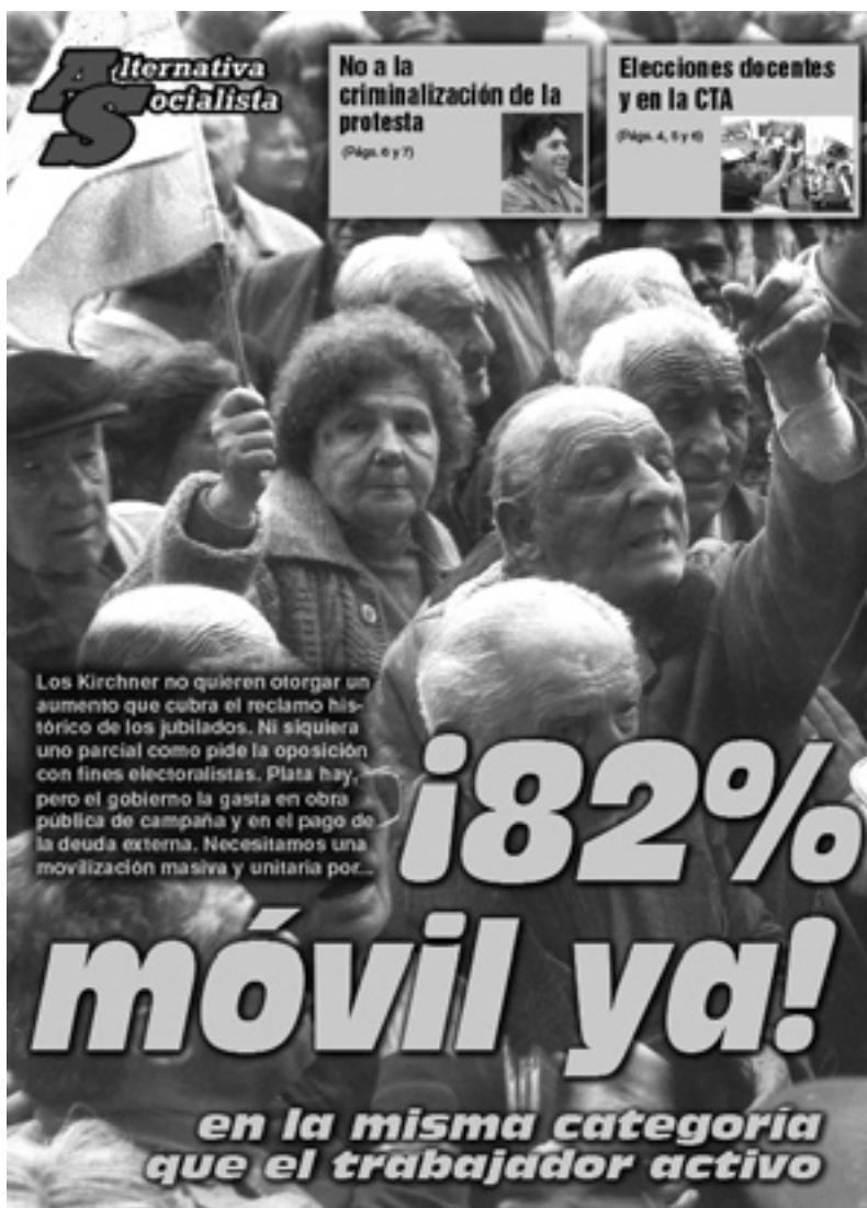
Tapa de Alternativa Socialista N° 526.

La oposición patronal encabezada por la UCR pretendió utilizar el proyecto del 82% para horadar electoralmente al gobierno. Se jugó a forzar el veto de