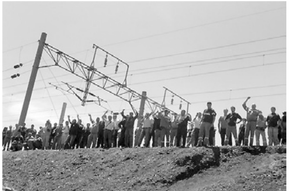
La patota en acción sobre las vías.

pero jamás un disparo". Causa indignación tanto cinismo.