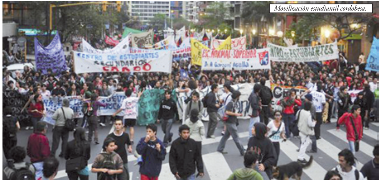
Movilización estudiantil cordobesa.