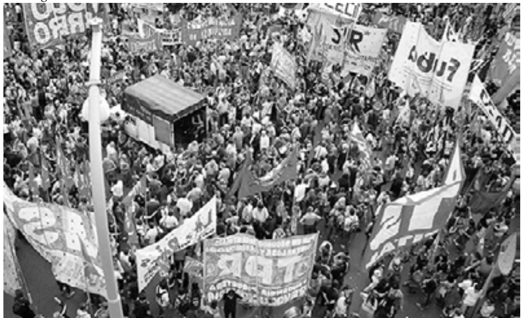
La respuesta unitaria fue contundente.