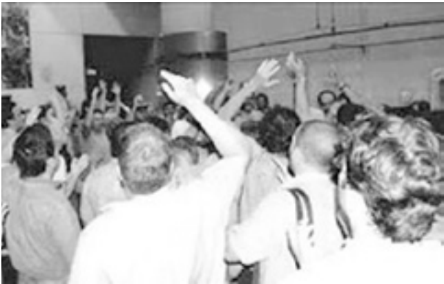
Asamblea en el subte.

y preocupación al percibir que su imperio está corroído. Sienten que se les mueve el piso. Que aunque sigan atornillados a los sillones y usufructuando el aparato, la bronca por abajo y su divorcio de la base es cada vez mayor. Y porque nuevos dirigentes le ganan terreno en muchos lugares Moyano, los Gordos, Yasky y todas las vertientes de la burocracia buscan permanentemente un frente único con el gobierno y las patronales; quieren cerrar filas para intentar frenar el proceso de surgimiento de una nueva dirección por la base