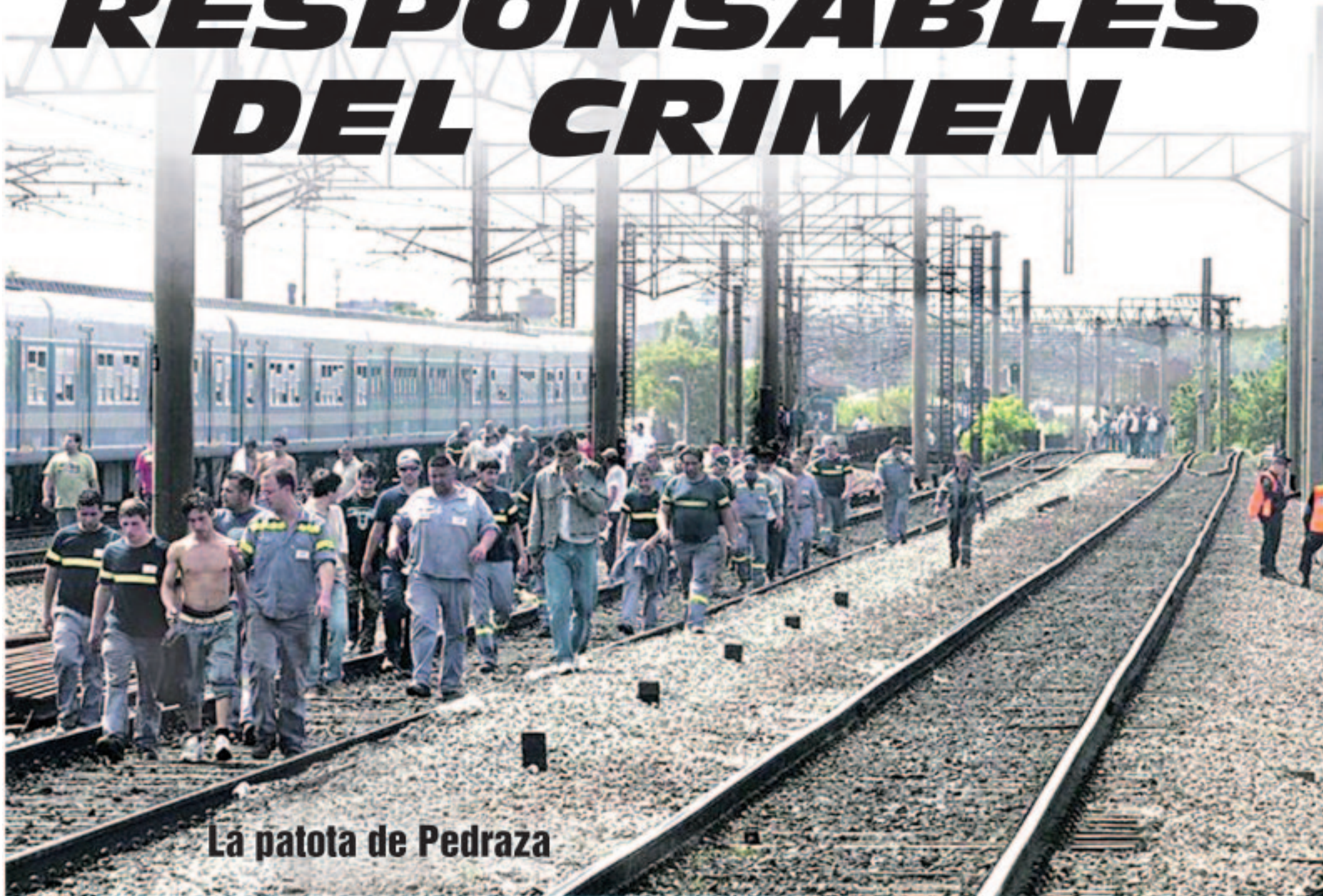
La patota de Pedraza