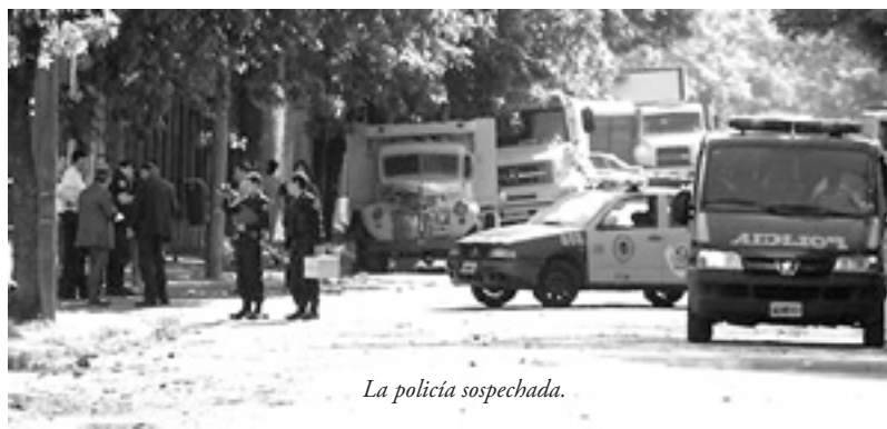
La policía sospechada.