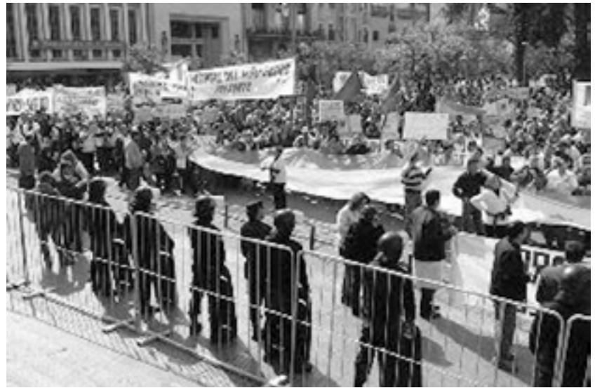
Autoconvocados de Tucumán.

Se fue imponiendo un modelo de estatización que liquidó la autonomía, de verticalismo que liquidó la democracia y las asambleas y de pensamiento único que impuso conducciones de un sólo color político. Se sancionaron leyes para regimentar de esa manera la vida sindical y estatutos proscriptivos para evitar que la base se exprese. Para garan-