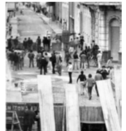
Barricadas en el segundo Tucumanazo.

y energía rebelde de las masas movilizadas. Luchas hubo y las seguirá habiendo. El desafío hoy en condiciones de mucha mayor