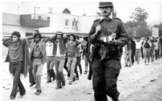
Detenidos en el segundo Tucumanazo.

Mayo Francés. Primavera de Praga. Cordobazo. Rosariazo. Vietnam. Crisis del estalinismo. Caída del Onganiato. Estos hitos que enumeramos, señalan otros tantos procesos de lucha de clases que constituyen el marco, el telón de fondo de la rebelión tucumana.