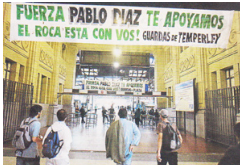
Los burócratas defienden al organizador de la patota.