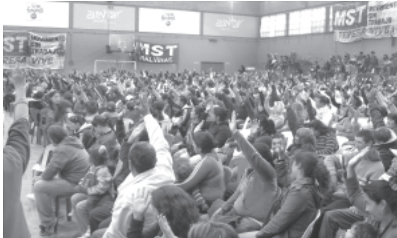
Los compañeros del TV votando resoluciones en el estadio repleto.

Otra comisión muy concurrida fue la de Argentina Trabaja y Teresa Vive. Allí me tocó debatir con los compañeros como seguimos la pelea por trabajo genuino. El Argentina Trabaja fue una gran con-