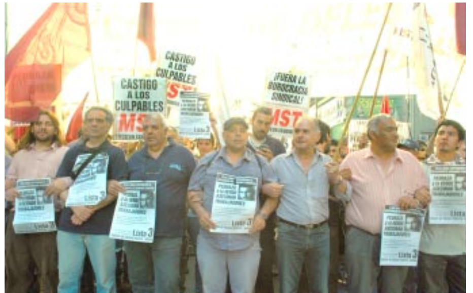
Cabecera de la columna ferroviaria, en la marcha por Mariano Ferreyra.

Ganamos por 27 votos. Una elección súper reñida. El balance es muy positivo. Las elecciones anteriores las habíamos ganado por 30 votos y en este último pe-