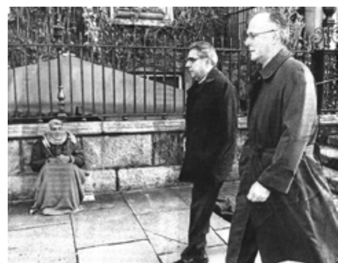
El equipo del FMI que negocia el rescate de Irlanda pasa al lado de un "homeless"

· Reunión del G20 y la guerra de monedas - Gerardo Uceda