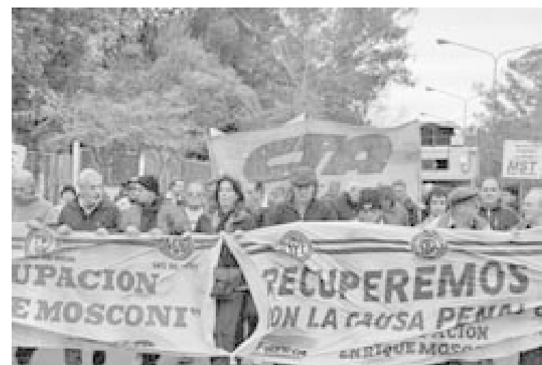
Marcha Agrupación Mosconi

En diciembre de 2006, luego de un viaje del Presidente Kirchner a España, acompañado por los titulares de Telefónica y Edenor, donde se entrevista con el presidente de REPSOL, el juez Bonadío declara el sobreseimiento de todos los imputados.