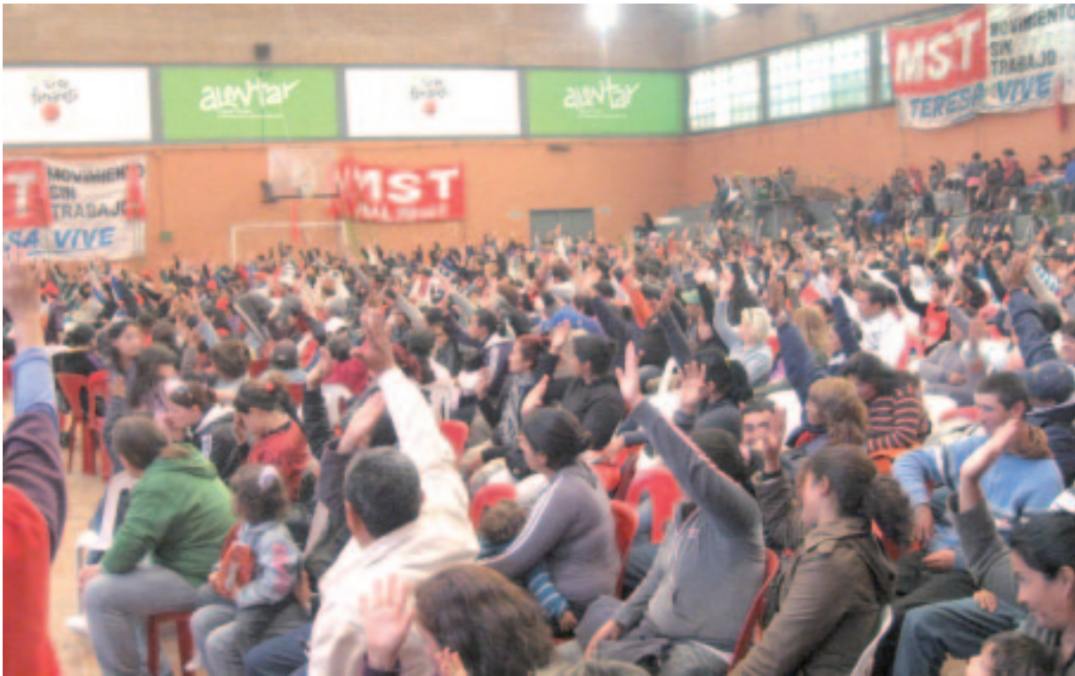
Momento de la votación de las resoluciones.

El pasado 30 de octubre cerca de 2.000 compañeros realizamos en el Estadio Gatica de Avellaneda el Encuentro 2010 del Movimiento Sin Trabajo "Teresa Vive". A continuación reproducimos un extracto de sus principales resoluciones: