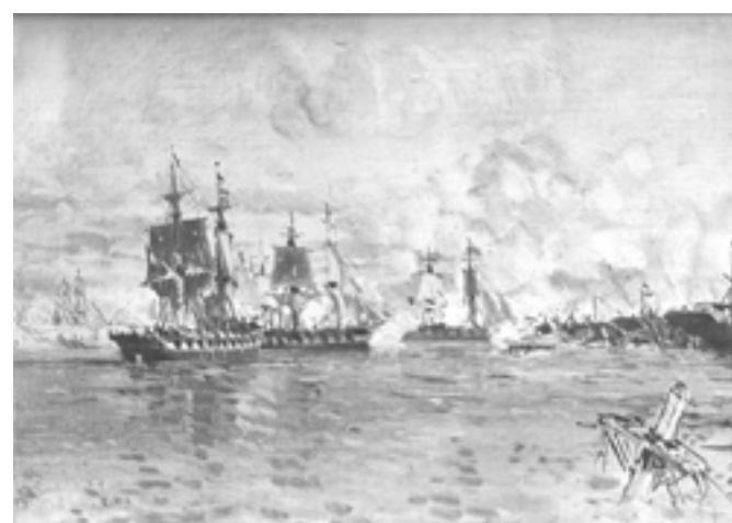
Batalla de la Vuelta de Obligado.

en Puerto San Martín para recordar la gesta de los soldados de la Confederación y denunciar los ataques a la soberanía que hoy se han multiplicado contra nuestro país. Militantes de la CTA, AMSAFE, Proyecto Sur, la CCC y diversas organizaciones nucleadas en la multisectorial por la soberanía expresamos nuestra disconformidad con esta situación y volvimos a demostrar con hechos que los únicos garantes de la soberanía nacional somos los trabajadores y