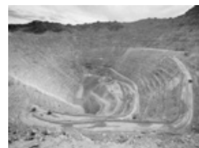
Megaminería a cielo abierto.

Creemos que la única solución posible es la PROHIBICIÓN. El método de lixiviación con cianuro es una práctica prohibida en el primer mundo por sus efectos nocivos. Las empresas y los gobiernos lo saben, pero a pesar de que intentaron ocultarlo