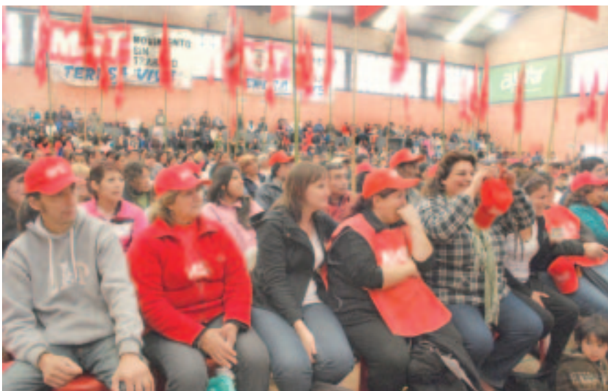
El estadio Gatica se llenó de compañeros.