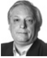
Marcelo Parrilli, Diputado de la Ciudad