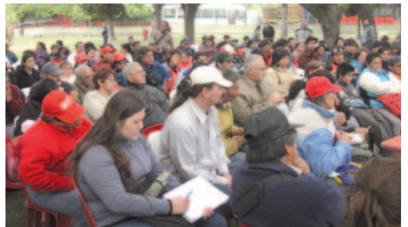
Reunión de una de las comisiones del Encuentro.

defensa de una Salud Pública y luchar por los derechos de la mujer trabajadora, por guarderías y por un programa masivo de educación sexual y prácticas de anti concepción. Por una ley que despenalice el aborto, reivindicando el derecho democrático de cada mujer a decidir sobre su propio cuerpo.