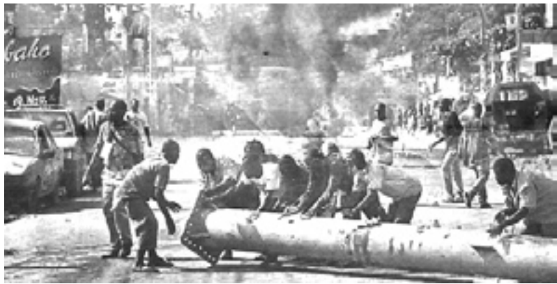
Barricada en un barrio de Puerto Príncipe, contra la misión de la ONU.

El terremoto sufrido por Haití en enero de este año dejó como dramático saldo 300 mil fallecidos, el 40 % de la infraestructura edilicia destruida en Puerto Príncipe, 50 hospitales y alrededor de 1.350 escuelas. Hasta hoy se limpió apenas un 2 % de los 25 millones de metros cúbicos de escombros y desechos. Un verdadero desastre. Cerca de 1,8 millones de víctimas se quedaron sin hogar y están vi-