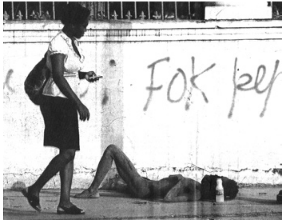
Una mujer pasa junto a un hombre inconsciente en una calle de Puerto Príncipe, donde se agrava la epidemia de cólera.

El desastre en Haití y la crisis en Irlanda son manifestaciones nacionales de un proceso único que recorre el planeta: la más profunda y extendida crisis del sistema capitalista del último siglo. El estallido en 2008 en el corazón del imperio yanqui y sus capítulos griego, español, francés, etc. son la expresión de un sistema que vive una crisis de carácter integral, combinado e histórico.