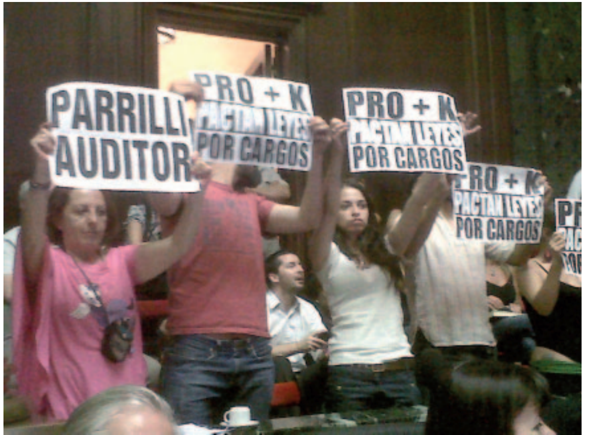
En la última sesión, compañeros del MST protestaron desde las gradas.