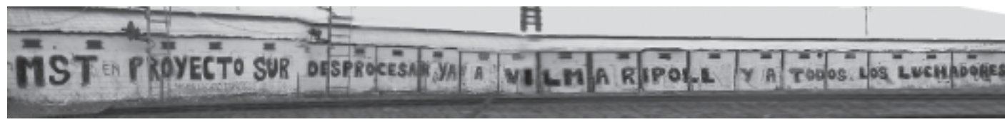
Pintada en las vías del FC Belgrano Norte.