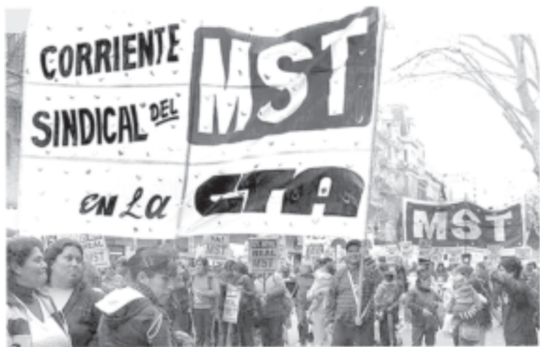
El 2011 se inició una nueva etapa en la construcción de la CTA. Nuestra corriente sindical se fortaleció en todo el país aportando al desarrollo de la central, a sus debates e iniciativas. Y encaró el 2012 con el desafío de impulsar las regionales, en la disputa por el gremio docente y al servicio de una nueva dirección en el movimiento obrero.

Ya se pronuncia lo que vendrá como los luchadores jóvenes