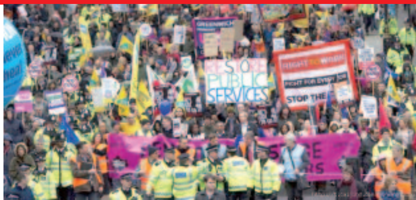
Gran Bretaña: masiva huelga general de los trabajadores estatales.

que también concurrieron y se expresaron. Pero lo esencial es que el seminario demostró la necesidad imperiosa de encontrarnos, de socializar, de debatir diversas posturas, de aprender y tratar de comprender el tiempo que viene. Y lógicamente, la necesidad de votar resoluciones que ayuden a los procesos en curso (ver pág. 14, abajo).