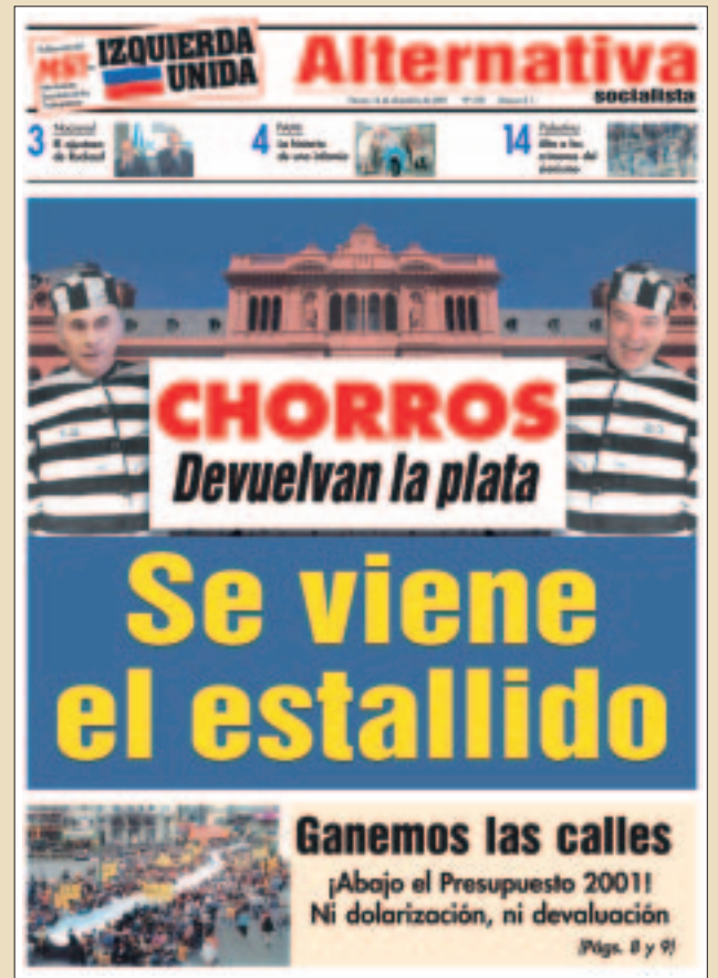
Tapa de nuestro periódico del 14 de diciembre de 2001.

“Lo principal era encontrar una propuesta de gobierno concreta para el pueblo trabajador y un programa alternativo para salir de la crisis, como el no pago de la deuda y la reestatización de las privatizadas. Al no existir nuevos -y superiores- organismos democráticos del movimiento de masas y ante la traición de las direcciones sindicales, había que utilizar lo existente. Y la institución que estaba por decidir era la Asamblea Legislativa. Más allá de la ilegitimidad de ese engendro, presentaba la oportunidad de hacer una propuesta que fuera vista y entendida por millones. Frente a que el PJ era más de lo mismo que la UCR, nuestro planteo arrancaba de que gobernara un diputado de izquierda con un gabinete de trabajadores. Ya después lo precisamos más y planteamos la fórmula Zamora-Walsh (ambos diputados de izquierda) para gobernar. Mantuvimos la propuesta de plan económico alternativo y dimos mucha importancia a una consigna democrática: Asamblea Constituyente Libre y Soberana para que el pueblo decida todo... Nuestra propuesta logró instalarse y ganar simpatía entre un sector del pueblo. Tanto fue el efecto... que el día de la asunción de Duhalde una patota del PJ intentó atacar a una columna de la izquierda pero fueron contundentemente rechazados...”