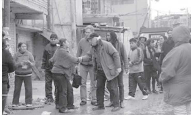
Con los vecinos de la Villa 31.