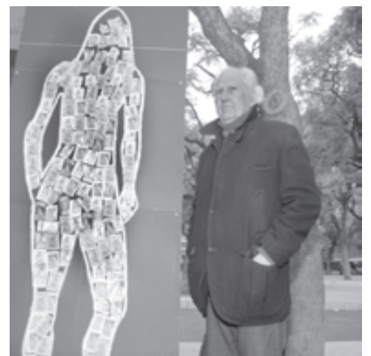
En Plaza Once, contra la trata.