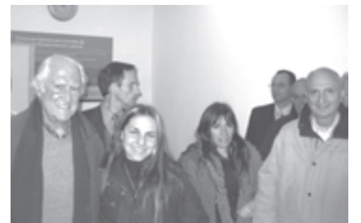
En la Subsecretaría de Trabajo porteña.