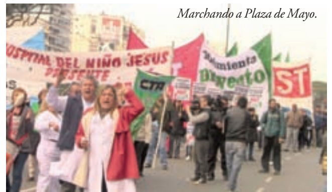
Marchando a Plaza de Mayo.

carpa y en una audiencia en el Senado. Reclaman la apertura de la paritaria, la modificación de la carrera sanitaria que tiene más de 20 años, el 82% móvil, la insalubridad y la finalización de toda forma de precarización laboral. Reflejamos las voces de varios de los protagonistas de la Jornada.