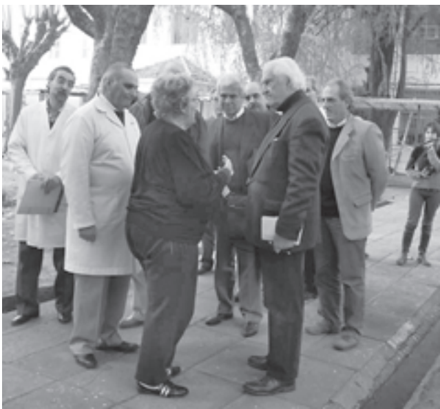
Visitando el Hospital Roca.