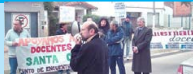
Caravana en la zona Norte del Gran Bs As.

cobar, con la sede del Consejo Escolar de Malvinas y la rotonda frente al mástil de San Isidro. En cada una de las paradas, hicimos un acto en apoyo a los docentes santacruceños y juntamos dinero para la Fondo de Huelga. La actividad fue reflejada con un extenso reportaje en el Canal Telerec de Gral. Sar-