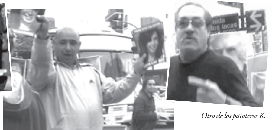
Otro de los patoteros K.