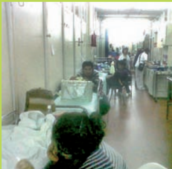
En la guardia del Hospital Garrahan hay entre 12 y 15 niños internados en camillas en los pasillos y otros 40 en diversas áreas de emergencia, inclusive en la sala de inducción de quirófano. Por eso los trabajadores de ATE hacen un paro el jueves 23, también por reclamo salarial.

En la Ciudad hay tres candidatos, pero en esencia dos modelos. Aunque no tiene candidato presidencial propio, ya vimos que Macri prioriza los grandes negocios privados en desmedro de todo lo público. Su gobierno paga sobrepagos y terceriza a granel. No es tan distinto de Cristina. Ella sigue con su doble discurso, pero mantiene los principales recursos del país entregados a las corporaciones y, como lo estamos viendo, con enormes dosis de corrupción. Macri de un lado y Cristina con Filmus del otro difieren en el estilo, desde ya, pero de fondo