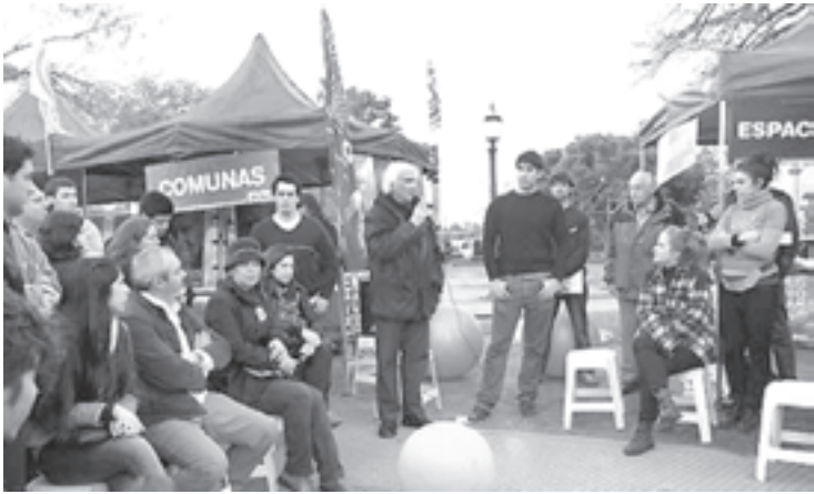
Cabildo Abierto en Plaza Francia.

En la recta final hacia la elección del 10 de julio en la Ciudad de Buenos Aires, Pino Solanas y toda la militancia de Proyecto Sur redobla el esfuerzo para ganar voluntades y votos.