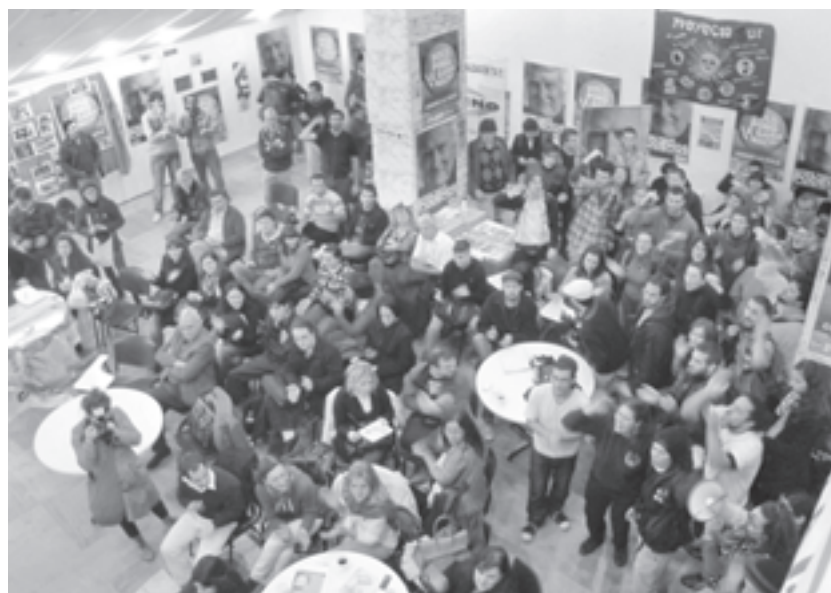
Charla en el Instituto Joaquín V. González.