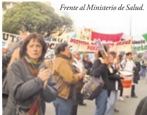
Frente al Ministerio de Salud.