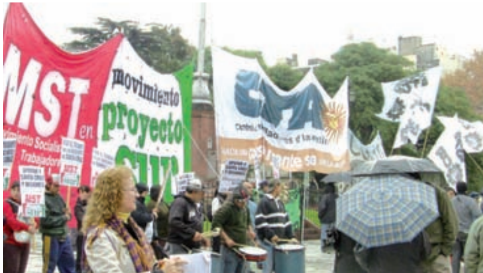
La CTA, Alternativa Docente en la Lila nacional, la Azul y Blanca y otros sectores nos movilizamos el 15/6 al Ministerio de Educación en solidaridad con Santa Cruz.

El congreso de ADOSAC votó seguir el paro, el viaje de una fuerte delegación a Bs. Aires y nuevo congreso el fin de semana. Estas