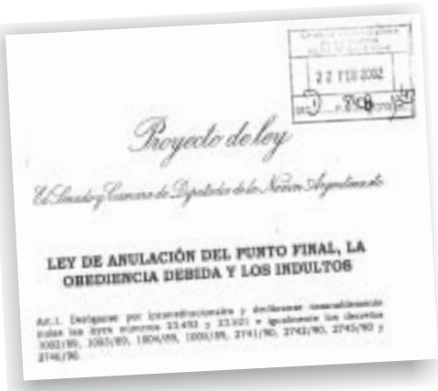
Carátula del proyecto de anulación de las leyes aberrantes

reventar Plaza de Mayo con un acto unitario. Porque donde vayan los iremos a buscar, para llevarlos a la cárcel de por vida.