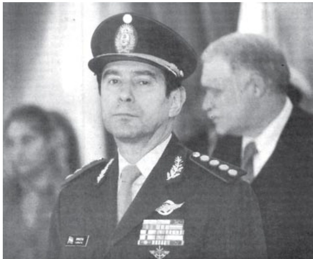
El gral. Brinzoni se reúne con banqueros, pero no tiene ningún apoyo popular

Como el debate para nosotros es serio, -mas allá de los malintencionados o escépticos-, compartimos que todavía las asambleas vecinales, las organizaciones piqueteras, de trabajadores combativos y partidos de izquier-