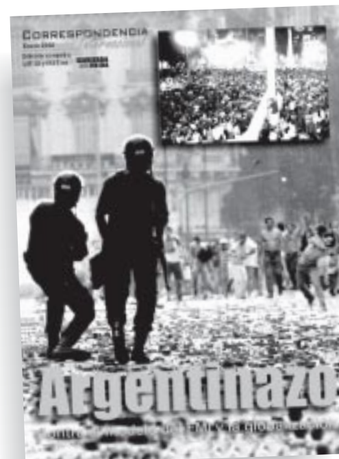
Está a la venta la edición especial conjunta de Correspondencia Internacional . Pídasela al compañero que le acerca Alternativa. Precio: $1

Desde la izquierda, sin aparato, ya somos parte y debemos ayudar y apostar con todo a esta perspectiva de un nuevo poder. Para eso, como reclaman miles y miles, tenemos que avanzar y unirnos en una nueva alternativa política. No está escrito que no podamos ganar.