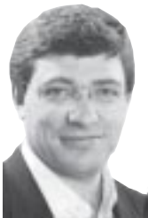
Escribe: Juan Carlos Giordano

Los medios de comunicación se han encargado en estos días de generar un interrogante: ¿Si cae Duhalde, no puede venir una salida militar? Si bien es cierto que ante la debilidad del Presidente jefes militares discuten qué hacer ante la crisis, está claro que no hay posibilidades de golpe. Por otro lado se siguen desarrollando las asambleas y la Interbarrial como un poder alternativo a todo lo viejo. Es indispensable abrir este rico debate entre todos los que estamos peleando.