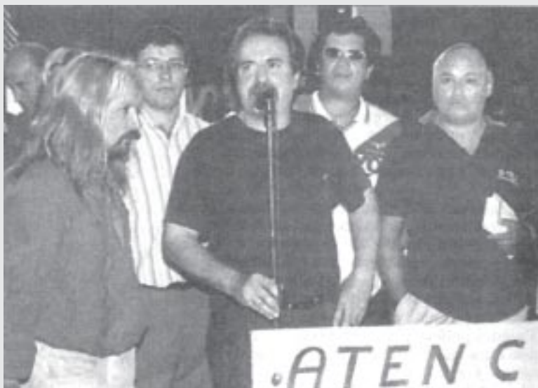
Conferencia de prensa en la estación Once. Lunes 25

Los trabajadores ferroviarios explican en un volante las razones de su paro: “hemos agotado todas las instancias, para hacer valer nues-