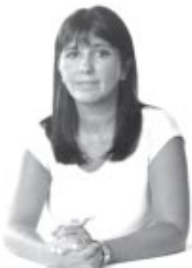
Patricia Walsh, diputada nacional de Izquierda Unida

Patricia Walsh, diputada nacional de Izquierda Unida, presentó el pasado viernes un proyecto de ley. No era uno más. Es el que reclama la anulación de las leyes de obediencia debida, punto final y los indultos a los genocidas de la dictadura.