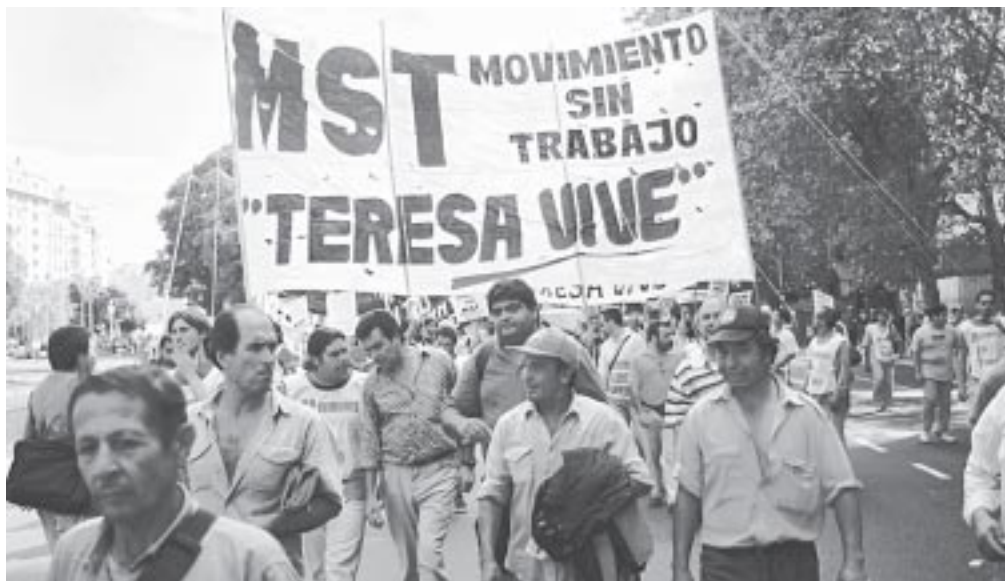
Los desocupados salen a la calle contra el plan de hambre.

Fiesta de la Juventud Socialista de Sur Sábado 8/6 23 hs. España 167. Avellaneda (a 2 c. del Pte. Pueyrredón)