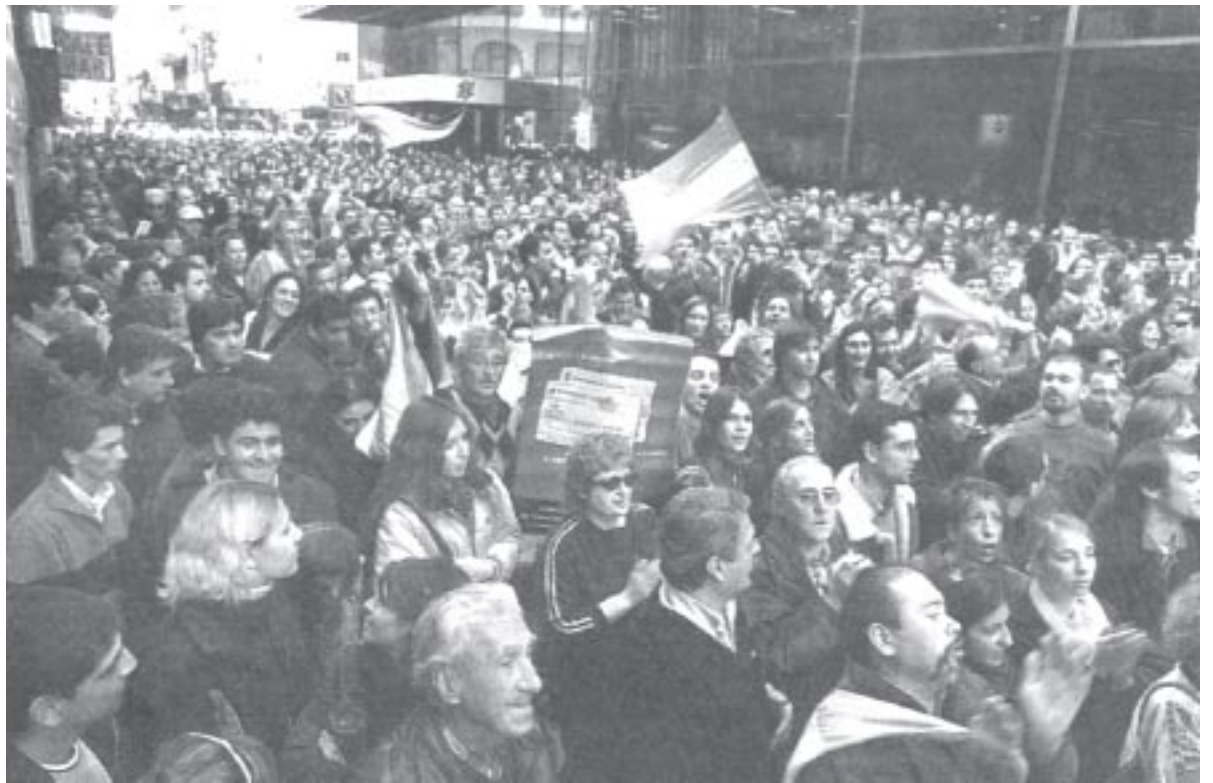
Marcha unitaria de bancarios y ahorristas en el microcentro.