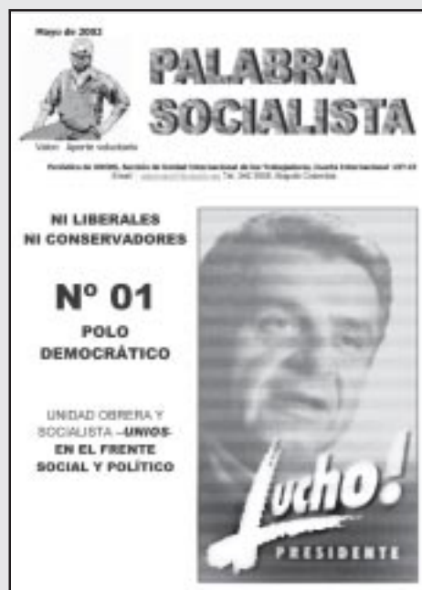
Facsimil del periódico de UNIOS.

Fue precisamente UNIOS quien tuvo la iniciativa luego de las elecciones parlamentarias del 11 de marzo de llamar a todos los elegidos