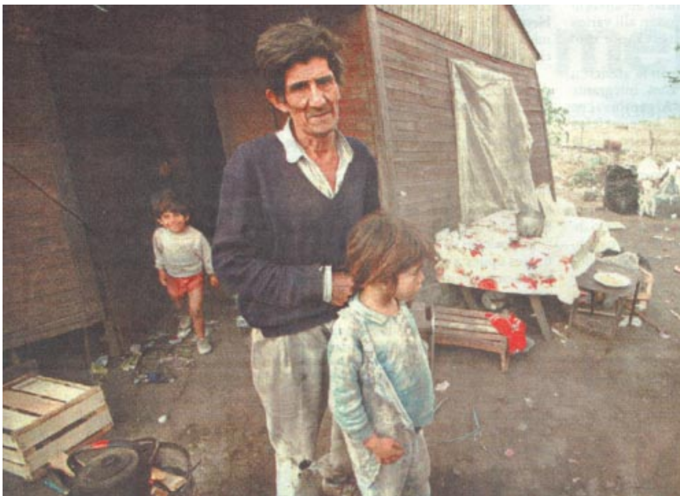
Un hombre y dos de sus hijos en Aguilares, Tucumán. En esa provincia la mortalidad infantil fue en 2001 de 22,6 por mil. Ocho puntos más que la del país.

pulares, ollas populares, huertas comunitarias, clubes de trueque, reclamos de comida a empresas y supermercados, a los municipios, organización de comedores en las escuelas, etc. Estas soluciones de emergencia, aunque sean precarias y transitorias, son muy importantes no solamente porque logran que un día o una semana coman los que no tenían comida en un barrio, sino que además ayudan a tejer lazos de confianza y solidaridad populares, a construir una organización que necesitamos para ese cambio de fondo.