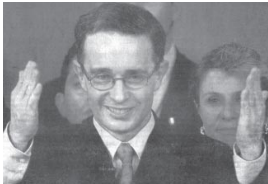
Álvaro Uribe ganó pero se la va a ir borrando la sonrisa apenas empiece a gobernar.

Al consolidarse el Polo Democrático (acuerdo electoral entre el FSyP y los parlamentarios independientes), la figura del líder sindical se catapultó alcanzando el 6,2% de la votación. Este guarismo fue más impactante