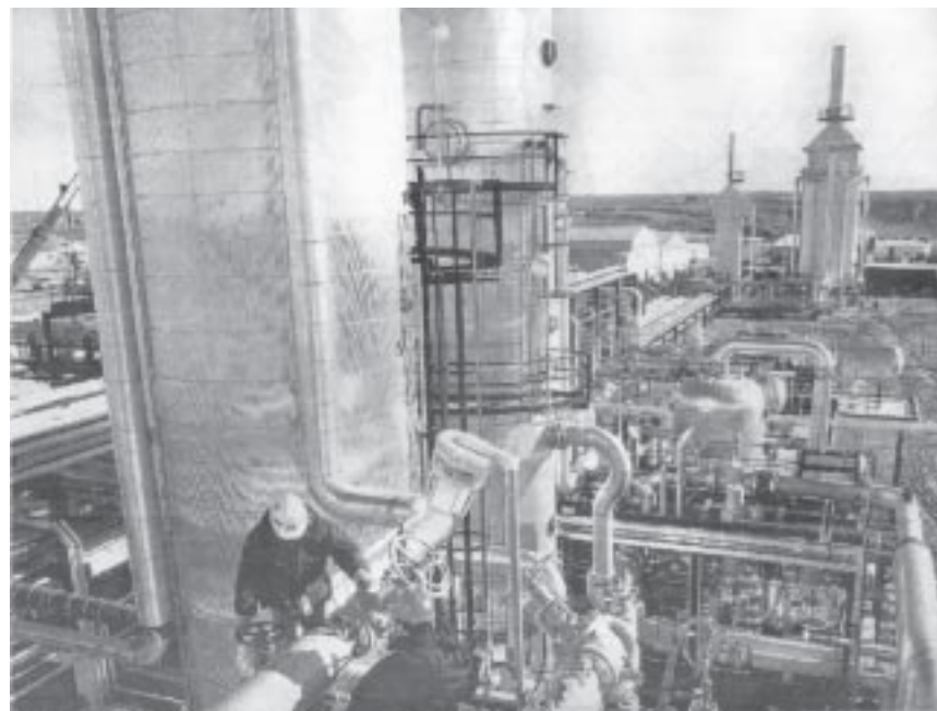
El gas y petróleo son riquezas naturales que deben estar en manos del pueblo.

En su momento gran parte de la población creyó que la privatización iba a favorecer el funcionamiento de los servicios. Esto fue porque los gobiernos peronistas, radicales y las dictaduras militares las fueron destruyendo y