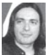
Escribe Daniel Campos, diputado de IU-MST

Encabezados por los dirigentes ferroviarios de la seccional Haedo, cientos de assembleístas y piqueteros, junto a legisladores, delegados obreros y dirigentes estudiantiles pusimos en marcha el Tren de la Resistencia, que el viernes 17 de mayo unió en su primer viaje la estación Once con Mercedes. La Comisión Nacional Salvemos al Tren crece y se prepara para seguir surcando el país con el Tren de la Resistencia.