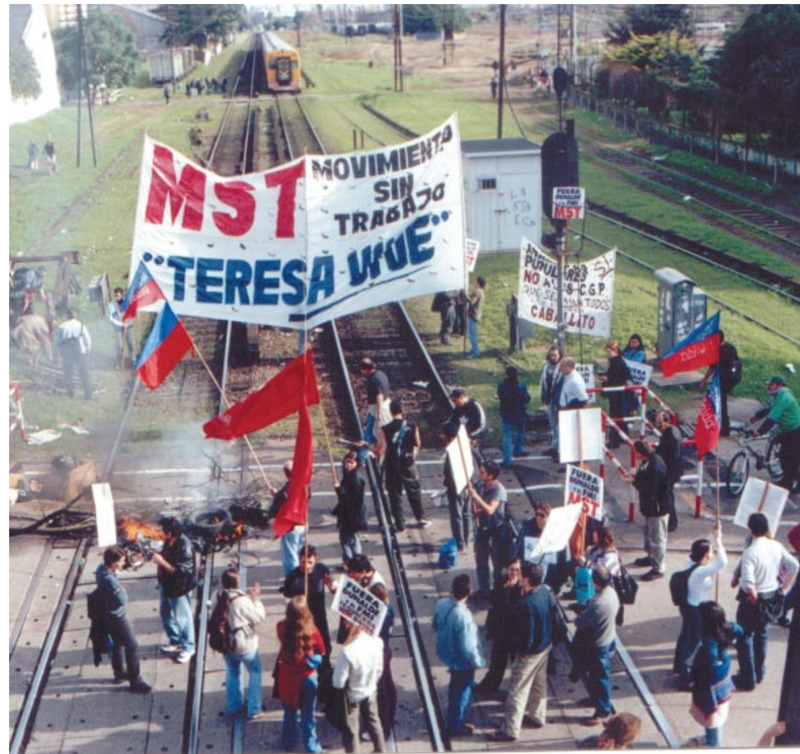
En Caballito impiden el paso del tren el Movimiento Teresa Vive junto al MST, la asamblea de Caballito y el Centro de estudiantes de Filosofía y Letras.

• Santiago del Estero: corte de calles y olla popular frente a la Municipalidad.