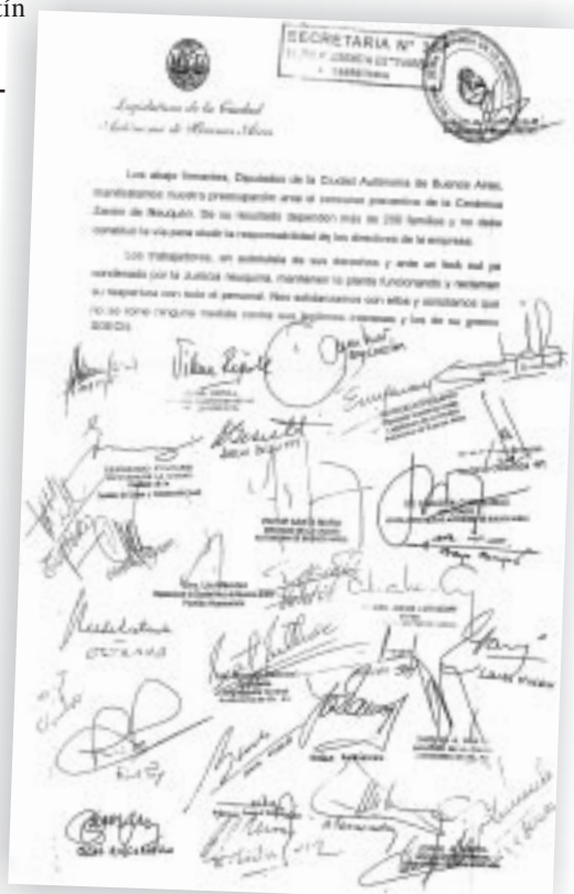
Facsímil de la nota entregada en la embajada.