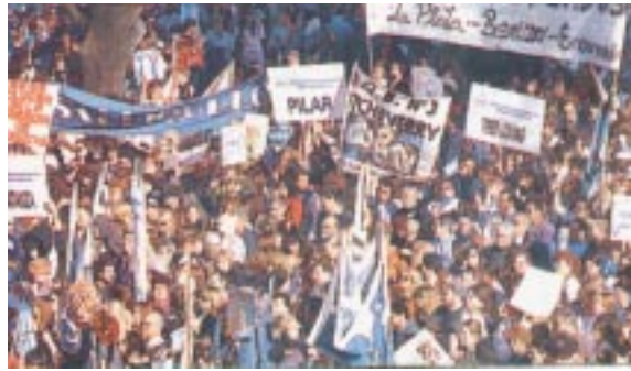
24/5: 20.000 docentes marchan en La Plata.

AS: ¿Cómo se organizan para llevar adelante esta lucha?