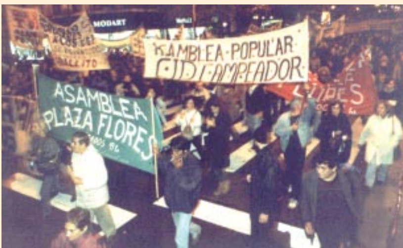
La columna que marchó a Plaza de Mayo.

Finalizada la concentración en la Plaza de Mayo, gran parte de las asambleas, seguidas por una nutrida columna del MST, marcharon a escrachar a las sedes nacionales de la UCR en la calle Alsina y del PJ en la calle Matheu.