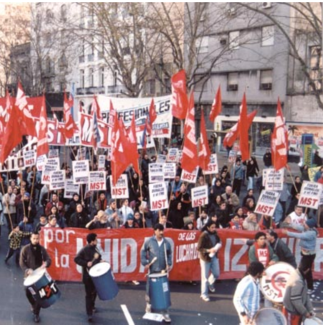
Una nutrida columna de varias cuerdas a la gran marcha del 9 de Julio. Los barrios de la Capital y zonas del Gran Buenos Aires, se congregaron más de 5.000 compañeros, jóvenes, desocupados y trabajadores.

bilidad nueva de salida a la crisis. La lucha por que se vaya Duhalde tiene una importancia todavía más grande, por dos razones fundamentales. En primer lugar profundizaría la ruptura y llevaría a la división al principal partido que en la última década cumplió los planes de hundimiento del país haciendo de gerente del FMI, el PJ, desmoronando por completo el viejo sistema político. Pero en segundo lugar abriría de par en par las compuertas para que los trabajadores