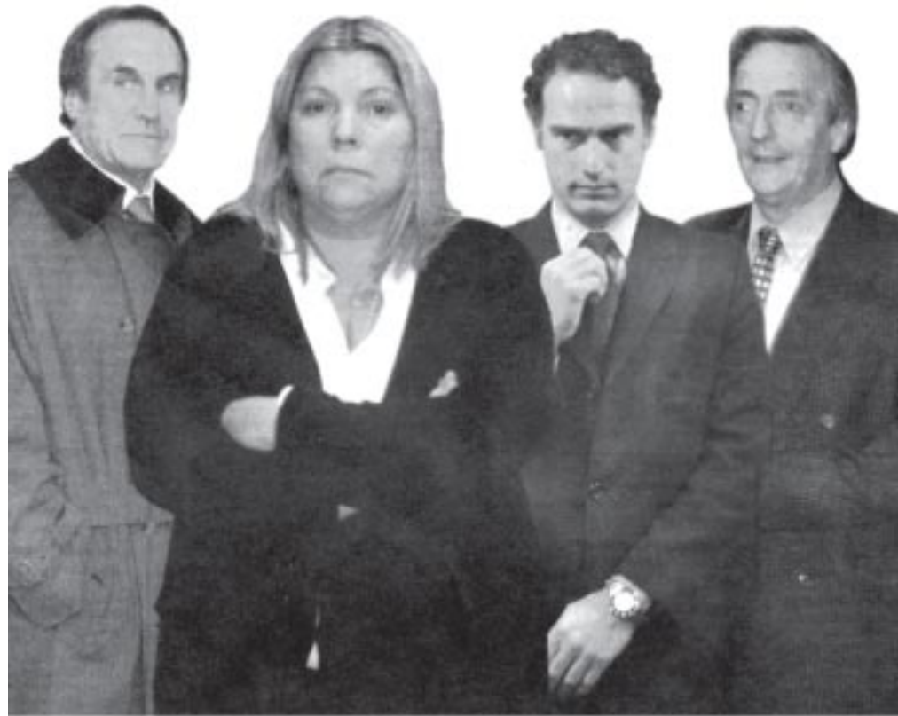
Carrió pide «renovar» los mandatos. Reutemann, Ibarra y Kirchner la acompañan.

La propuesta de Carrió y sus acompañantes dista mucho del verdadero reclamo popu-