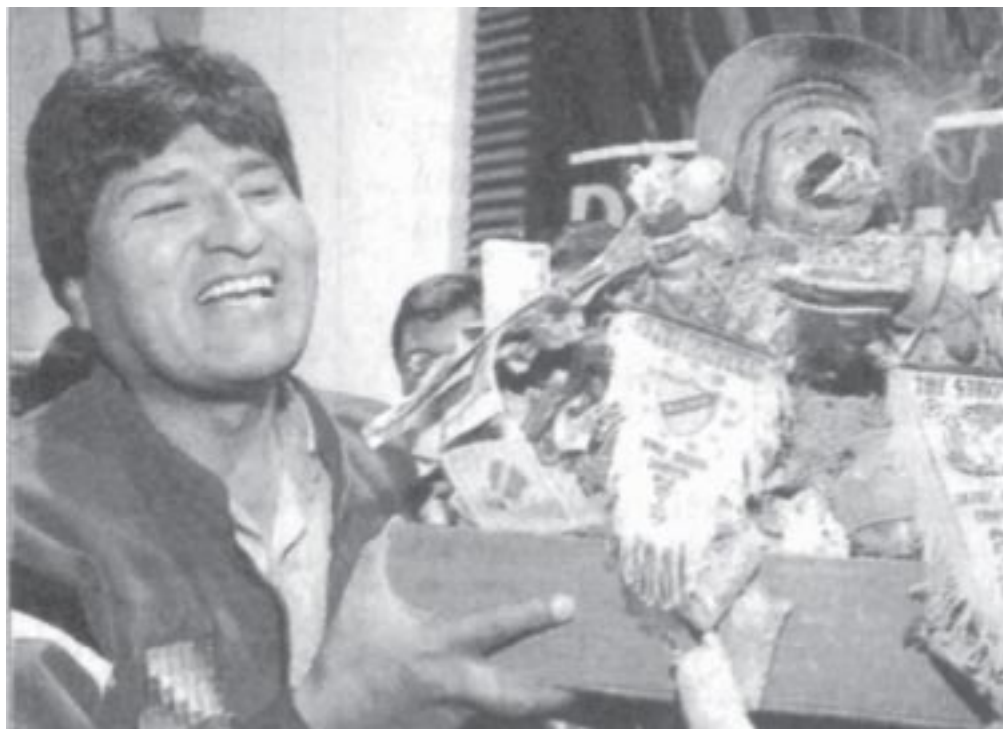
Evo Morales, dirigente campesino y candidato a presidente

El resultado electoral significa una catástrofe para los partidos tradicionales de Bolivia. El partido que venía gobernando, la ADN de Banzer, salió quinto y casi no sacó legisladores. El MIR, que era otro candidato firme y que también había gobernado con una política