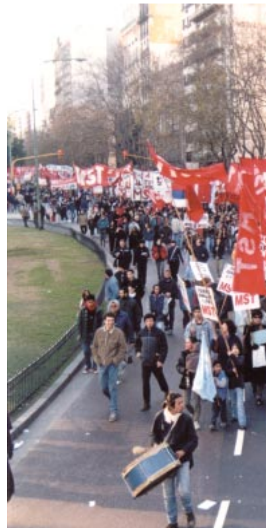
El MST en Izquierda Unida. Desde distintos barrios.

Frente a la enorme respuesta popular por la brutal cacería desatada por el gobierno contra los piqueteros en Avellaneda, el gobierno de Duhalde acusó el golpe. Intentó meter miedo para hacer más chica la marcha del 27 de junio.