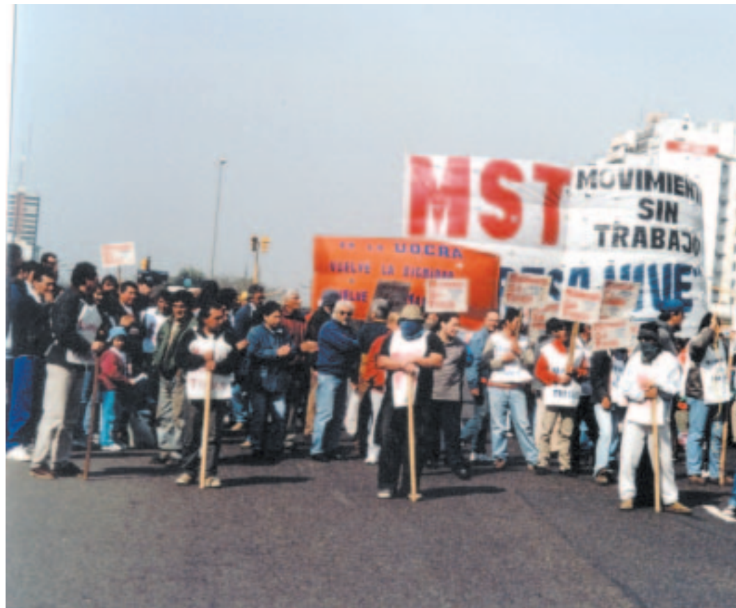
Corte de la Av 9 de Julio en la jornada del 5/9

Conseguir un subsidio, un plan de empleo y la comida diaria para sobrevivir ayuda a pelear y organizarse para conseguirlo sirve para pelear mejor. Esta es una conclusión a la que llegan todos los compañeros. Todas las formas de organización que ayuden para conseguir lo que necesitamos y pelear mejor, son válidas. Por eso es explosiva la organización de comedores y la pelea porque el gobierno ponga la comida. El comedor también organiza. Y sobre todo ayuda la asamblea del movimiento donde se juntan los compañeros y debaten todo. Cómo preparar la próxima acción, cómo repartir lo que se consiguió, que siempre es menos de lo que se necesita, cómo seguir la pelea. En la asamblea también se debate de política. Porque para conseguir trabajo genuino hay que luchar, pero no alcanza, también hay que hacer política. Organizarse