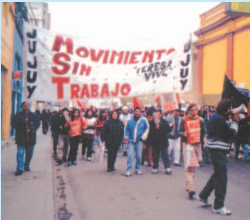
Marcha del Movimiento Sin Trabajo en San Salvador Jujuy

pide que "en la calle, cuando movilizemos seamos todos estos y más", algo que arranca el apoyo entusiasta de los más decididos, entre ellos muchos compañeros que ya tienen un plan o lograron su bolsón. Pero que tienen claro que la pelea es más de fondo: por trabajo genuino y que para hacerlo realidad es necesario lograr que se vayan todos "y en primer lugar Duhalde, que nos hunde cada día más en la pobreza".