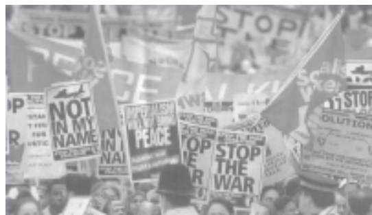
En el 2001 ya hubo marchas en Londres contra la guerra

en Londres. Entre los convocantes ya hay 10 sindicatos nacionales, numerosos diputados, sacerdotes, organizaciones pacifistas y de derechos humanos, seccionales del partido laborista en barrios obreros, dirigentes de la izquierda laborista como Tony Benn, partidos de izquierda trotskista, pres-