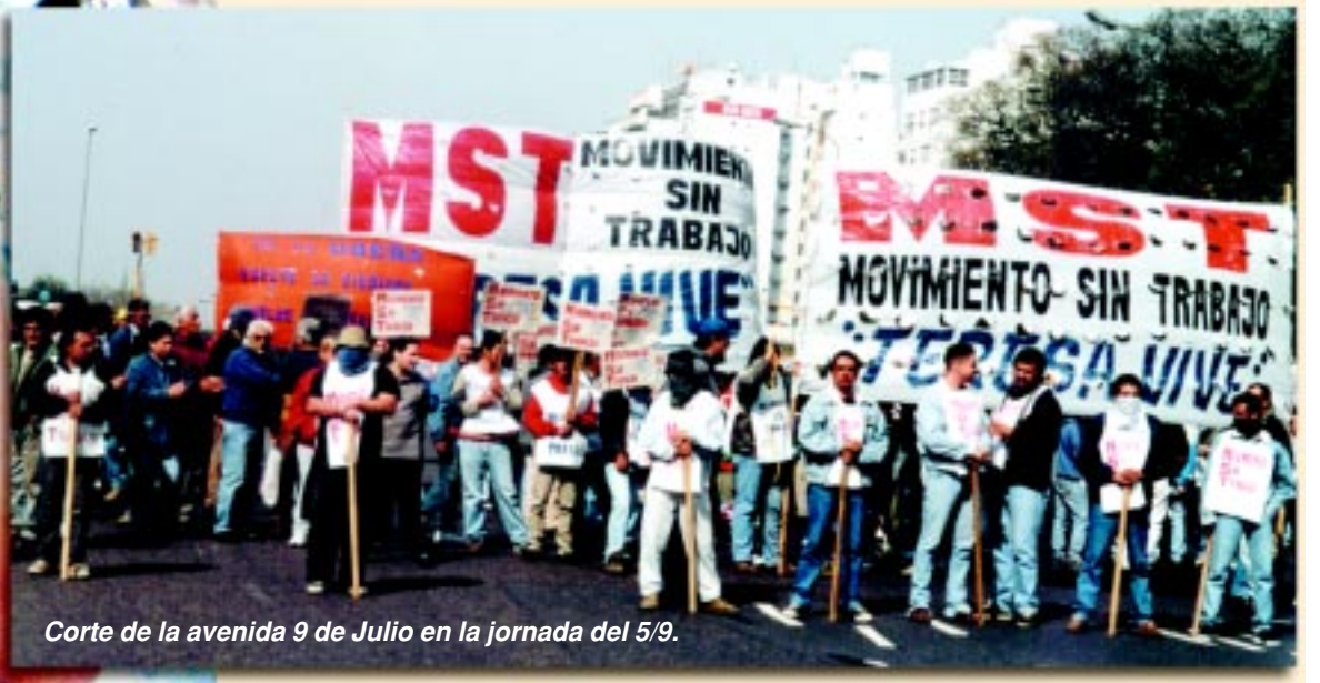
Corte de la avenida 9 de Julio en la jornada del 5/9.

Abastecimiento a los comedores, merenderos, copa de leche, etc.