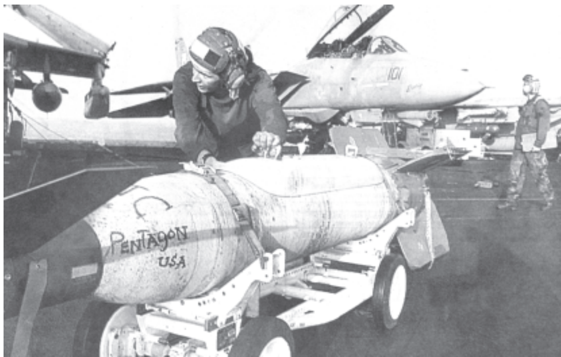
Los yanquis se siguen preparando para una nueva agresión en el Golfo Pérsico

Por si esto fuera poco la economía yanqui tiene cada vez más problemas. La quiebra fraudulenta de empresas iniciada por la Enron y seguida por World Com y decenas de enormes conglomerados, está afectando directamente los ahorros de 80 millones de norteamericanos (lo que demuestra otra vez que el robo a los ahorros populares no es un mal argentino sino del capitalismo).