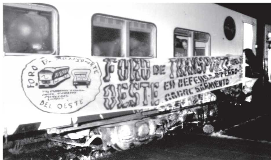
El 1º Tren de la Resistencia saliendo de la estación Once hacia Mercedes

nal concretamente, los Bancos Nación, Provincia y Ciudad de La Plata. Ya han comenzado las primeras reacciones contra esta ofensiva del gobierno y las privatizadas. La seccional Gran Buenos Aires Oeste de la Unión Ferroviaria ha votado un plan de lucha contra la renegociación de los pliegos y el aumento de tarifas, los bancarios le han dado un abrazo de más de 600 trabajadores a la sucursal del Banco Provincia de La Plata, y prepara otro para el 19 de diciembre en casa central. El II Tren de la Resistencia es para pelear por la reestatización de los ferrocarriles y también para unificar a todos los sectores que luchan contra las privatizadas, a quienes reclaman contra Repsol-YPF, a las asambleas que protestan contra las tarifas del gas y la luz, a los movimientos de desocupados que reclaman la reestatización para recuperar los puestos de trabajo que con las privatizaciones perdieron, a los trabajadores que ponen a trabajar las empresas y que necesitan los servicios baratos para hacerlas producir. El 2º Tren de la Resistencia es para unir la lucha contra el tarifazo y las privatizadas.