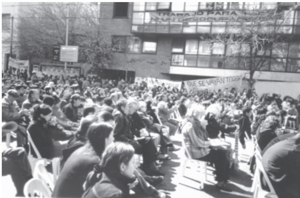
Frente a la fábrica ocupada Brukman sesionó el Encuentro.

El Encuentro de Brukman fue un paso adelante. Sin embargo tuvo carencias que es fundamental marcar para poder seguir avanzando en una coordinación efectiva. Fue un error de la