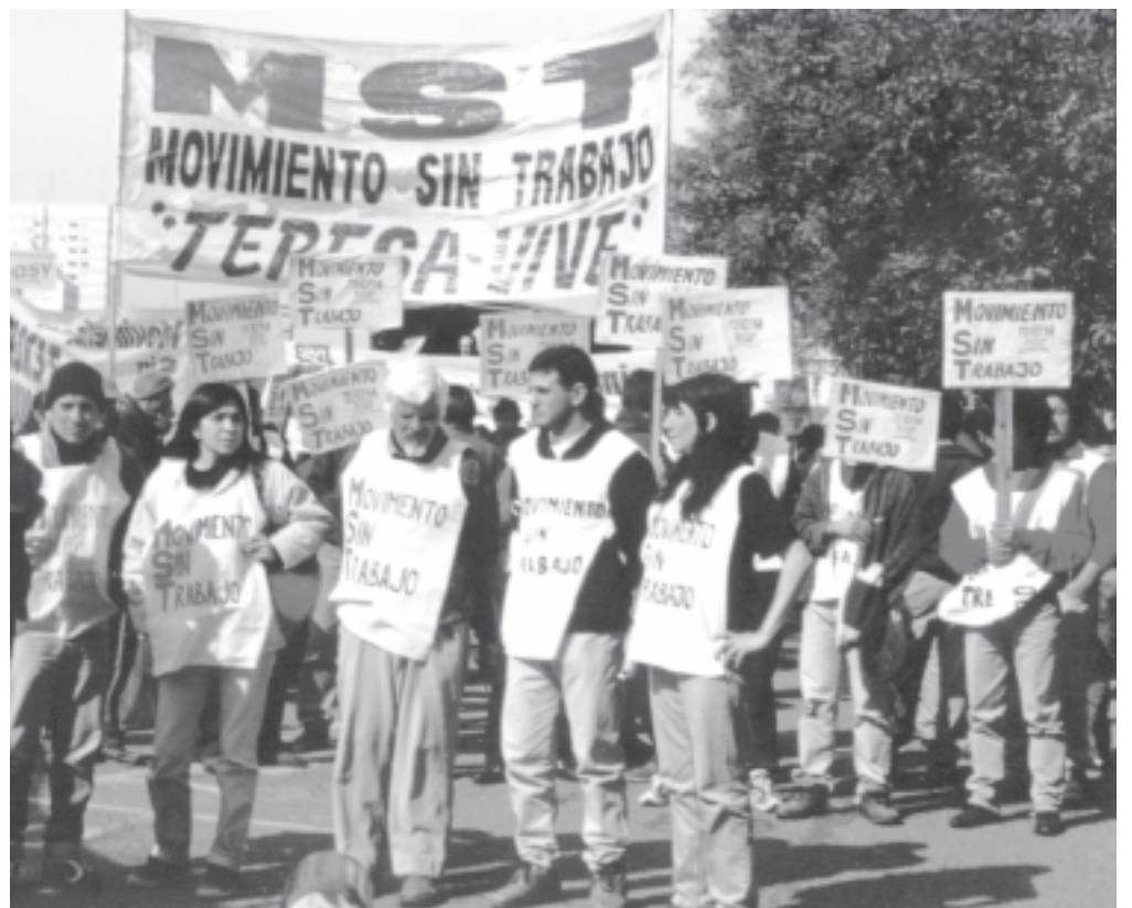
El MST-Teresa Vive sigue organizando cortes y marchas en todo el país.

Cada semana nuevos compañeros discuten cómo movilizarse a los municipios para conseguir la comida para los comedores. Cómo planifican el trabajo de las panaderías comuni-