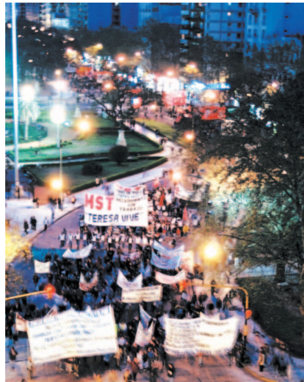
Marcha del 20/9 que unió a los piqueteros con las asambleas y la izquierda. Esa unidad debe ser la base de una nueva alternativa política.