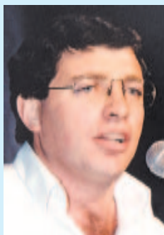
Escribe: Juan Carlos Giordano

Miles se preguntan si tenemos que seguir condenados a vivir en el hambre, la miseria y desocupación de por vida. ¡Esto no se aguanta más!, se sostiene en la calle. No es para menos. Más del 50% de la población vive en la pobreza, 6 millones están con problemas de empleo y las cosas siguen aumentando. Encima, el FMI quiere más despidos, ajuste y recesión. Hay otra salida. Acá planteamos varias propuestas que tendremos que imponer con lucha y movilización.