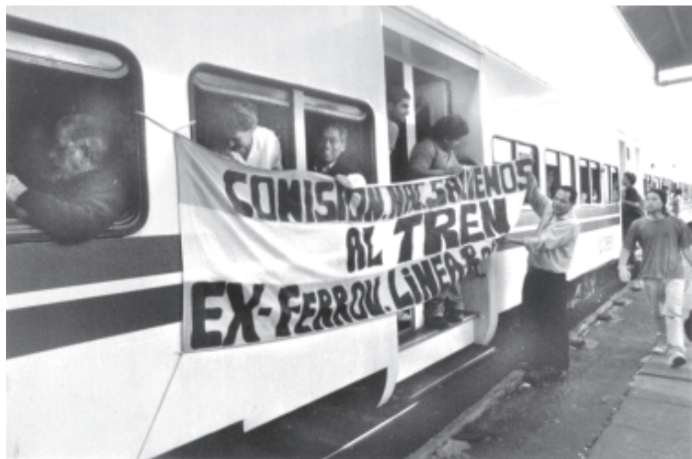
El Tren de la Resistencia fué saludado en todas las estaciones

En la estación de Quilmes esperó la asamblea de Quilmes Centro y en Berzategui, asambleístas junto a los piqueteros de la CCC y la agrupación de ferroviarios desocupados recibieron con banderas, cantos y un acto al Tren de la Resistencia. Más de 100 compañeros se subieron allí. Caían las primeras sombras de la noche cuando el Tren entraba a la estación de Villa Elisa. Allí la asamblea vecinal nos recibió con otro acto. Más de 150 compañeros, con banderas argentinas y toda la estación y sus accesos embanderados saludando al Tren de la Resistencia, reclamaron la reestatización. El guarda debió demorar la partida hasta que los medios cubrieron toda la emotiva ceremonia. Hubo otro acto en la estación Tolosa, donde Metropolitano cerró los históricos talleres ferroviarios, y allí subieron más compañeros.