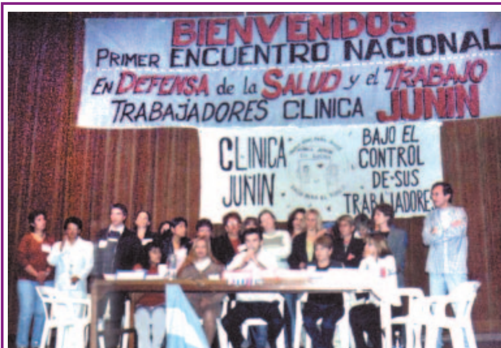
El Encuentro convocado por Clínica Junín fué un ejemplo de solidaridad

A los ojos del pueblo trabajador también la centroizquierda es parte de lo viejo. Carrió aparece a la vista de millones como un espejo que repite las imágenes del Frepaso. Con denuncias contra la corrupción, pero ninguna propuesta distinta a la de los viejos partidos para terminar con el hambre, la desocupación y la entrega del país al FMI. Se apoya en parte de las mismas fuerzas que ya fracasaron con la Alianza de De la Rúa: una parte del radicalismo, lo que queda del Frente Grande de Chacho Alvarez, Meijide e Ibarra y el ahora "unificado" socialismo con historia de estanciero y gorila. Una mujer valiente, puede ser, pero que defiende un sistema político agonizante que no tiene cura.