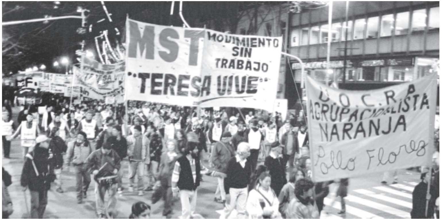
La columna del MST-Teresa Vive en la marcha del 20/9 de Congreso a Plaza de Mayo.

El MST "Teresa Vive" sigue creciendo y está programando nuevas y mayores peleas. La Jornada del 3 significará un nuevo desafío. Movilizaremos masivamente frente al Ministerio de Trabajo, cortando las calles y dispues-