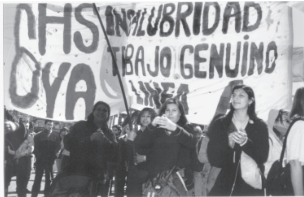
Los compañeros de Metrovías siguen movilizados por la jornada laboral de 6 hs.

Le pregunto qué ánimo hay en su línea y los pasos a seguir: «Después del veto, había bronca y confusión sobre cómo seguirla. Encima la gente del gremio, que venía frenando la lucha, salió a tratar de imponer un paro. Y a los dos días, tuvimos las elecciones. Imaginate... Ahora hay un reanimamiento. Estamos informando a todos los compañeros que la Comisión rechazó el veto. Ya programamos asambleas generales en todas las líneas los próximos días, para discutir qué otras medidas preventivas hacen falta. Junto con eso, estamos visitando legislador por legislador... Y están las actividades de este viernes, donde los delegados vamos a repartir un volante a los usuarios. La UTA tendría que organizar alguna acción con los colectivos antes del 10, y ese día movilizar con todo. Además, reclamar que la CGT Moyano apoye... Pero lo central es preparar a todos los compañeros y lo-