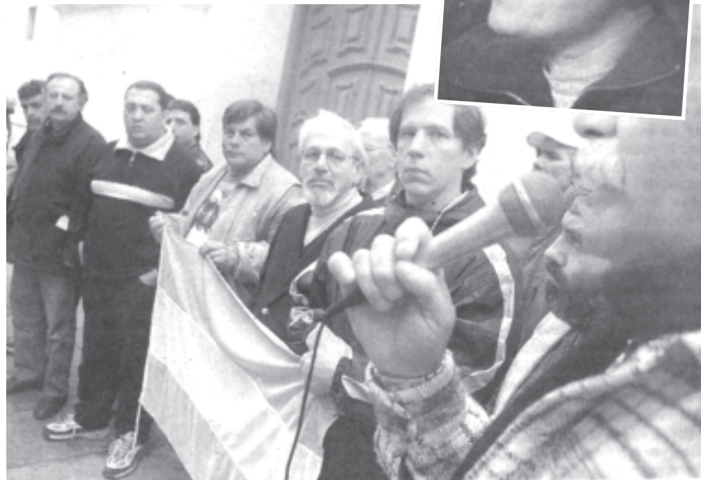
La conducción de la CTA en cabeza por Víctor De Gennaro (foto arriba) marcha a un nuevo congreso

La conducción de la CTA no llama a unirse con los luchadores barriales, piqueteros, estudiantes, nuevos dirigentes y partidos de izquierda, quienes son una parte fundamental de las principales luchas y movilizaciones ar-