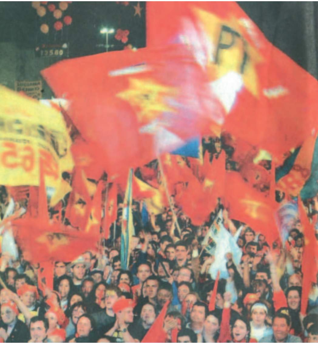
el giro a izquierda de las masas.

el gobierno de la Alianza. Lo mismo pretenden hacer los dirigentes del radicalismo pero la verdad es que el viejo partido de Alfonsín sigue en coma 4 y profundizando sus divisiones.