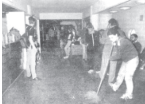
Acondicionando el sanatorio cerrado hacia cinco años

De todos los que tuvieron que irse y los que están en riesgo de volverse frustrados a