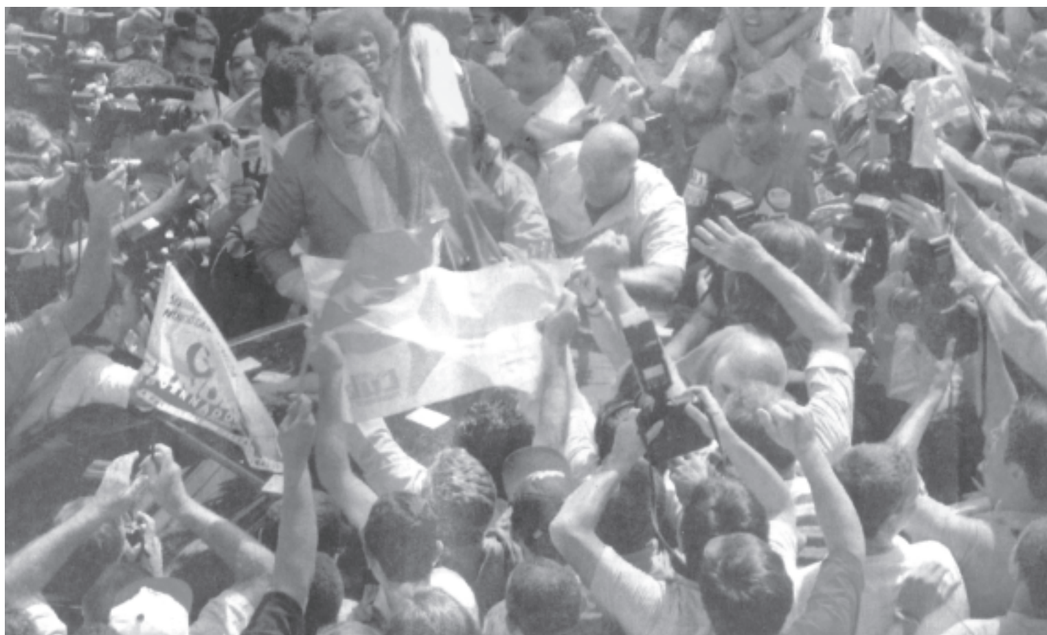
Lula festeja el triunfo del primer turno y se prepara para ganar el segundo

En el primer turno Lula y el PT obtuvieron un triunfo resonante con 39.443.765 votos, el 46,4%. Dobló a Serra(PSDB), el candidato del gobierno de Fernando Henrique Cardoso, que obtuvo 19.700.395 votos (23,2%). La victoria de un candidato presidencial de origen obrero es un hecho histórico para Brasil e indica que avanza el giro a izquierda de las masas en Latinoamérica. Es un triunfo inmenso de los trabajadores, pero contradictorio, porque se trata de una alianza del PT para gobernar con importantes sectores patronales. Pero la pelea electoral no ha culminado. El domingo 27 se define en la segunda vuelta entre Lula y Serra.