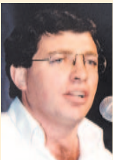
Escribe: Juan Carlos Giordano

Tanto en las encuestas como en las calles, el pueblo ya venía condenando a los jueces de la Corte. El 19 y 20 de diciembre no sólo cayó De la Rúa, sino que fueron imputadas todas las instituciones de esta "democracia" corrupta como responsables de los males populares. Dentro de ellas, la Corte ocupaba uno de los principales lugares.