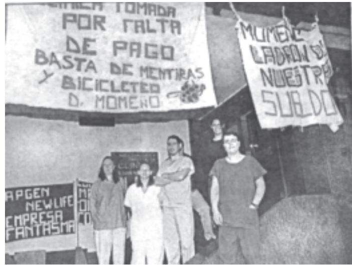
Trabajadores en la puerta de la clínica ocupada