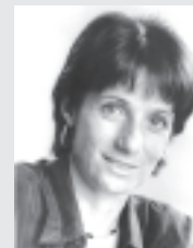
Escribe Vilma Ripoll

En un editorial del 10/10 La Nación ataca las recientes expropiaciones de empresas quebradas y vaciadas. Para el diario es un atropello a la "propiedad privada".