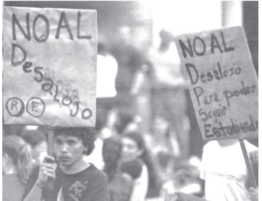
Los estudiantes rechazaron el intento de desalojo