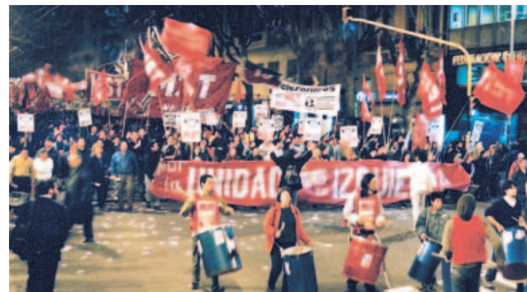
La unidad de la izquierda puede ser un polo de atracción para los que rompen con los viejos partidos.