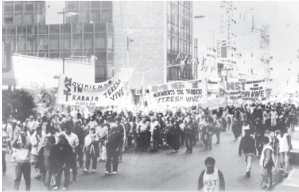
El 3/10 el MST «Teresa Vive» hizo una gran marcha por Corrientes hasta el Ministerio de Trabajo

significa desviar los planes que son nuestros hacia sus punteros para tratar de ganar votos. Y las exigencias del FMI que no quiere que ni un solo peso vaya a los presupuestos sociales.