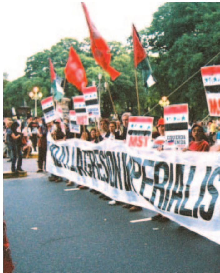
El 24 de marzo el MST participó con una gran