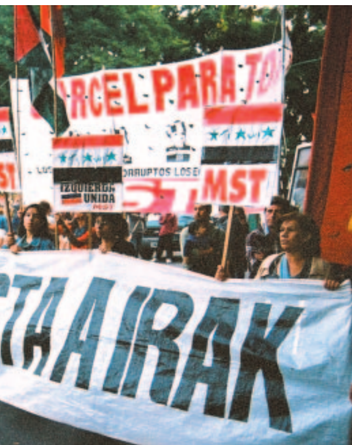
columna de la marcha contra la guerra en Irak.

Bush asesino! Esto, repetido en todos los idiomas, en colegios y universidades, expresado en huelgas frente a la policía en El Cairo y San Francisco, visiones de la muerte en Inglaterra, que insultan a Bush mismo ocurre en Buenos Aires y en gran parte de América Latina. Estos millones acompañan y tienen que ir que están llevando adelante el pueblo iraquí.