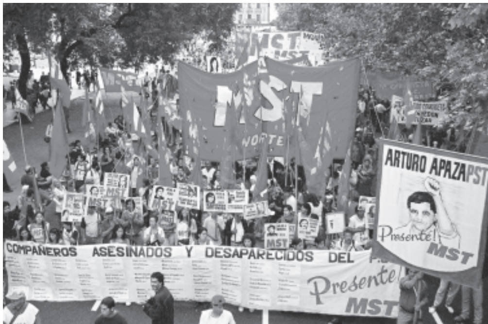
La columna del MST el 24 movilizó más de 8.000 compañeros. Fue la más grande del último año.

Estamos hoy aquí en graves y decisivos momentos para la humanidad, conmovida por una