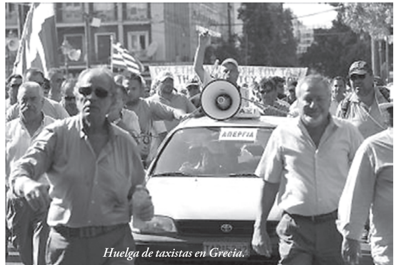
Huelga de taxistas en Grecia.

Cuando la ONU ha reconocido "que el progreso en la lucha contra la pobreza... es desigual y que los que están en el último escalón de la pobreza han quedado rezagados de las mejoras y no han mejorado su calidad de vida". Y "así, cerca de una cuarta parte de los niños en el mundo en desarrollo sufren de insuficiencia ponderal, es decir tienen un peso por debajo del mínimo considerado saludable" (Clarín 11/07/2011), en medio de semejante crisis mundial, Jill Trenor señala en su informe al matutino The Guardian que "Los millonarios en todo el mundo hoy han recuperado las pérdidas que sufrieron