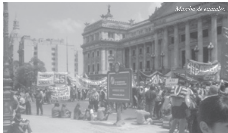
Marcha de estatales.

La CTA ha resuelto programa de acciones a las que hay que ponerle fecha y se han efectivizado