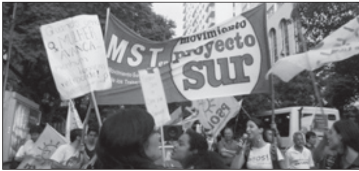
El MST marcha en la columna del PSOL en la apertura del Foro