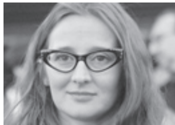
Lucrecia Martel, joven directora del nuevo cine argentino.