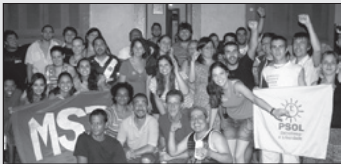
Militantes del MES y de la juventud del MST que intervinieron en el Foro de Porto Alegre