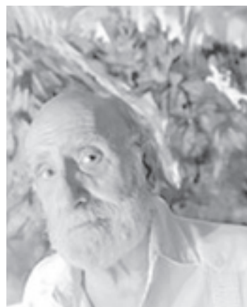
Luis Felipe Noé, artista plástico

explicar estos problemas. Y en su debilidad, el gobierno tuvo un primer recule en Famatina, tiene que hablar contra las petroleras y después de hablar del 18% de tope salarial ahora dice que "son libres". Todo producto del mal enero que vivió y de los cambios en curso, de los cuales Plataforma es una expresión concreta. Correctamente, entre otras cosas Plataforma denuncia que el gobierno y los intelectuales que lo apoyan "quieren aparecer como actores de una gesta contra las "corporaciones", mientras grandes corporaciones como la Barrick Gold, Cerro Vanguardia, General Motors, las cerealeras, los bancos o las petroleras - y el propio grupo Clarín, hoy señalado como la gran corporación enemiga - han recibido enormes privilegios de este gobierno". Saludamos, la irrupción de este espacio y esta declaración, que abre un antes y un después en el mundo de la intelectualidad y la cultura. Ya que, como bien plantea Plataforma: "la homogeneidad discursiva empieza a estar atravesada por algunas filtraciones