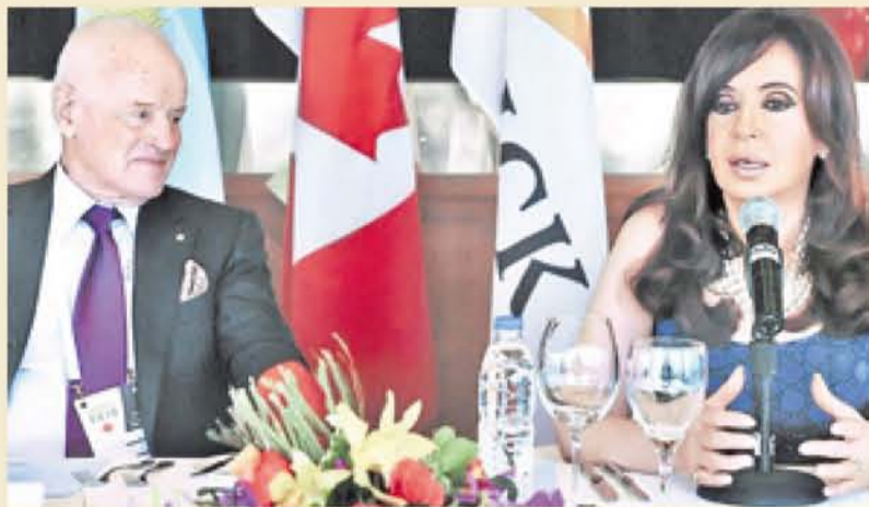
Cristina con el capo de la Barrick Gold, en junio de 2010, en la reunión del G20.

En enero de ese año, Néstor presentó el Plan Minero Nacional a los empresarios del sector. Entre otras perlas, dijo: "El sector minero es uno de los pocos que durante la década del '90, con cambios importantes en la legislación, empezó a tener un punto de inflexión... y fue mostrando un crecimiento casi permanente. Más allá de una legislación que nosotros estimamos que fue positiva, que ayudó, hoy estamos ante una posibilidad concreta de consolidar el proceso de inversión y desarrollo minero en la Argentina... Desde el gobierno nacional vamos a jugar fuertemente a apoyar al sector... para garantizar las perspectivas de