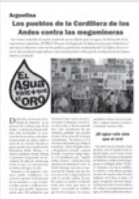
Facsimil del boletín que distribuimos

Varios medios de Brasil reflejaron la actividad que la delegación del MST desplegó en solidaridad con Famatina en el Foro Social de Porto Alegre. Para empezar distribuimos miles de boletines en español y portugués explicando la realidad de la megaminería en Argentina, la complicidad del gobierno nacional y la nueva coyuntura con la pueblada de Famatina. En paneles, reuniones y en la Asamblea de Movimientos Sociales –cuyo documento final recogió este punto– planteamos con fuerza la solidaridad con la lucha contra el saqueo y la contaminación e hicimos un fuerte llamado a poner en pie un movimiento continental en defensa de los recursos naturales.