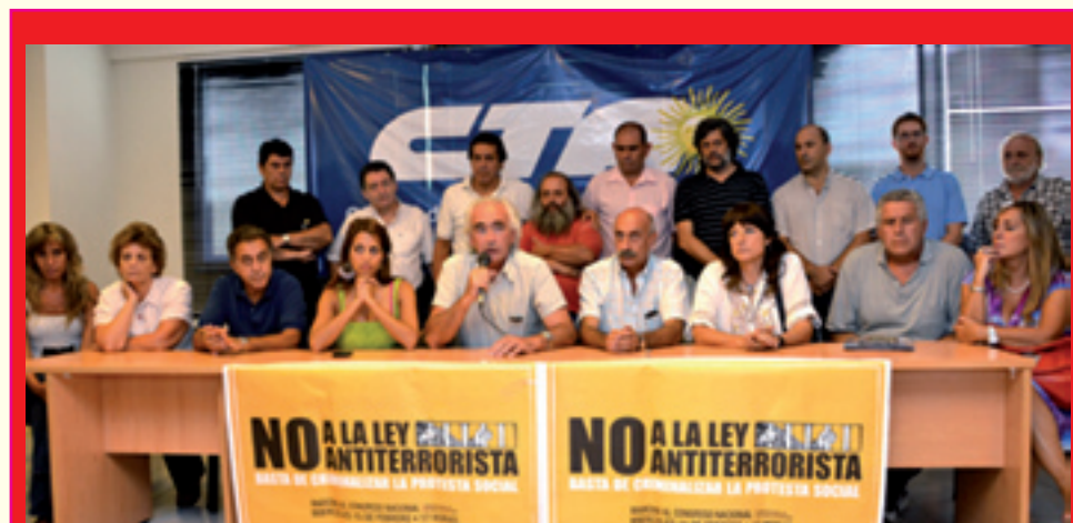
Conferencia de Prensa en la CTA Nacional, convocando a la marcha unitaria del 15/2