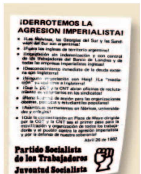
Volante del PST (antecesor de nuestro partido)

Es decir: así como la dictadura genocida era incapaz de ganar la guerra por inoperancia política, militar y por el terror a la movilización; por razones parecidas, difícilmente el gobierno nacional logre avanzar con discursos altisonantes y “teatralizaciones” políticas en la recuperación soberana de las islas. Esta es nuestra visión del tema.