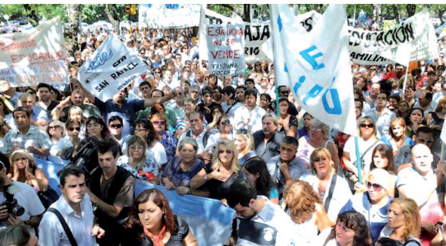
El 28 en Mendoza se movilizaron más de 8.000 docentes.

Tan aisladas dejó CTERA a las luchas provinciales bajo el gobierno de los K que apenas si hubo algunas pocas fotos mediáticas de dirigentes frente a alguna casa de provincia. La Celeste llevó así a que la CTERA deje de ser la herramienta nacional para organizar el reclamo docente y educativo.