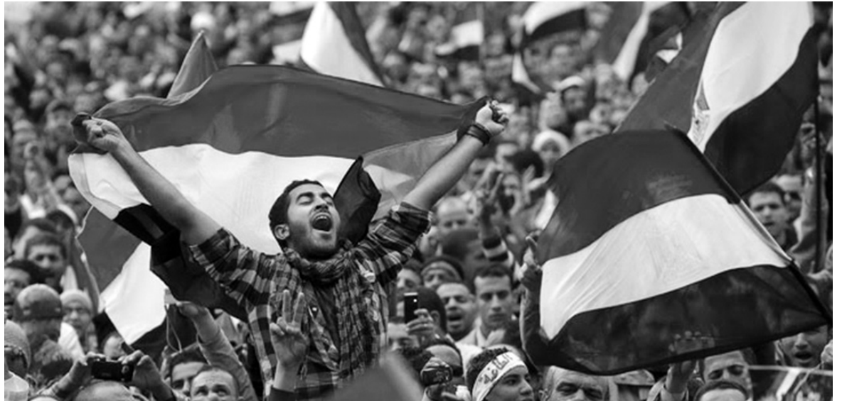
Plaza Tahrir, en Egipto, símbolo de la revolución de los pueblos del norte de África.

Hubo grandes coincidencias sobre la dimensión de la crisis económica que corroe al sistema capitalista y la perspectiva hacia una agudización de la lucha de clases a nivel mundial. La riqueza de la discusión estuvo alimentada por las exposiciones de camaradas que están participando activamente de los procesos revolucionarios más agudos que se están desarrollando en Europa y África, destacándose los procesos de Grecia, Siria, Egipto, Túnez y demás países árabes convulsionados por el ascenso revolucionario, a los que se votó acompañar con una campaña internacional de solidaridad. Sobre la construcción