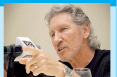
La semana pasada, en una conferencia de prensa en Chile, el músico británico Roger Waters, ex líder de la banda Pink Floyd, dijo que "las Malvinas son argentinas" y cuestionó duramente al gobierno de Margaret Thatcher. Un ejemplo.