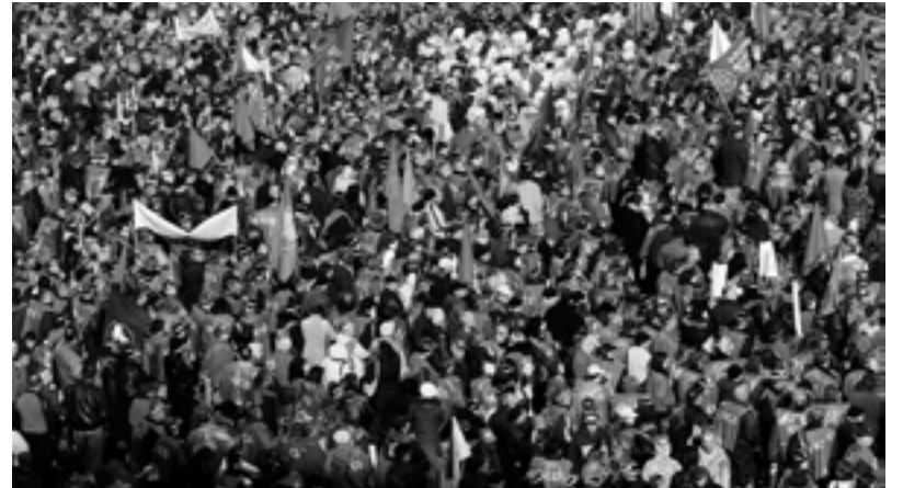
Multitudinaria manifestación en Moscú contra Putin y su victoria electoral

Nuestra participación en las elecciones presidenciales y parlamentarias es para probar nuestras fuerzas. Sabemos que ningún candidato nuestro va a ganar. En el parlamento nacional y en las