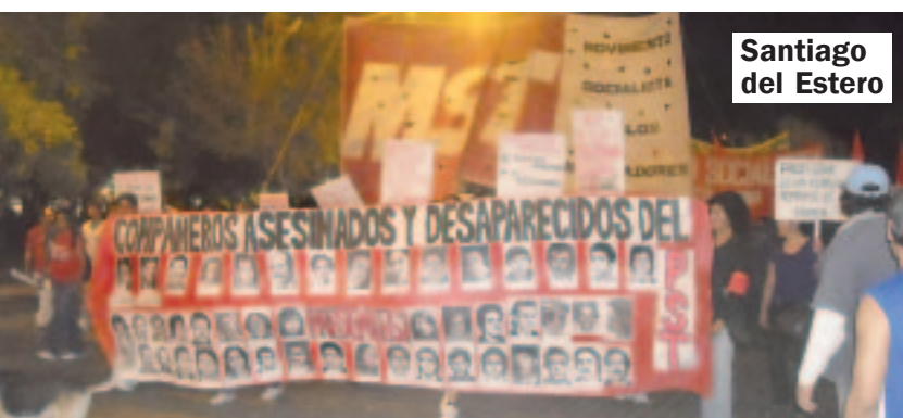
Santiago del Estero