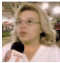
Docentes Unidos de Catamarca: ¡ni un paso atrás!

Cristina y los gobernadores se dan apoyo para que no se rompa el techo salarial. Así lo vimos con el aval presidencial al gobierno del PS en Santa Fe y la exigencia a la Celeste para que cerrara el conflicto. En San Juan, luego de un parazo y movilización de 10.000 docentes, la Celeste acepta la conciliación, ante sucesivos rechazos de la base a las ofertas oficiales. SITECH en Chaco va a otro paro. Y siguen los autoconvocados de Catamarca, organizados ahora en la CTA. ¡Todos debemos apoyarlos! Difundiendo su lucha y haciendo pronunciamientos y exigiendo a CTERA una medida para que triunfen las luchas provinciales.