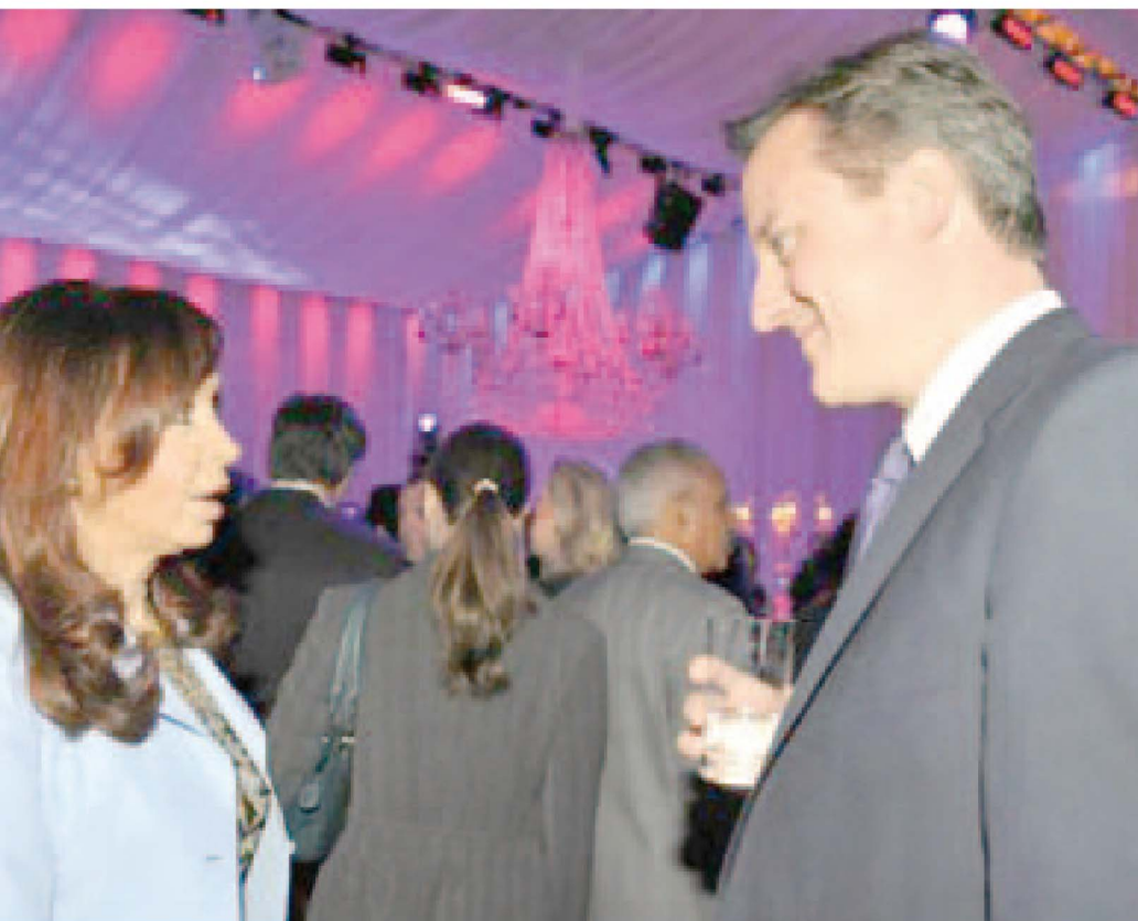
Cristina con el Primer Ministro inglés Cameron, en una reunión del G20.