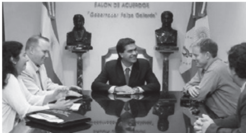
El Gobernador Capitanich con el comandante Edwin Passmore y Jefferson Brown, ministro consejero de la Embajada de los Estados Unidos en Argentina.

Que se escuche bien claro nuestro reclamo: ¡Ni un solo soldado yanky en el Chaco!