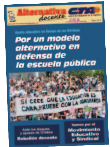
Salió el Boletín nacional de Alternativa docente, pedilo.