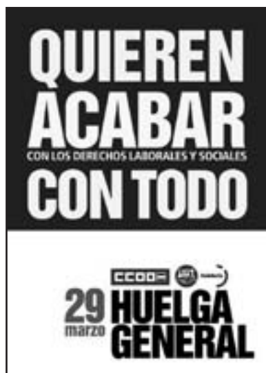
Cartel unitario llamando a la huelga

Sin lugar a dudas, los trabajadores de los Servicios Públicos, en especial los de la Sanidad y los de la Educación van a ser quienes