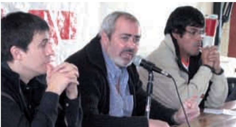
Conferencia de Alejandro Bodart sobre situación nacional

Y siempre, tal como obsesivamente lo discutimos, jugarlos a desplegar a fondo nuestras posiciones políticas explicando incansable y pacientemente por qué construir con el MST una poderosa organización revolucionaria en Argentina.