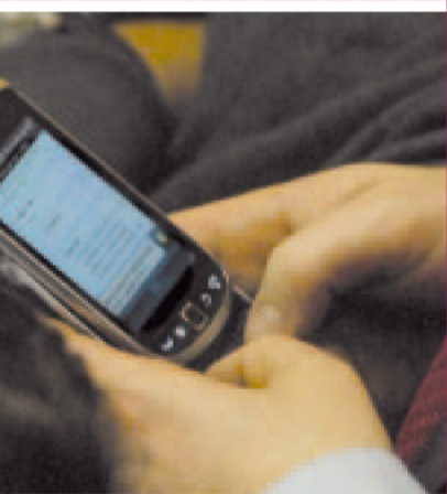
Ayer la Banelco hoy el celular.

ventilarse los dichos de Mariotto sobre "valijas voladoras" para coimear diputados. Y al fotografiarse a Ottavis de la Cámpora, cuando comentaba por su celular sobre pagos de $150 mil a legisladores para dar quórum. Antes se habló de ofertas de $500 mil pesos con nombres de 2 diputados.