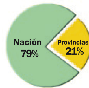
Distribución del aumento de la presión impositiva