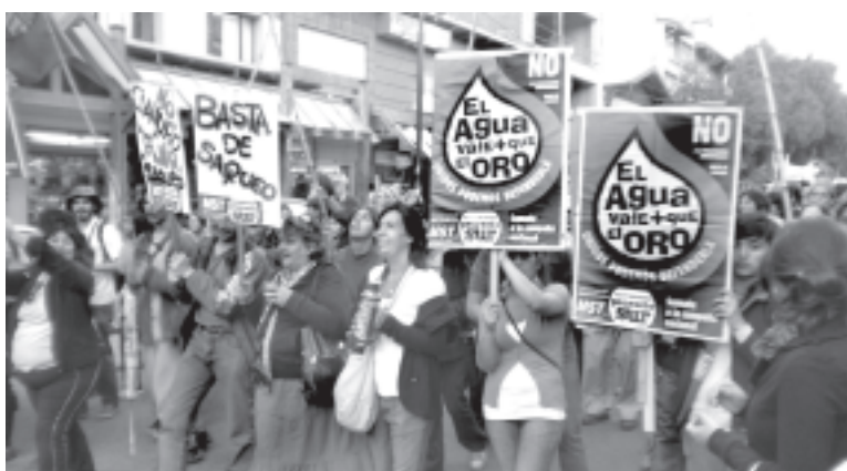
Las marchas arrancaron en enero y van a seguir con más fuerza.