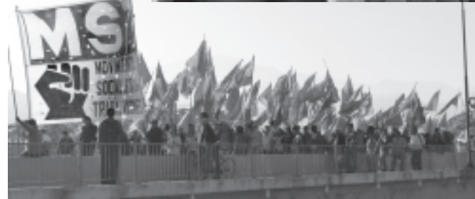
El MST en la marcha del apagón