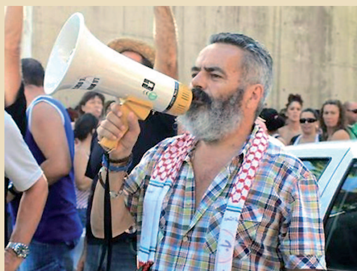
Incautación de alimentos en Andalucía.