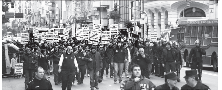
Los molineros salieron a luchar por la equiparación salarial y para que el Sindicato Molinero Nacional no aplique la delimitación geográfica.

En el gremio se abrió el debate salarial y la decisión de luchar por su Seccional Capital y suburbios, no es menor, porque los