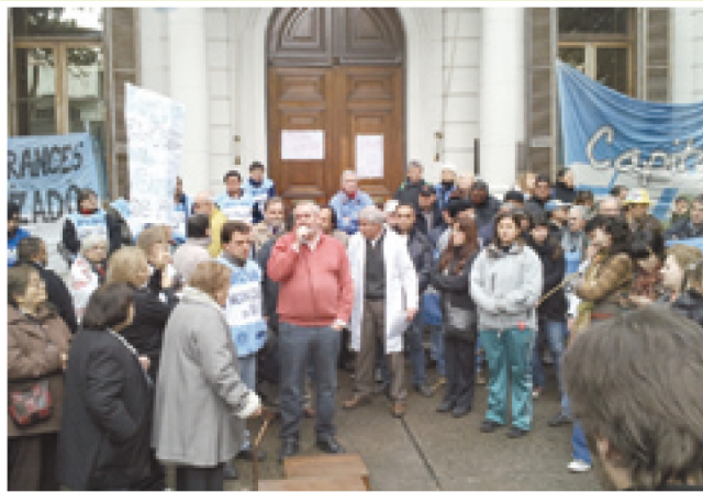
Acto en el Hospital Francés (PAMI) contra los despidos de profesionales contratados. Bodart expresó su apoyo a la lucha.