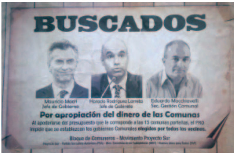
El Bloque de Comuneros del Movimiento Proyecto Sur porteño comenzó una campaña de denuncia y pegatina de afiches reclamando por el presupuesto que Macri no les pasa a las Comunas, buscando asfixiarlas.