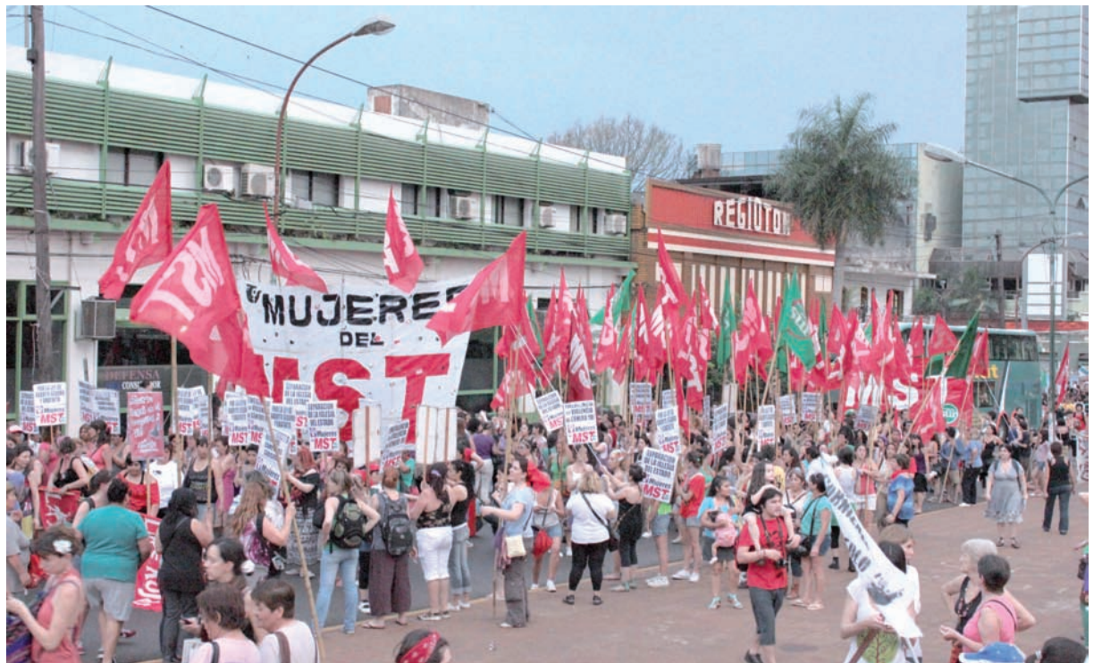
Una vista de la columna de las Mujeres del MST durante la marcha.

Un párrafo aparte merece el rol de nuestros compañeros varones, que esta vez fueron unos 20. A diferencia de otras corrien-