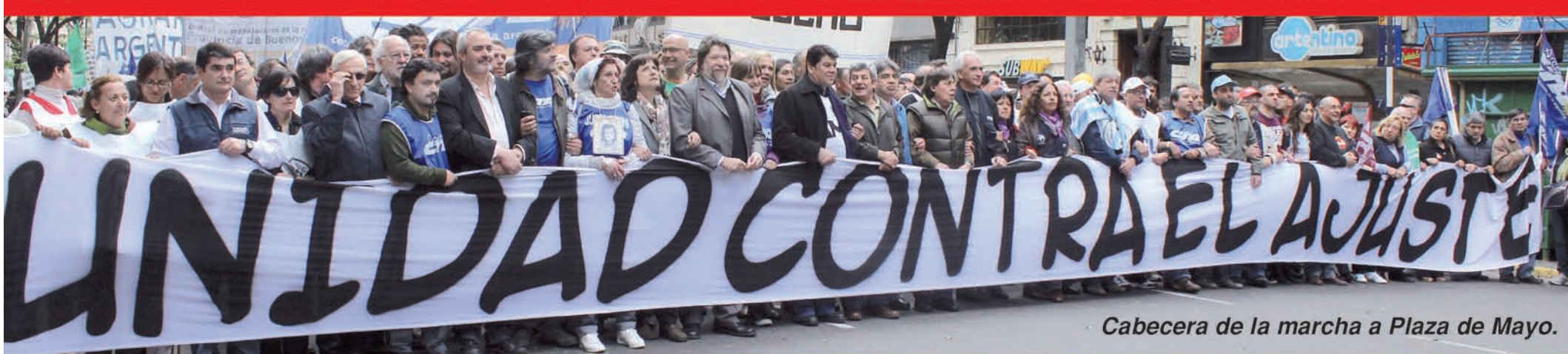
Cabecera de la marcha a Plaza de Mayo.

Huelga de prefectos y gendarmes (págs. 6 y 7)