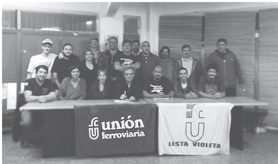
Mesa del Plenario de la Violeta del 29-9

Y nuestro ferrocarril Mitre, compite cabeza a cabeza con el Sarmiento para ver cual funciona peor, cual descarrila más cada semana, en cual invierten menos y cual es el que tarda más tiempo entre un servicio y el siguiente. Esto no va más! Hay que parar esta política de destrucción del sistema de transporte ferroviario que inauguró