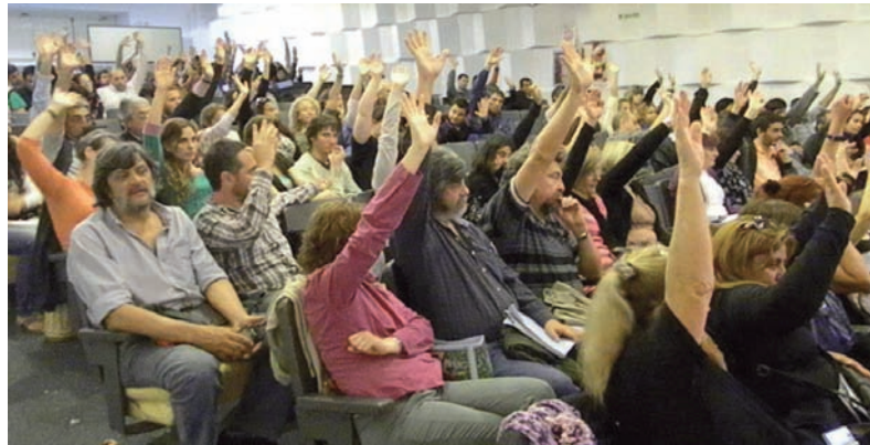
Votación en Plenario del Encuentro Educativo de CTA

Ratificando lo resuelto el día 9, al constituir esta nueva organización en la reunión en la sede de ATE. Designando una Mesa Provisoria de la Federación, abierta y con un representante por gremio y agrupación. Debiendo definir el Estatuto que exprese esa organización de nuevo tipo a construir: democrática, participativa y plural; unitaria y de lucha e independiente de los gobiernos, el Estado y las patronales.