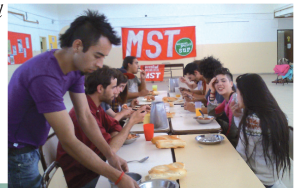
Grupos de Trabajo en Palpalá (Jujuy) y en Neuquén

inédito en la izquierda del país: un Campamento Internacional de jóvenes revolucionarios. Centenares de jóvenes de todo el continente tienen que ser recibidos por un contingente multitudinario de militantes de la juventud del MST en marzo del 2013. Desde Jujuy hasta Río Gallegos, de Cuyo hasta las comunas de Buenos Aires, en todas las regionales tenemos que planificar una intensa difusión de este evento. Desde ahora aprovechando las redes sociales y en pocas semanas con materiales públicos callejeros para empezar a instalarlo hasta el inicio del ciclo lectivo 2013 donde cada aula de cada estructura