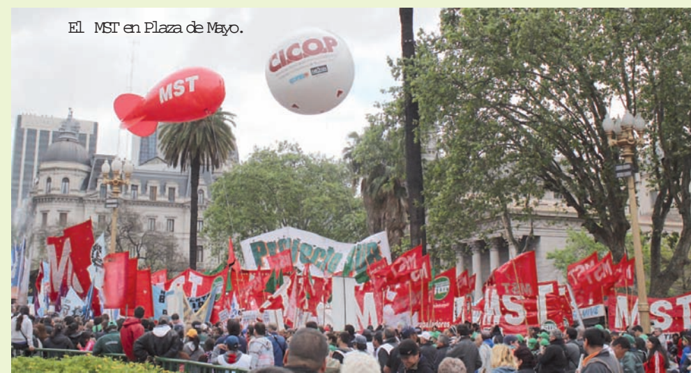
El MST en Plaza de Mayo.

Con varias las iniciativas que los han encontrado unidos. La foto es consecuencia directa de la política que viene defendiendo el líder del FAP, que no contiene ningún proyecto de transformación del país, sino sólo críticas a la forma de gobernar de los K. Es verdad que Cristina no escucha ni quiere dialogar con quienes piensan diferente; pero reclamarle eso compartiendo el micrófono con Macri o Cobos es completamente equivocado. Ni el Pro, ni la UCR, son modelos a seguir, ambos gobiernan contra el pueblo. Si queremos cambiar las cosas, tenemos que ir por una alternativa transformadora, las medias tintas siempre terminan a grandes frustraciones.