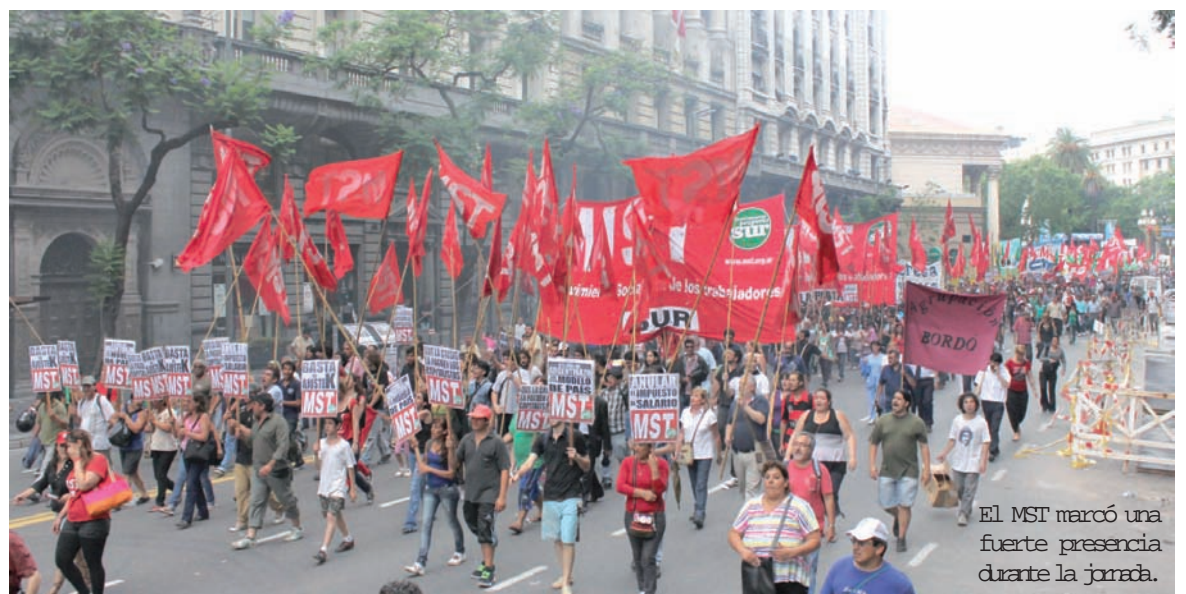
El MST marcó una fuerte presencia durante la jornada.