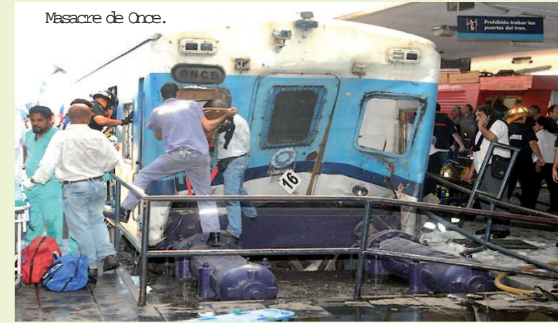
Masacre de Once.

El cepo al dólar, el escándalo de corrupción Boudou-Ciccone y las apariciones en cadena nacional mostrando un país sin inflación ni inseguridad venían generando malestar en grandes franjas de la sociedad. La desca-