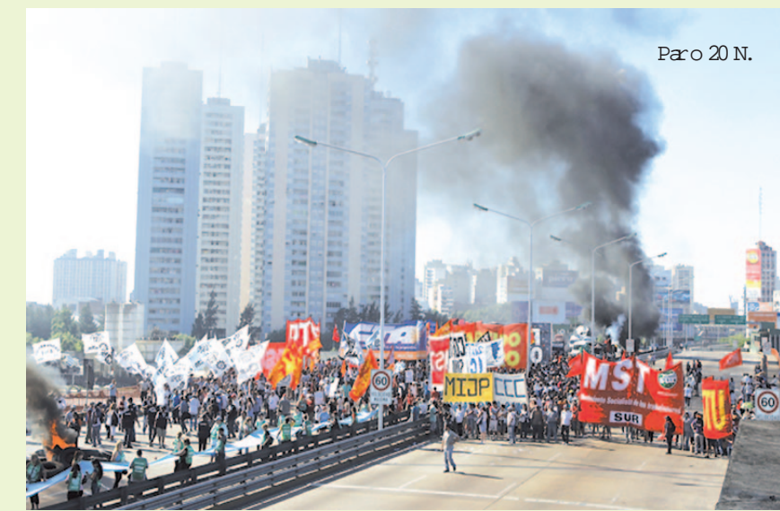
Paro 20 N.

dirigentes de los trabajadores tendrán el desafío de potenciar el proceso de lucha contra la burocracia sindical. Habrá procesos de organización y lucha en la juventud, en los barrios, en los frentes de género y diversidad, en todos ellos habrá que participar y ayudar a que se pueda avanzar. Pero habrá una tarea central que cruzará todo el 2013 y es la batalla político-electoral. La necesidad de fortalecer una alternativa como la que estamos construyendo (ver nota aparte) es fundamental para disputarle al kirchnerismo, al Pro y los viejos partidos, poniendo en pie una herramienta fuerte que pueda contener a muchos compañeros. Cada paso que podamos dar en función de estas tareas será clave para las futuras confrontaciones y desafíos que seguro vendrán.