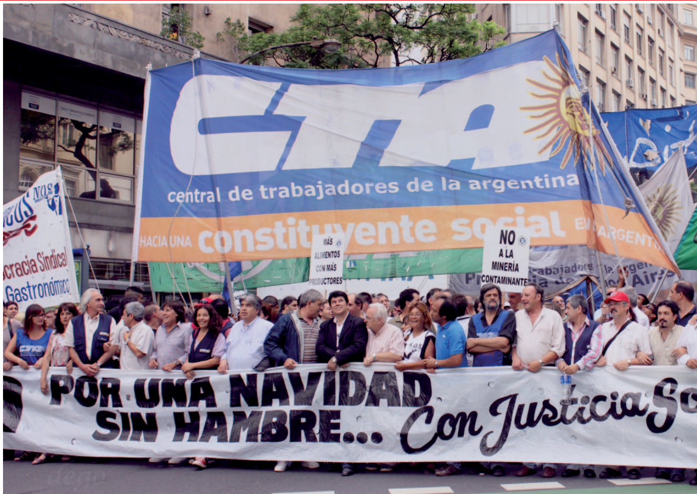
Cabecera de la columna de la CTA.

Desde la corriente sindical del MST nos comprometemos a seguir trabajando para avanzar en estos desafíos y te invitamos a sumarte.