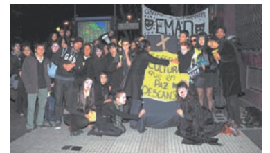
Protesta de la EMAD

Ha sido más que positivo. Creo que estamos recuperando lo mejor de la tradición de intervención militante en el campo