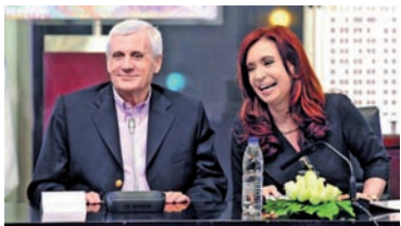
Caló de fiesta en Balcarce 50.