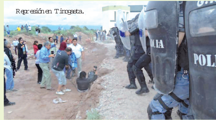
Represión en Tingasta.

del tren generó una onda expansiva que cuestionó el modelo de privatizar todo, dejando que empresas hagan grandes negocios sin poner un peso. Después vino el caso de la Fragata, confirmando que la política sigue siendo pagar la deuda. Y en noviembre hubo un apagón importante que colapsó Capital. Pero el ministro De Vido dijo que alguien 'bajó la palanca'. Cada una de estas cosas puso en evidencia que el modelo K no ha solucionado ningún problema