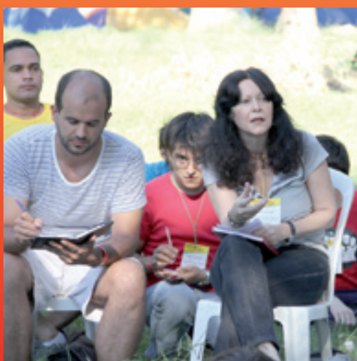
Maristella Svampa en uno de los talleres de luchas socioambientales