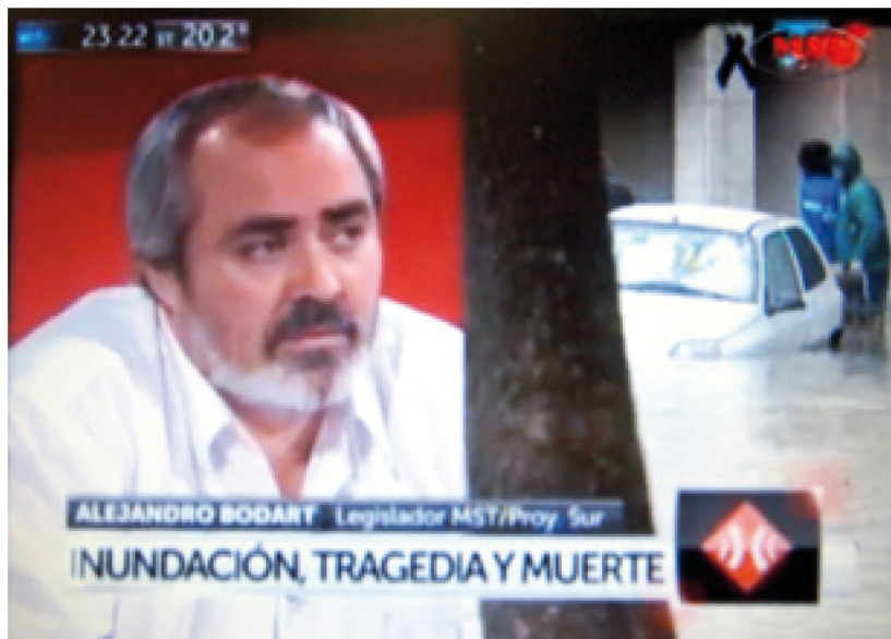
Bodart en "A dos voces"

Todos los interesados en colaborar pueden acercarse a las mesitas de la JS-MST en las facultades y profesorado de todo el país y comunicarse al mail mst.juventudsocialista