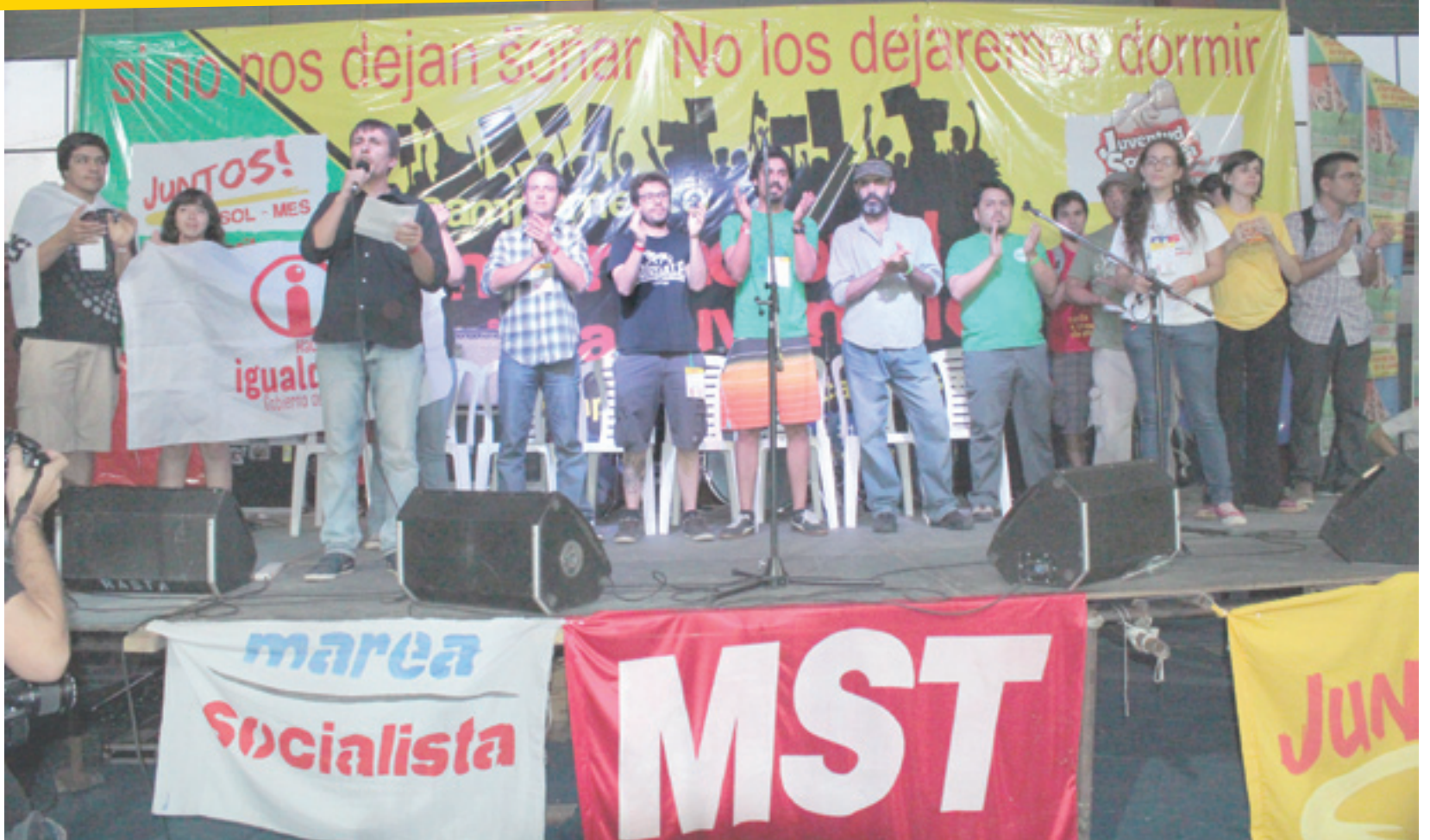
Delegaciones Internacionales presentes: NPA y Gauche Anticapitaliste (Francia), Igualdad (Chile), Movimiento 138 (Paraguay), RAP (R. Dominicana), Bloque de Izquierda (Portugal), Izquierda Anticapitalista (España), Enlace-PSOL (Brasil), C-SOL (Brasil) entre otras

“El Campamento es una iniciativa enorme y que nos pone en inmejorables condiciones para aprovechar la nueva etapa que abre la crisis capitalista. La verdad es que de conjunto se han reflejado experiencias de distintas partes del mundo, y los que atravesamos este evento salimos distintos, mucho más moralizados y estimulados para construir organización y luchar por