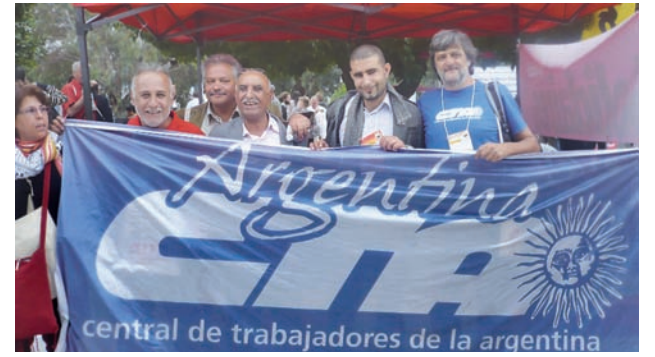
Con miembros de la UGTT (Central Obrera tunecina).

El balance y el futuro del propio foro, muy debatido, encierra una contradicción. Ya que por un lado resultó evidente la pérdida de fuerza y limitaciones del evento en sí mismo, con predominio de ONG,