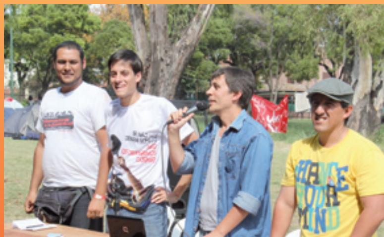
Lectura de las resoluciones