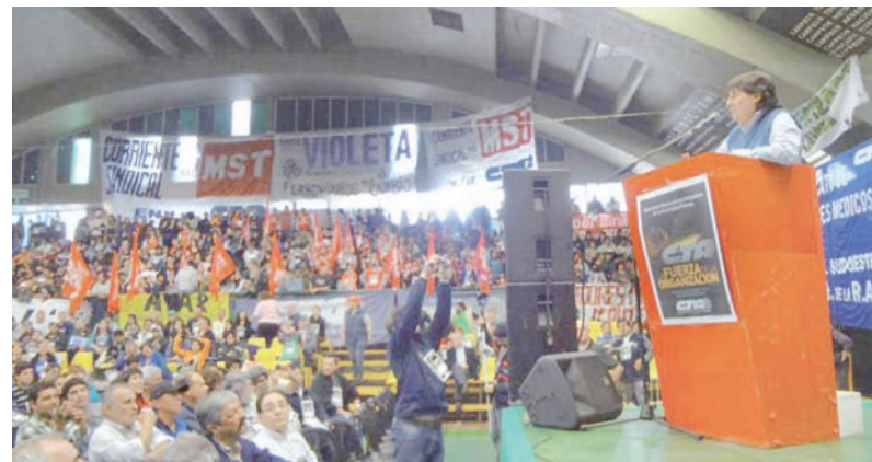
Encuentro de trabajadores privados de la CTA.

En segundo término, está el debate sobre cómo