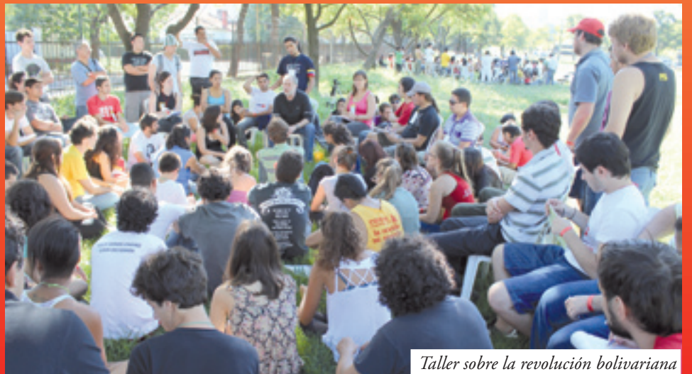
Taller sobre la revolución bolivariana