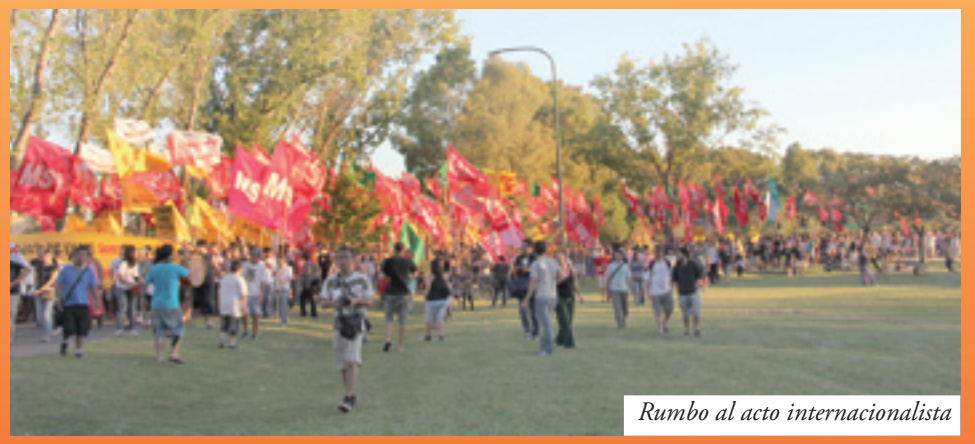
Rumbo al acto internacionalista