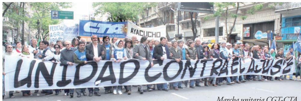
Marcha unitaria CGT-CTA.

Con estos aportes vamos al Congreso, apostando a que la Central siga creciendo. Nuestra corriente tiene la decisión de reforzar su participación. Vamos a redoblar los esfuerzos para la construcción de una CTA autónoma, democrática y de lucha para todos los trabajadores del país.