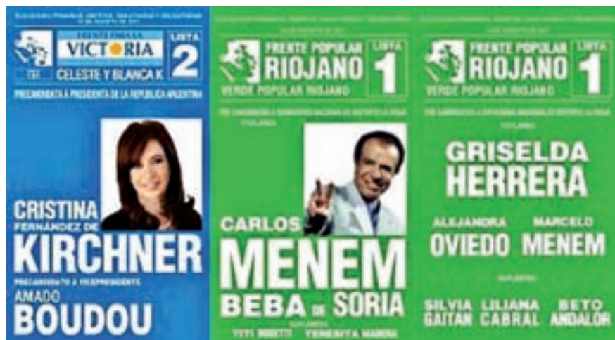
Cristina y Menem, juntos en las elecciones pasadas

Se investigaba el tráfico de 6500 toneladas de armas y municiones, ocurrido entre 1991 y 1995. En 2011, el ex presidente y los otros 17 acusados en el pro-