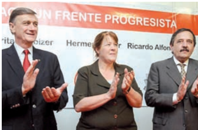
Binner, Stolbizer y Alfonsín

El ejemplo de la gestión compartida por PS y UCR en Santa Fe fue uno de los argumentos para defender la decisión tomada. Lo cierto es que no se han producido transformaciones significativas en esta provincia, donde se aplica el mismo ajuste a los estatales y el mismo modelo de monocultivo,