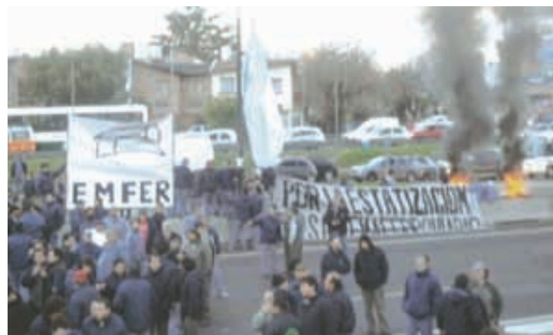
Los trabajadores cortando la General Paz

Pasaban las horas y kilómetros de cola hacia los dos lados de la Gral. Paz, mostraban un corte muy fuerte. Todos los medios gráficos, de radio y TV reflejaban la lucha.