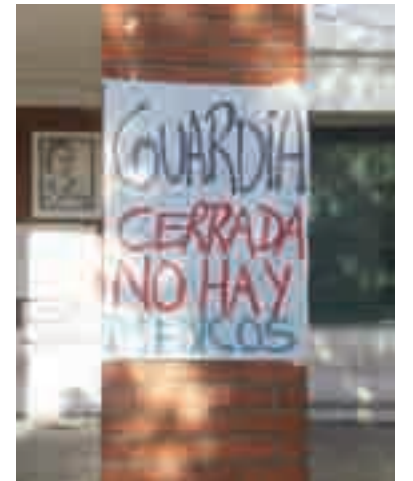
Con la lucha se crearon las condiciones para reabrir la guardia

Los compañeros permanecen en estado de asamblea permanente, monitoreando con una comisión paritaria la marcha de los compromisos y en la primera semana de