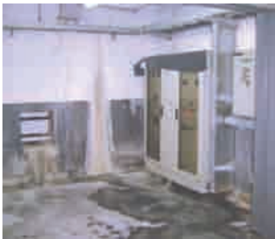
Estación Rosas: tablero eléctrico, entre filtraciones y agua.

Bodart explicó: “Macri apura inauguraciones de campaña sin prever los riesgos. En la estación y el taller-cochera no sólo existe riesgo eléctrico, sino graves incumplimientos a la Ley 19.587 de Seguridad e Higiene y al decreto 351/79. Nuestro amparo se basa en los relevamientos técnicos realizados por especialistas y delegados del subte.” El escrito, de 22 carillas y con 57 fotografías,