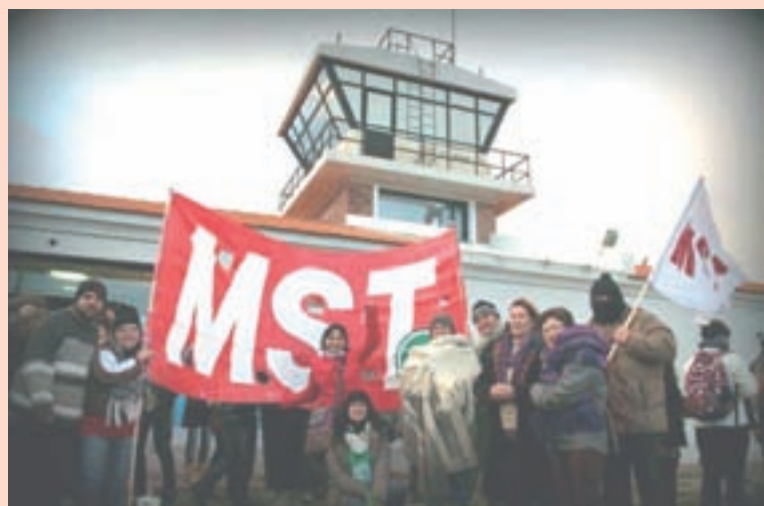
El MST presente en el acto en el viejo Aeropuerto