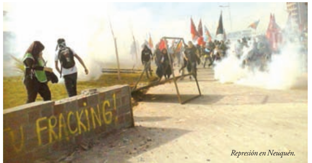
Represión en Neuquén.

Es decir: con el argumento de ampliar el stock energético en realidad se depreda y contamina para garantizarle insumo a las corporaciones del saqueo nacional. Un escándalo.