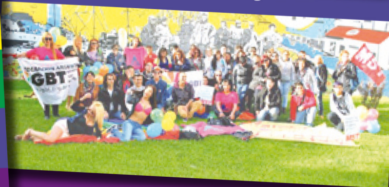
Comodoro Rivadavia: la primera Marcha del Orgullo