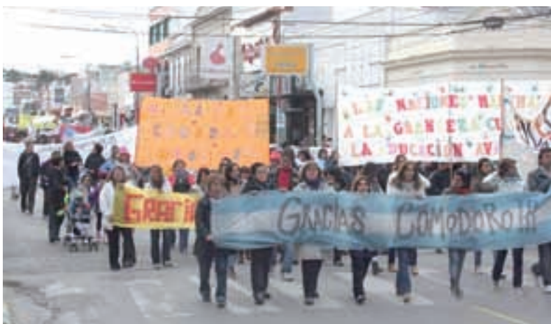
8/11: Marcha del agradecimiento a la comunidad. X100PRE GRACIAS

Pasamos por todas las medidas de desgaste del gobierno K: 1) Conciliación Obligatoria tramposa que no aceptamos. 2) Reuniones con funcionarios municipales que no garantizaban nada. 3) Viajes a Rawson a "negociaciones" donde solo nos decían que "plata no había". 4) Ofrecieron un bono de $1000, pagado en 2 meses por única vez, para los que ganaban menor salario. 5) Sufrimos durísimos descuentos, sanciones y cartas de intimidación; presiones y persecución; amenazaron con que iban a cubrir nuestros cargos con jubilados o cerrar el año por decreto. 6) Padecimos la subestimación y falta de acompañamiento de la conducción de ATECH Provincial y la CTERA. 7) Calumnias y censura de los medios oficialistas. 8)