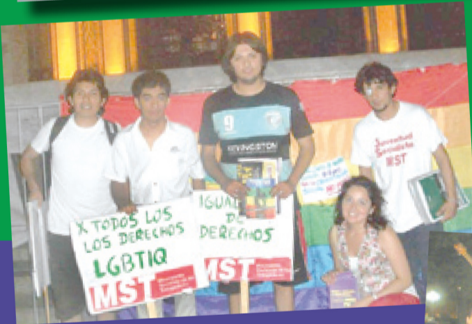
Tucumán: la primera Marcha del Orgullo.

Córdoba - Sábado 16 V Marcha del Orgullo y la Diversidad