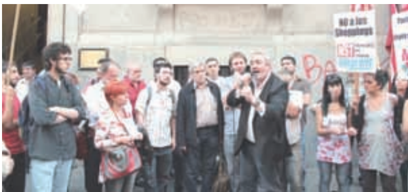
Acto unitario del 6 de noviembre frente a la Legislatura

Asimismo, alerta sobre todo lo que se viene en esta Legislatura en los próximos días. De última, si quisiéramos actuar bien, esta ley no es ninguna prioridad: la podríamos postergar para que se discuta el año que viene en comisión, con un análisis de cada caso. Lo mismo con las otras leyes, incluso por una cuestión democrática, ya que se ha elegido una nueva composición de esta Legislatura. Deberíamos dejar que esa nueva composición resuelva los problemas. No dejemos que se impregnen de duda estas votaciones, cuando están en juego cargos y gente que se va y está buscando una salida laboral más importante que la que tenía al momento de entrar acá. (Aplausos).