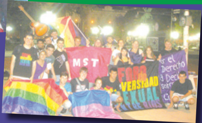
Entre Ríos: radio abierta del Orgullo.

Parque Las Heras: 14 hs, Picnic y Feria 18 hs, Marcha