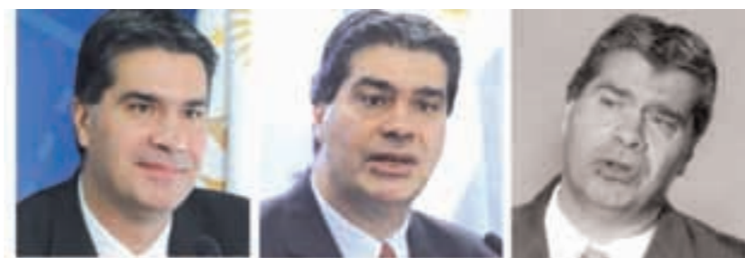
Coki Capitanich: el ministro «estrella» que se desdibuja al compás de la crisis.

Mientras el gobierno finge «cuidar» los precios y Binner no dice nada, fue Massa quien planteó «cinco medidas» para supuestamente combatir la inflación. El tema es que son medidas para estimular a los sectores industria-