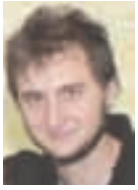
Lic. Mariano Veiga Hospital Moyano

Es sabido que el sistema de salud pública nacional y también el porteño están en crisis. Lejos de atenuarse, los efectos de la reforma de los '90 se agravaron en la "década ganada". En la Capital, el distrito más rico del país, ni siquiera se avanzó en temas básicos como designar el personal suficiente para atender la creciente demanda. Un ejemplo es el sector de Enfermería, cuyo déficit es de miles y lo reconoce hasta el gobierno macrista.