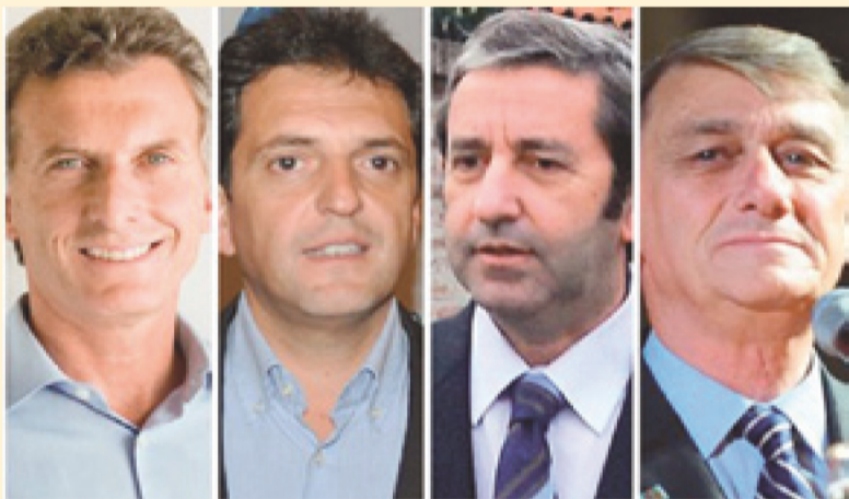
Mucha crítica pero la misma receta de ajuste

Por el lado de los economistas del massismo, no se encuentran cambios sustanciales, todos los mensajes apuntan en el mismo sentido del ajuste, la vuelta al "mercado internacional" y el reclamo de un "plan" que tiene que ser elaborado junto con los empresarios y los burócratas, mechando algunos anuncios "electoraleros" para disfrazar sus intenciones, pero dejando en claro que gobierno y oposición, comparten la idea de que la salida de la crisis es que la paguemos los trabajadores y el pueblo.