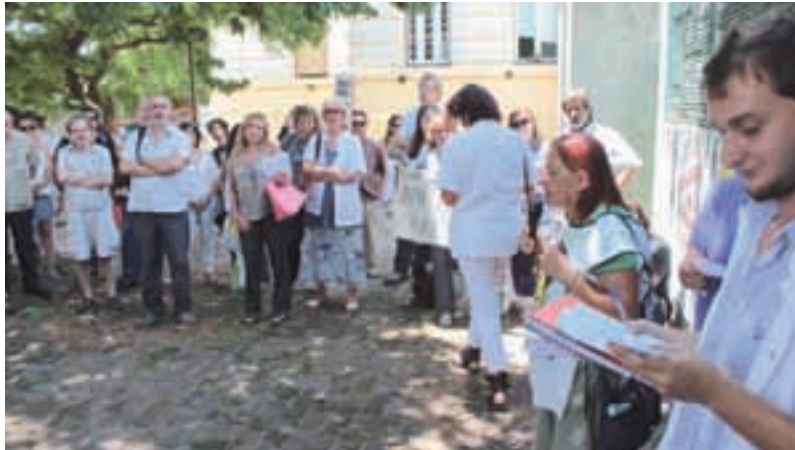
Radio abierta en el Hospital Moyano

ros estamos con incertidumbre y bronca ante la falta de cobro de 2 ó 3 meses atrasados. En el caso del Hospital Moyano, se expresa en los que se encuentran bajo el régimen de suplencias de guardias. Para colmo, debido a las acciones de lucha, sumariaron a trabajadoras sociales y el macrismo ordenó una auditoría de todo el hospital, que realiza hasta 3 controles diarios de presentismo de forma invasiva.