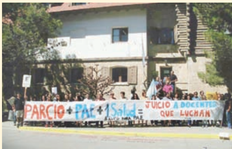
Concentración frente al Juzgado Federal contra el procesamiento y embargo de sueldos de dirigentes de ATECH Sur