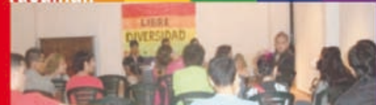
Exitosa charla debate de "Libre Diversidad" el 15/2 en la Casa de la Cultura, Municipalidad de Tucumán.