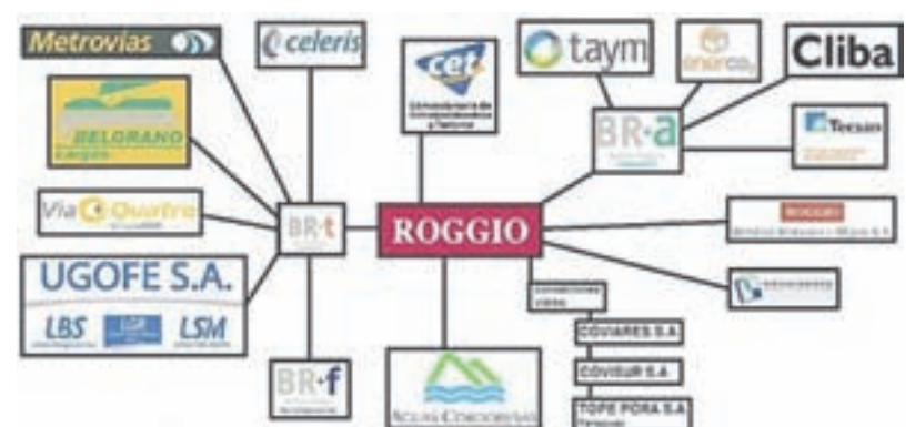
El grupo Roggio y sus empresas: "la distribución de la riqueza" del gobierno K

Durante 20 años, las empresas privadas administraron los ferrocarriles y los llevaron a su actual colapso. La lista Verde de Pedraza antes y de Sassia ahora, fueron cómplices del vaciamiento y destrucción del ferrocarril. Fundieron el tren de cargas más largo de Argentina. Se embolsaron millones y más millones mientras el servicio se destruía y los usuarios viajaban cada vez peor.