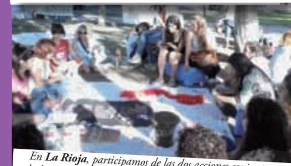
En La Rioja, participamos de las dos acciones conjuntas que hubo: el 7, una jornada de debate, y el 8, una concentración, ambas en la Plaza 25 de Mayo. Estuvimos el Movimiento Universitario de Mujeres (MUM), IS y Juntas y a la Izquierda.