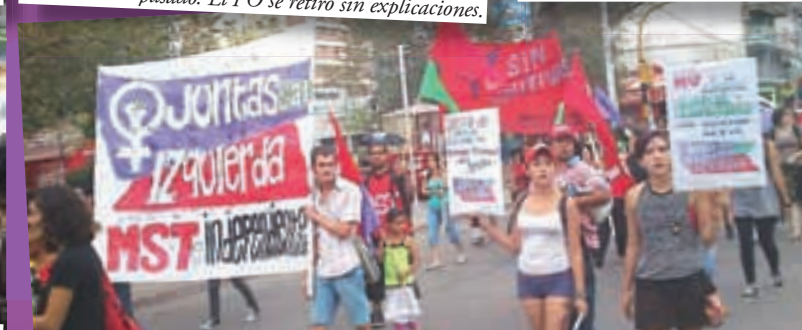
En Neuquén, el 28 de febrero hicimos una charla sobre la reforma del Código Civil. El 8 fuimos parte de la convocatoria unitaria, con marcha por el centro, junto a toda la izquierda, grupos feministas y algunas delegaciones sindicales.