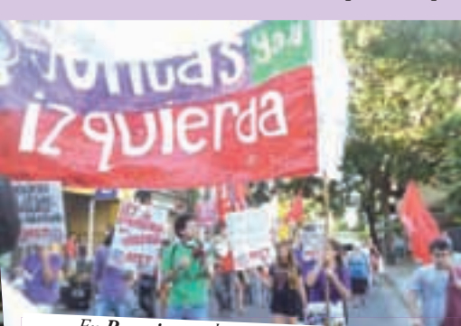
En Rosario, también estrenando la bandera de Juntas y a la Izquierda, fuimos con una dinámica columna a la manifestación unitaria, que culminó en el Monumento a la Bandera con la lectura de un documento conjunto y fue mayor que la del año pasado. El PO se retiró sin explicaciones.