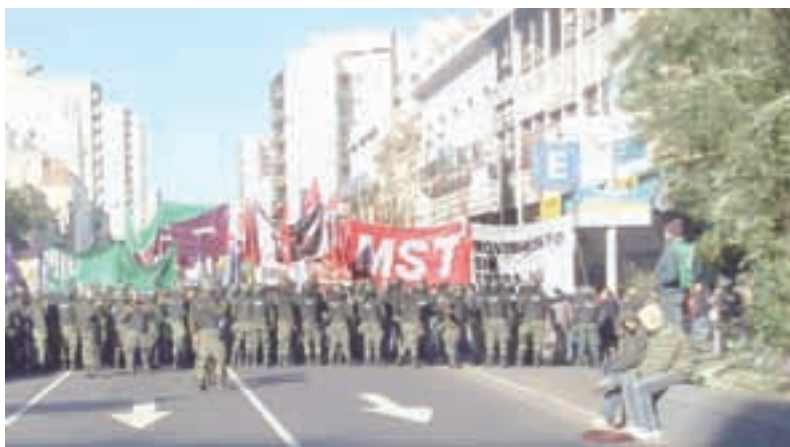
Gendarmería en el Puente Pueyrredón