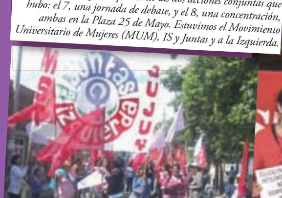
En Jujuy, ciudad donde no hubo iniciativas unitarias, el viernes 7 nos movilizamos a la Plaza Belgrano, ante la sede de la gobernación provincial, con nuestra nueva bandera, mucho entusiasmo y combatividad.