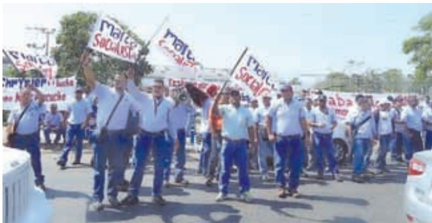
Trabajadores de automotrices, movilizados por sus derechos junto a Marea Socialista.

Lentamente se despereza un pueblo que tiene una heroica tradición de lucha. En este marco es que Marea Socialista convoca a la realización de encuentros regionales de trabajadores que culminarán en un Encuentro Nacional el próximo 29 de marzo. Contra la pasividad de la Central de Trabajadores oficial y la traición de la UNeTE y otras que defienden el derecho a la «protesta» de la derecha. Marea Socialista redobla su llamado para debatir e impulsar una política de lucha en defensa de las conquistas del proceso bolivariano.