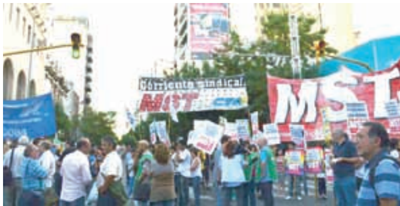
Jornada de lucha de la CTA en Córdoba

para colmo el jefe de gabinete salió por todos los medios a decir que el paro era "exagerado". Exagerado es que los funcionarios y los diputados ganen más de $40.000 y nosotros tengamos que conformarnos con menos de $6.000 en una provincia donde la canasta familiar cuesta más del doble de nuestro salario. El miércoles 19 hay una nueva paritaria y si no hay una propuesta que se acerque a los $11.000 de inicial que reclamamos vamos a seguir con nuevas medidas de lucha