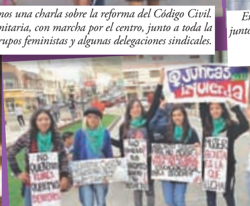
En Comodoro Rivadavia, Chubut, también fuimos parte de la movida conjunta realizada por el Día de la Mujer Trabajadora.