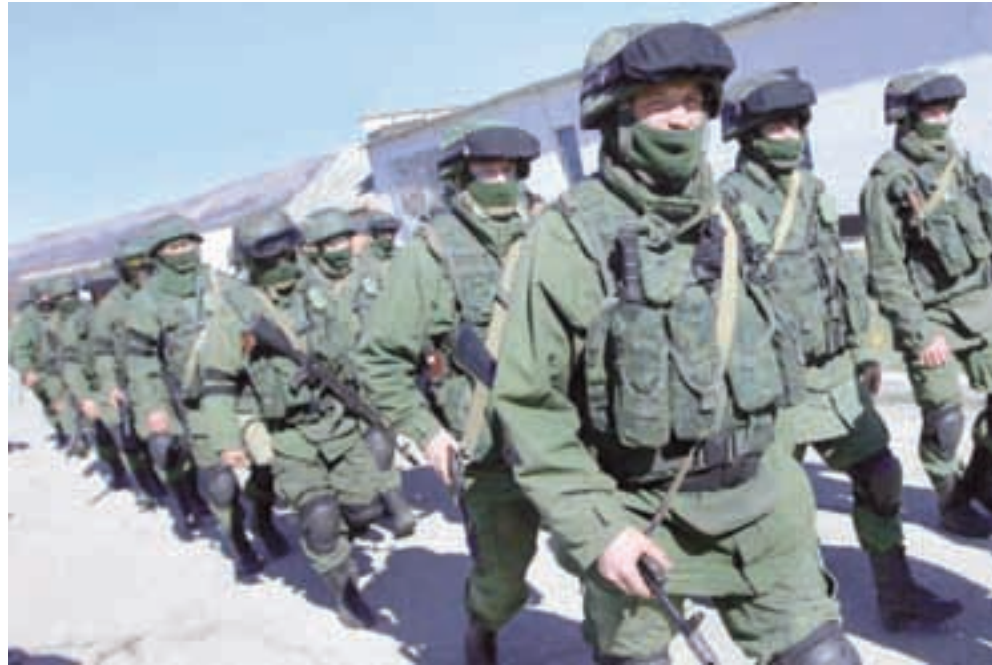
Mientras las tropas rusas amenazan Ucrania, en Crimea impulsieron un referéndum tramposo.

Cualquier forma de protesta social está condicionada por sus causas y peculiaridades del desarro-