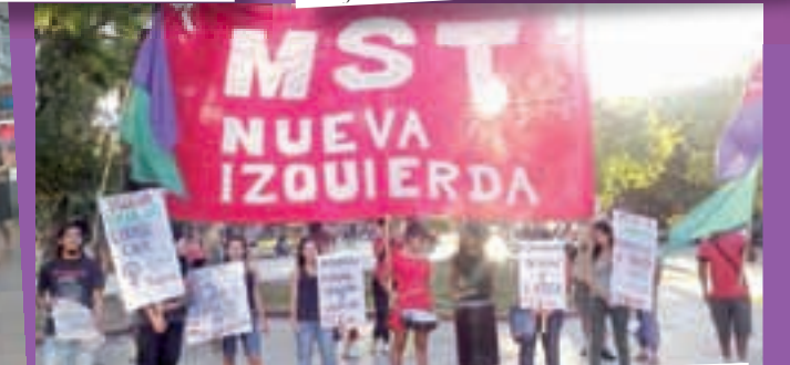
En San Juan, participamos de las dos actividades que hubo: una movida junto al PTP-PCR y luego un acto más unitario, con la Campaña Nacional por el Derecho al Aborto, Izquierda Socialista, un sector K y los grupos culturales Las Martinis y El Barro.