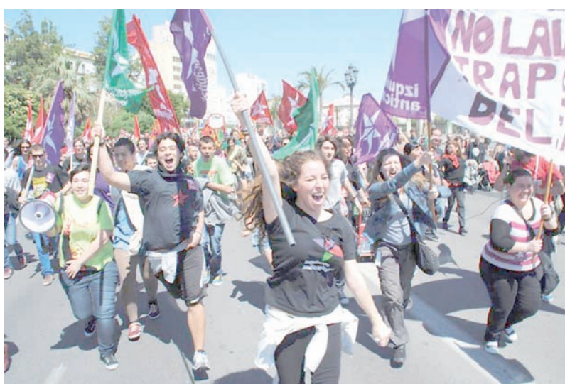
Marcha de la Dignidad en España

El Manifiesto estatal ha permitido trasladar un conjunto de reivindicaciones... desde el plano político al social... el impago de la deuda ilegítima,