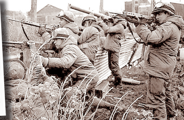
La Gesta de Malvinas fue una gran movilización anti imperialista

No es casual que el 2 de abril de 1982 estuviera precedido por un importante paro general llamado por la CGT Brasil el 30 de marzo, apenas tres días antes. La Dictadura venía deteriorándose. A la enorme bronca de los obreros y un crecimiento de la resistencia, entre ellos de los movimientos de derechos humanos, se le sumaba el abandono de la clase media, que luego de un primer apoyo pasivo, ahora sufría un fuerte deterioro en sus ingresos como consecuencia de un brutal plan de Martínez de Oz.