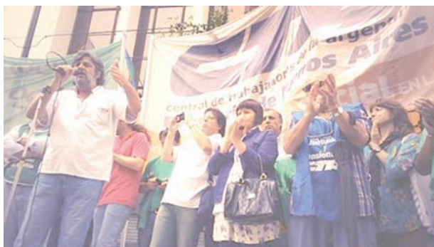
Acto en Casa de la Pcia. de Buenos Aires

Scioli pretendía un techo del 18 a 22% y discutir en marzo, pero tan pronto como se sumaron los trabajadores de ATE y judiciales se adelantó la convocatoria para el 26 de febrero y se empezó a mover la propuesta salarial al ritmo de un fuerte