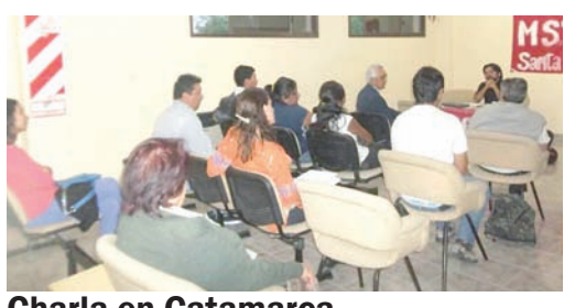
Charla en Catamarca