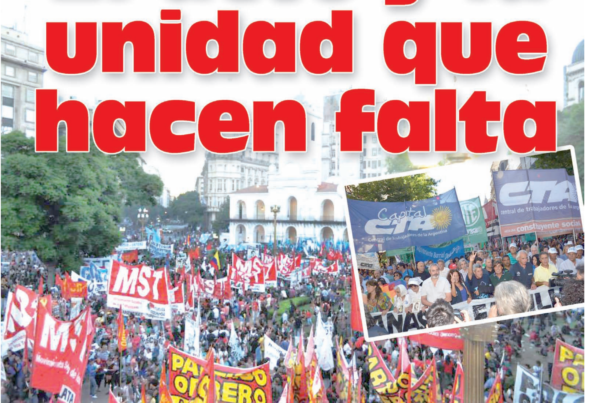
El 12 y el 24 de marzo, marchas unitarias llenaron la Plaza de Mayo.

Entramos al mes de abril en medio de importantes conflictos obreros y mucho debate político y gremial. No es para menos. Semanas enteras de una enorme huelga docente en Buenos Aires tiñeron toda la situación. Esa heroica lucha fue un ejemplo y pudo conseguir más, si no fuera por el rol de la vieja burocracia sindical que no unificó nacionalmente la pelea y después levantó el paro a las corridas en Buenos Aires, aunque se mantienen varias provincias todavía con conflicto docente. A la vez, las CGT de Moyano y Barriónuevo dejaron solo éste y otros conflictos y terminaron convocando un paro a destiempo, demostrando una vez más el nefasto rol que ocupan. De ahí que seamos los trabajadores quienes tenemos que debatir y decidir qué hacer frente al paro del 10/4. Y cómo pelear por transformarlo en una jornada y huelga activa, con un programa genuino de reclamos ajeno a