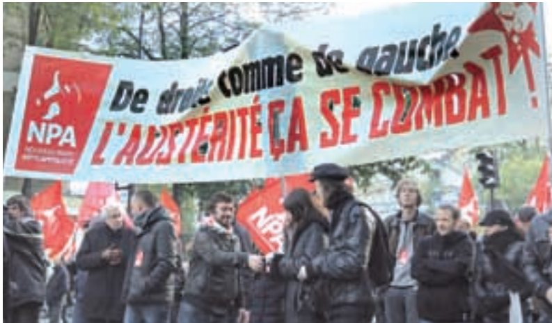
París, 12/4. "Sea de 'izquierda' o de derecha, la austeridad se combate" fue la consigna del NPA en la marcha unitaria anti-gobierno que reunió a casi 100.000 personas. También se movilizaron el Frente de Izquierda y otras organizaciones políticas y sociales.

Ayer el movimiento de los boinas rojas 2 y hoy la marea de abstención anuncian el fin de la relativa paz social de la que goza Hollande gracias a los dirigentes gremiales y del Frente de Izquierda. Los que creen -incluso en el NPA- que la abstención equivale a desmoralización o pasividad, se privan de entender la