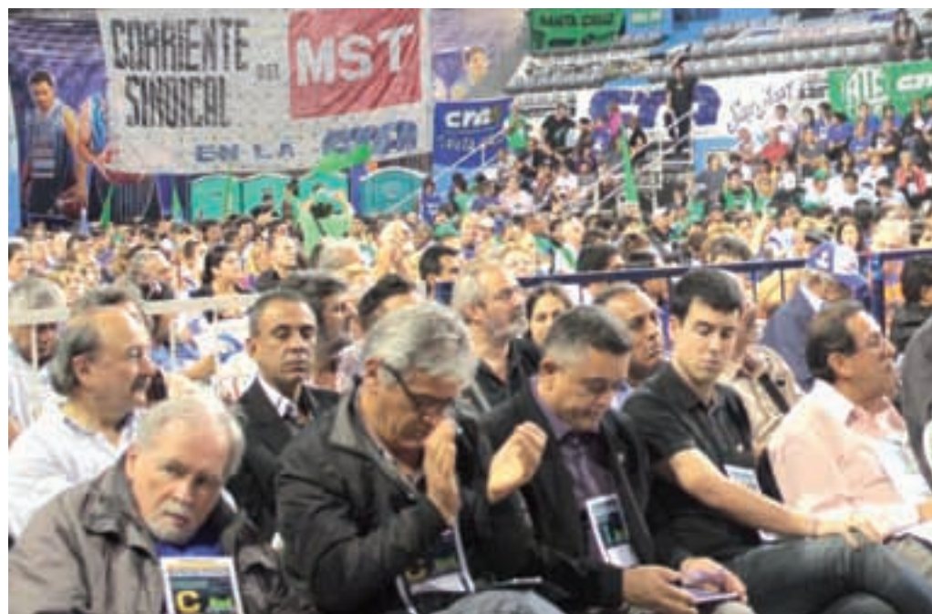
Una vista del Congreso de Mar del Plata.

Lamentablemente, lo demostró la realidad de la jornada del 10, se perdió una oportunidad. No solamente para que la CTA sume su potencial de movilización para fortalecer el paro, sino para que aparezca en las calles como un actor protagónico, dándole visibilidad al programa de 33 puntos y marcando un norte concreto para miles de trabajadores que necesitan una central «clasista y anticapitalista» y que están hartos de la vieja burocracia sindical.