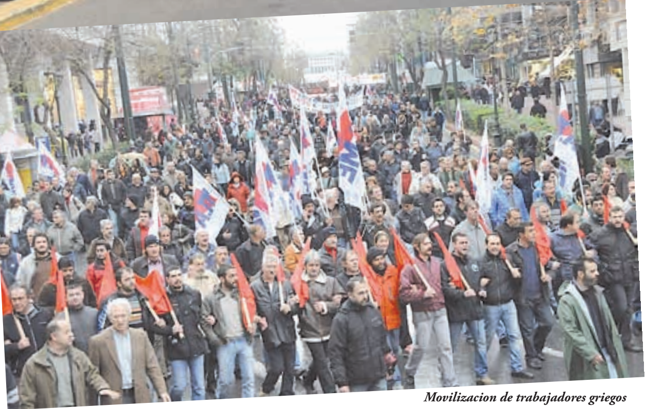
Movilización de trabajadores griegos

En lo inmediato, y después del positivo rol que jugamos tanto el 24 de marzo como en el paro del 10 de abril, ahora tenemos una nueva oportunidad: lograr que el 1° de Mayo se realicen actos unitarios del conjunto de la izquierda política y social en Buenos Aires y en todo el país. Eso sería un nuevo impulso de apoyo a las luchas y al proceso de nueva dirección, a la vez otra demostración de que unidos podemos hacer grandes y representativos eventos. Y también sería un acto que apoye a los trabajadores de todo el mundo que enfrentan la crisis capitalista. En este sentido volvemos a insistir en esta propuesta que le hemos hecho llegar a diversas fuerzas de izquierda y a las corrientes que integran la CTA. Y en particular al PO y a las fuerzas del Frente de Izquierda a quienes les proponemos que hacia el 1° de Mayo se dejen de lado cálculos electorales y, más allá de las lógicas diferencias que tenemos, construyamos en común un acto unitario y de lucha entre nuestras fuerzas y junto a