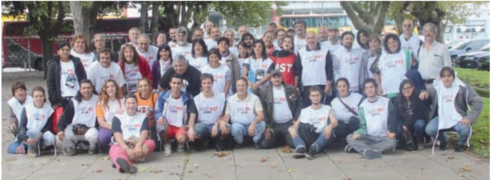
Parte de la delegación de la Corriente Sindical del MST.