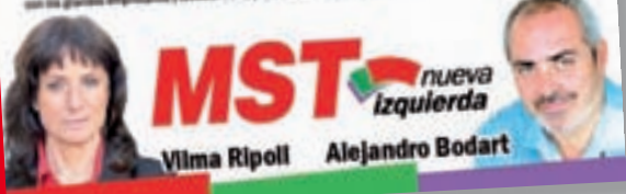
Folleto de campaña

Muchos de los trabajadores y jóvenes que se movieron en el último tiempo se preguntan: ¿Por qué no se puede construir una alternativa de izquierda que sea capaz de enfrentar a la derecha y a los sectores que se oponen a los cambios necesarios? ¿Por qué no se puede construir una alternativa que sea capaz de enfrentar a la derecha y a los sectores que se oponen a los cambios necesarios? ¿Por qué no se puede construir una alternativa que sea capaz de enfrentar a la derecha y a los sectores que se oponen a los cambios necesarios?