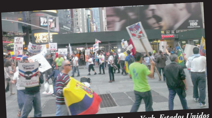
Nueva York, Estados Unidos