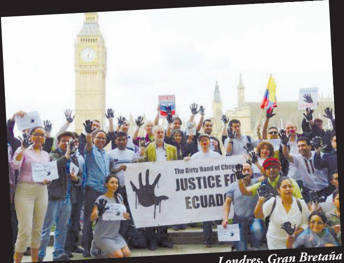
Londres, Gran Bretaña