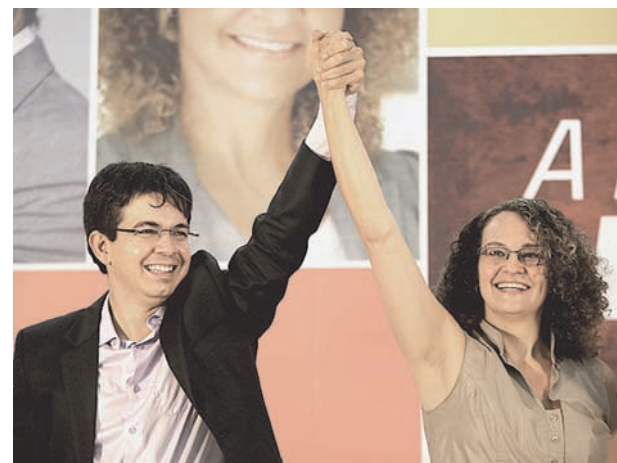
Randolfe Rodrigues y Luciana Genro, candidatos del PSOL para las elecciones presidenciales.