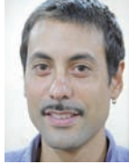
Paul Quelle Lista Violeta Ferrocarril Sarmiento

El lunes 11 los ferroviarios del Sarmiento empezamos un quite de colaboración que se cumple con fuerza de manera mayoritaria producto de un gobierno que viene haciendo oídos sordos a los reclamos de los ferroviarios que llevan más de 2 años sin respuesta. Se está desarrollando con tanta contunden-