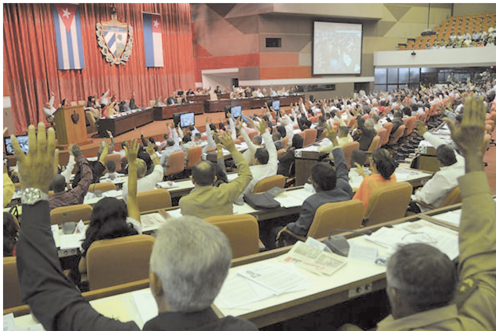
Parlamento cubano votando nueva Ley de Inversiones extranjeras.

Brasil y la Unión Europea: potencias al acecho No es casual en este contexto que la potencia brasileña se haya volcado en pleno a ser parte de este plan político-económico. Comenzando precisamente por el fabuloso negocio del Puerto de Mariel. Cuando en enero de este